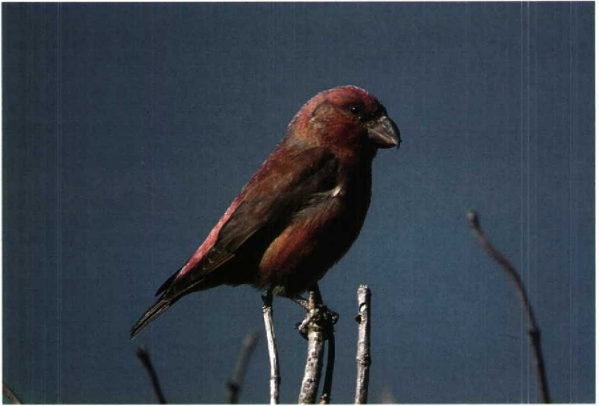
201 Grote Kruisbek Loxia pytyopsittacus , Kennemerduinen, Noordholland, oktober 1990 202 Kleine Goudplevier Pluvialis fulva , Abbega, Friesland, november 1990