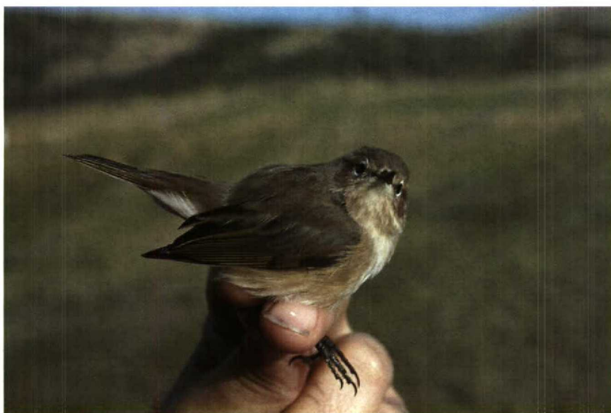
193 Tjiftjaf Phylloscopus collybita met kenmerken van Siberische ondersoort P c tristis , Bloemendaal, Noordholland, oktober 1990 (Arnoud B van den Berg)