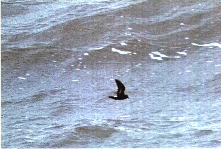
185-186 Stormvogeltje Hydrobates pelagicus , IJmuiden, Noordholland, september 1990