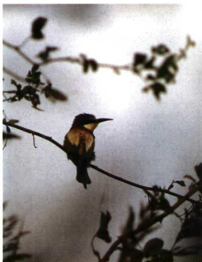
191 Bijeneter Merops apiaster , Schiermonnikoog, Friesland, september 1990 (Leo J R Boon)