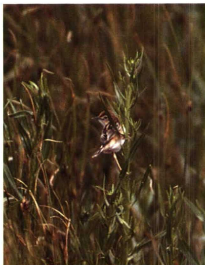
192 Graszanger Cisticola juncidis , Paal, Zeeland, augustus 1990 (Hans Gebuis)