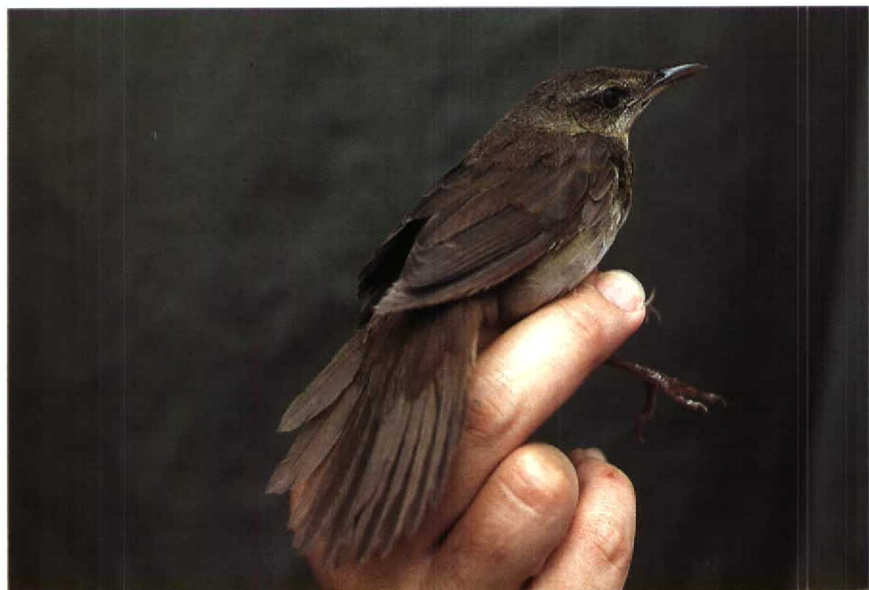
6 Gray's Grasshopper Warbler Locustella fasciolata , immature, Karakelang island, Talaud islands, North Sulawesi, Indonesia, February 1985 (Frank Rozendaal)