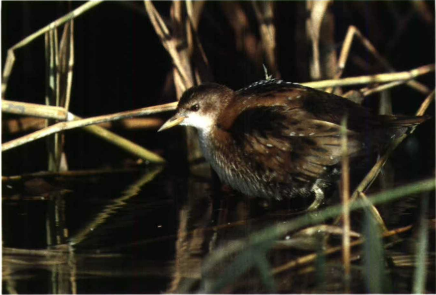
187 Klein Waterhoen Porzana parva , Eemshaven, Groningen, augustus 1990 (Leo J R Boon) 188 Rosse Franjepoot Phalaropus fulicarius , Alphen aan den Rijn, Zuidholland, september 1990 (René van Rossum)