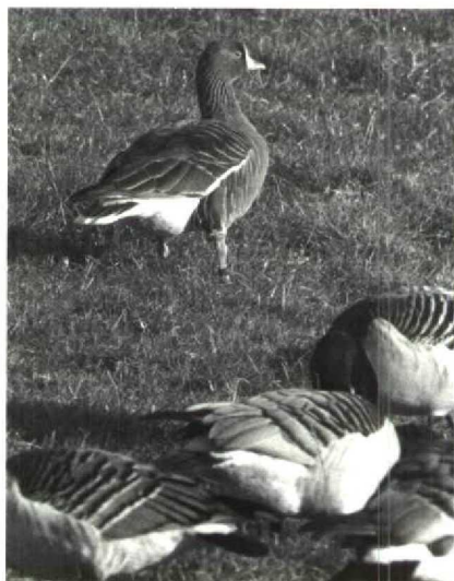
30 Dwerggans Anser erythropus , Strijen, Zuidholland, december 1989

Z. Vanaf 6 december kon men bij Nieuw-Lekkerland Zh, een adult exemplaar, tot ver in het nieuwe jaar, een handje geven. Flamingo's Phoenicopterus ruber roseus werden tot in november gezien in de Oostvaardersplassen Fl en het Lauwersmeer Gr (op beide plaatsen maximaal twee). Verder werden ze nog gemeld bij Deventer, Den Oever Nh, de Flauwers Inlaag Z en de Philipsdam Z. Vanaf 20 november zaten vijf Dwergganzen Anser erythropus bij het Verdronken Land van Saeftinge Z; na 28 november bleef er nog één tot 9 december. In Flevoland werden exemplaren gezien langs de Ibisweg Fl op 2 december, de Meerkoetweg Fl op 3 december en de Strandgaperweg Fl op 25 december. Bij Stad aan 't Haringvliet Zh verbleef één exemplaar van 3 tot 26 december, bij Stellendam Zh één op 8 december, in de Workumerwaard Fr van 10 tot 26 december maximaal drie, bij Strijen Zh maximaal acht in de maand december en van 26 tot 28 december één bij de Flauwers Inlaag. Verschillende exemplaren waren voorzien van kleurringen. Opmerkelijk was het verschijnen van vijf adulte Sneeuw-