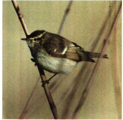
26 Hume's Warbler Phylloscopus humei , New Biggin, Northumberland, Britain, November 1989 (A S Butler)