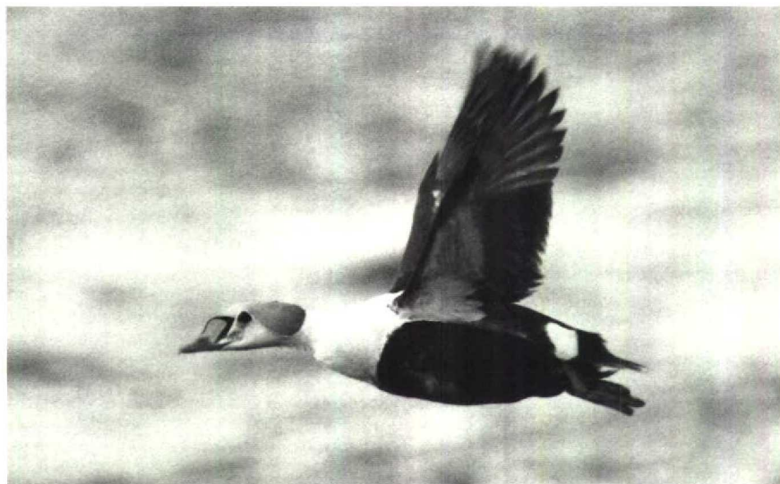
89 Koningseider Somateria spectabilis , Harlingen, Friesland, april 1990 90 Steppekievit Chettusia gregaria , IJsselstein, Utrecht, april 1990