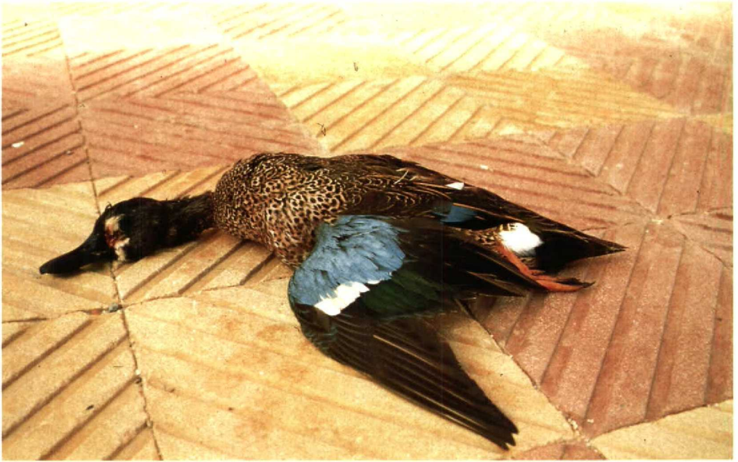
95 Blue-winged Teal Anas discors , shot at Lake Burullus, Egypt, March 1990

from Algeria (Dejonghe 1981) and seven from Morocco (Michel Thévenot in litt), including the recovery in October 1970 of a bird ringed at Prince Edward Island, Canada (Dejonghe 1981). It is possible that the Blue-winged Teal found in Egypt joined a flock of Garganey somewhere in western Africa during the winter and subsequently reached Egypt during spring migration.