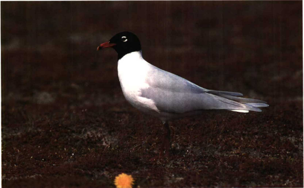
118 Zwartkopmeeuw Larus melanocephalus , Maasvlakte, Zuidholland, april 1991