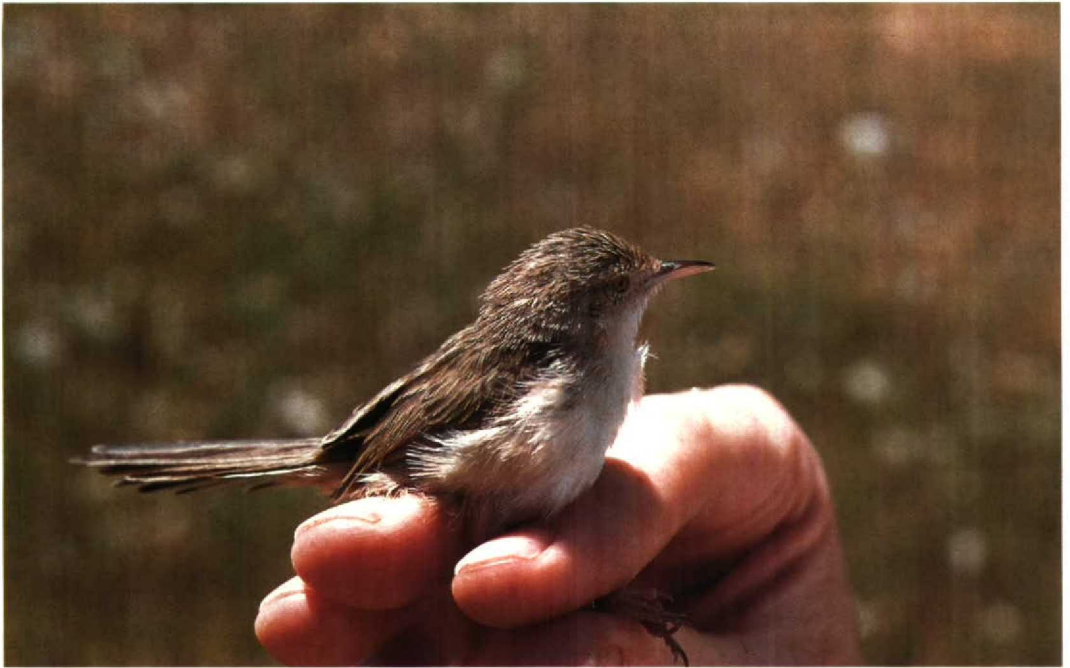
100 Graceful Warbler Prinia gracilis , adult, presumably female, showing bright iris colour and pale bill, Suez, Egypt, April 1990 101 Graceful Warbler Prinia gracilis , adult male showing black bill, Hula, Israel, March 1990