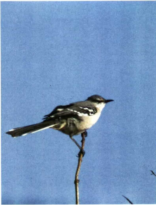
89 Spotlijster Mimus polyglottos , Schiermonnikoog, Friesland, oktober 1988 (Sander van de Water)