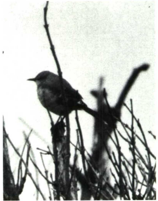
90 Spotlijster Mimus polyglottos , Schiermonnikoog, Friesland, oktober 1988

Britannië enkele soorten vastgesteld die door Robbins (1980), in zijn lijst van potentiële Nearctische dwaalgasten naar Europa, als minder waarschijnlijke dwaalgasten werden gerangschikt of zelfs niet in de lijst werden genoemd, zoals Geelvleugelzanger Vermivora chrysoptera en Rosse Boomklever Sitta canadensis (Doherty 1989, Hutton & Varney 1989, Rogers & Rarities Committee 1990).