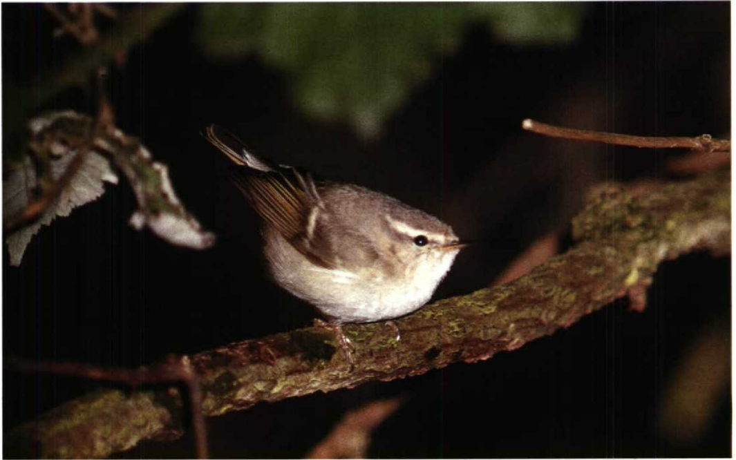
37 Hume's Yellow-browed Warbler Phylloscopus humei , De Blocq van Kuffeler, Flevoland, December 1990 (Arnoud B van den Berg)

From 29 November to 5 December, a confiding first-winter female Desert Wheatear O deserti remained on Southwold beach, Suffolk, Britain. Finland produced a Black-throated Thrush Turdus rufo-collis atrogularis at Nurmijärvi on 20 November. A Lanceolated Warbler Locustella lanceolata was reported on Ouessant, Finistère, on 28 October (the third record for France if accepted). A male Sardinian Warbler Sylvia melanocephala was seen at Porthgwarra, Cornwall, Britain, on 3 November. In November, there was an influx of Hume's Yellow-browed Warblers Phylloscopus humei , affecting Britain (at least one bird), the FRG (one bird) and the Netherlands (no less than four birds). This coincided with an apparent influx of other eastern warblers such as Pallas's Proregulus , Yellow-browed P inornatus , Radde's P schwarzi and Dusky Warblers P fuscatus . A Dusky Warbler in the HW-duinen, Zuidholland, from 29 November to 4 December meant the first December record for the Netherlands. Three Siberian Nuthatches Sitta europaea asiatica were caught at Pape on 27 and 28 October and 5 November, respectively, being the second to fourth records for Latvia. A Wallcreeper Tichodroma muraria returned to winter in Amsterdam-Buitenveldert, Noordholland, the Netherlands, on 27 November, again roosting behind the