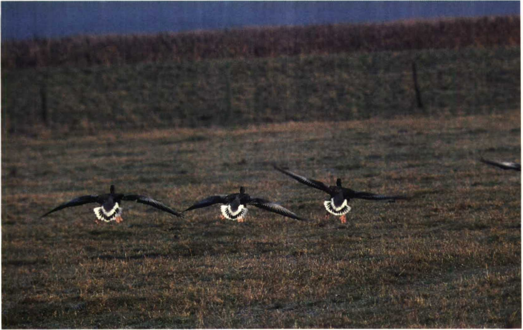
144 Greylag Geese Anser anser , Verdrongen Land van Saeftinge, Zeeland, 30 November 1989

Mystery photograph 42. Solution in next issue