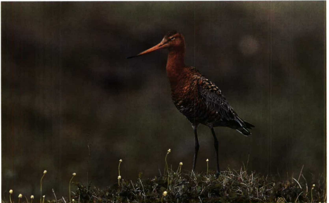
131 Icelandic Godwit Limosa limosa islandica , Myvatn, Iceland, 26 June 1990

It is not generally realized that Black-tailed Godwit has three different types of summer-plumage feathers: 1 Feathers growing early in the pre-breeding moult (presumably when the birds are still in their winter quarters) which are intermediate in appearance between winter- and summer-plumage feathers. These feathers are pale grey (as in winter plumage), not rufous, but differ from winter-plumage feathers in showing a black central streak or arrow mark. They are usually restricted to mantle, scapulars and/or upperbreast. Except for some females, few or none of these feathers remain when the birds are on the breeding grounds. The feathers were scored