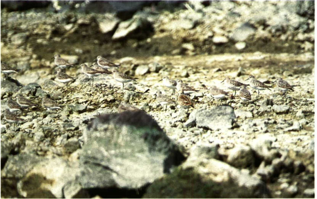
137 White-rumped Sandpipers Calidris fuscicollis , Ilha Terceira, Azores, 28 August 1990

band along the lower rear edge of the folded wing. Another c 25% of the birds retained the smartly patterned scapulars of summer adults. These birds resembled juveniles since the feathering appeared new and the wing-coverts fresh and pale-fringed. However, at close range, the pale fringes were obviously faded and worn and none of the birds was noted as having the fresh crisp fringes typical of juvenile plumage (Killian Mullarney in litt after examination of transparencies).