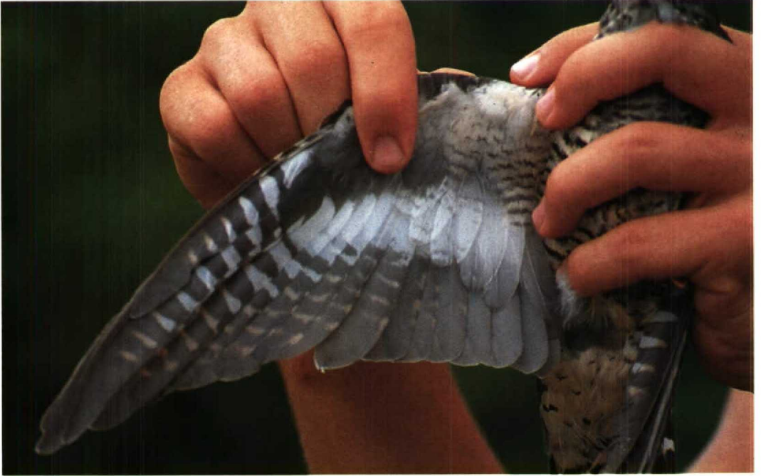
141 Oriental Cuckoo Cuculus saturatus , immature, showing underwing pattern, Mai Po, Hongkong, September 1989 142 Cuckoo Cuculus canorus , adult female, showing underwing pattern, Rye Meads, Hertfordshire, Britain, May 1990