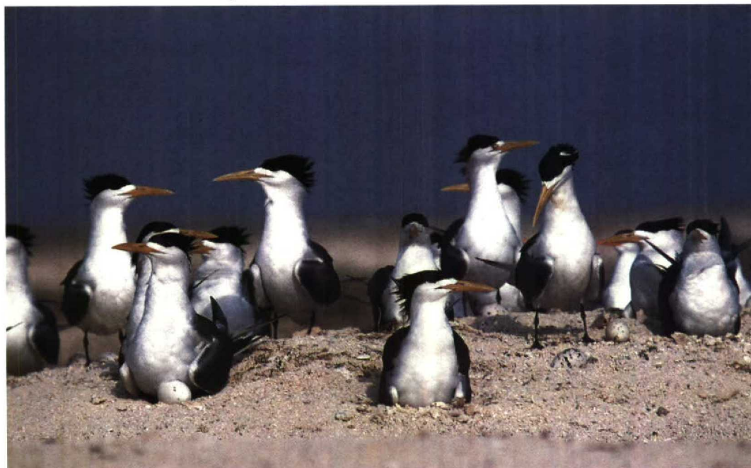
148 Crested Terns Sterna bergii , Karan, Arabian Gulf, Saudi Arabia, June 1991 (Arnoud B van den Berg)