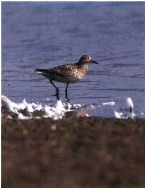
126-127 Siberische Strandloper Calidris acuminata , Philippine, Zeeland, 18 september 1989 (Arnoud B van den Berg, René Pop)

Van begin af aan was duidelijk dat alleen Gestreepte en Siberische Strandloper voor de determinatie in aanmerking kwamen. Op grond van bovenstaande beschrijving kan de Gestreepte Strandloper vrij vlug worden uitgesloten. Als belangrijkste verschilpunten met de aanwezige Gestreepte Strandloper vielen op: 1 de platte buik; 2 de iets langere poten en iets kortere snavel; 3 de rondere en iets kleinere kop; 4 de plattere kruin; 5 de goudgele borst met lichte streping en de niet abrupte afscheiding daarvan met witte onderdelen; 6 de lichtgrijze kleine en middelste vleugeldekveren; en 7 de opvallende rosse kruin en witachtige wenkbrauwstreep. Ondermeer vanwege enkele (bij Gestreepte Strandloper ontbrekende) zwarte chevrons (vooral op de voorflank) en het gesleten kleed was het een adulte vogel. Voor verdere verschillen tussen beide soorten zij verwezen naar Hayman et al (1986).