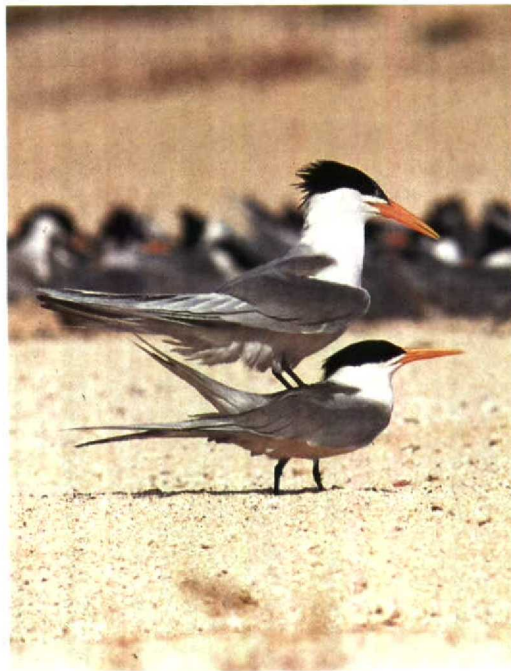
147 Lesser Crested Terns Sterna bengalensis , Karan, Arabian Gulf, Saudi Arabia, June 1991 (Arnoud B van den Berg)