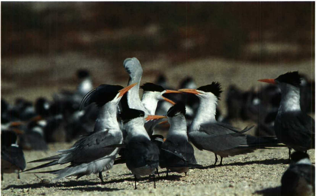
145 Lesser Crested Terns Sterna bengalensis , Karan, Arabian Gulf, Saudi Arabia, June 1991

Arnoud B van den Berg, Michael I Evans & Peter Symens, c/o Duinlustparkweg 98, 2082 EG Santpoort-Zuid, Netherlands