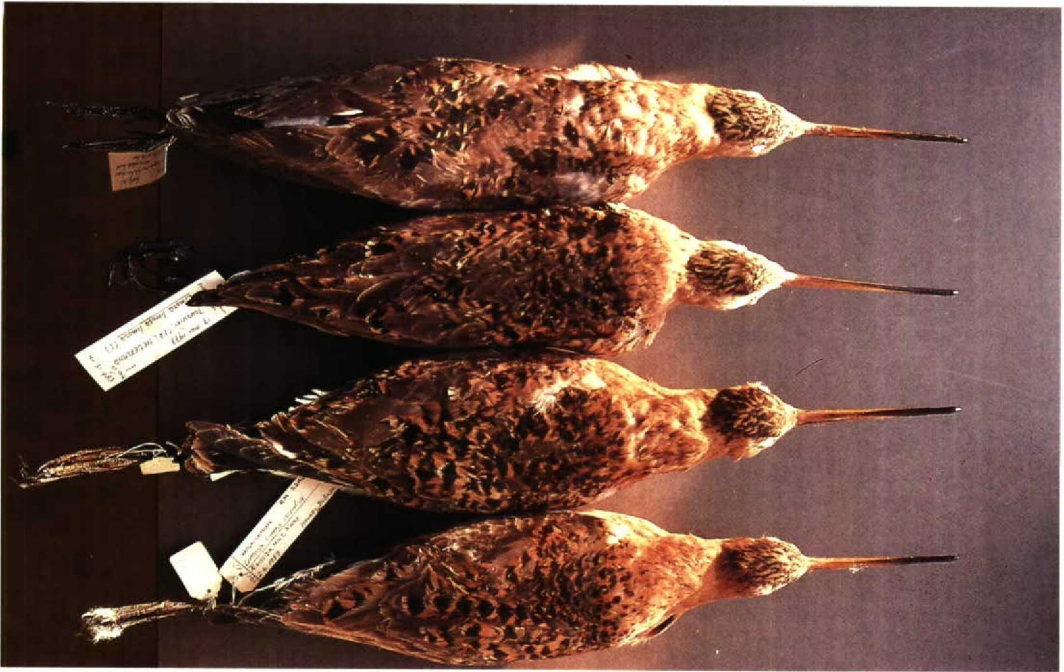
128-129 Black-tailed Godwit Limosa limosa , males (from top to bottom): two L l limosa , Zunderdorp, Noordholland, 20 May 1966 and Jouswier, Friesland, 17 May 1977; two L l islandica , Iceland, 2 June 1957. These are average birds of each subspecies; some limosa are distinctly darker and more extensively red, others much paler and less extensively cinnamon; differences in pattern and amount of summer plumage between females is much less pronounced but difference in tinge of rufous is same as shown by males (Gerrit J Gerritsen)