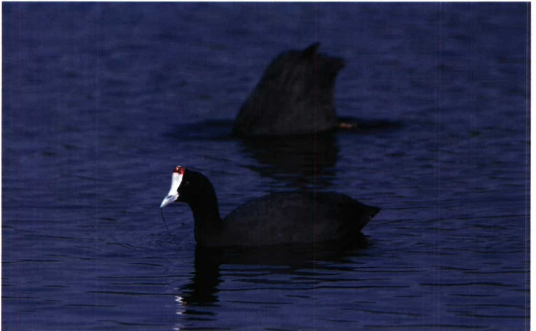
125 Crested Coot Fulica cristata , Sidi Bou Rhaba, Morocco, 22 December 1987