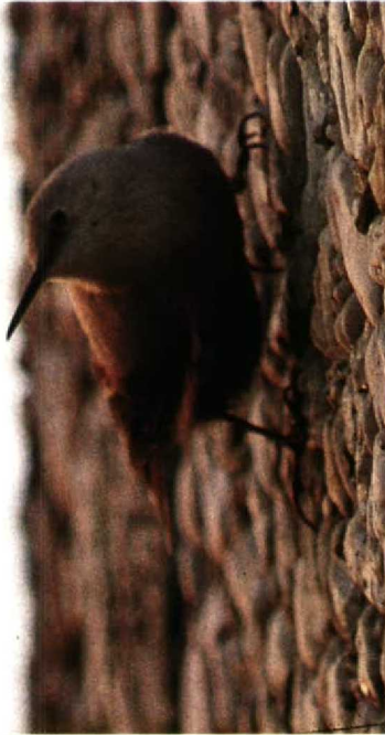
132 Rotskruiper Tichodroma muraria , VU-hoofdgebouw, Amsterdam-Buitenveldert, Noordholland, 15 november 1989 (Arnoud B van den Berg)

opnieuw op het VU-terrein en omgeving aangetroffen. De vogel vertoonde hetzelfde gedrag als in de voorafgaande winter en was aanwezig tot 5 april 1991.