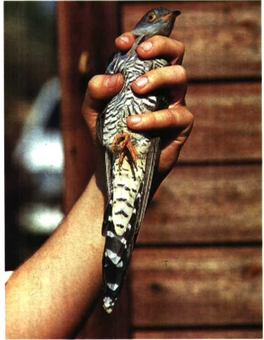
139 Cuckoo Cuculus canorus canorus , adult female, showing broad barring on underparts, particularly on flanks, and also ochre-tinged undertail-coverts, Rye Meads, Hertfordshire, Britain, May 1990 140 Oriental Cuckoo Cuculus saturatus horsfieldi , adult female, showing underwing pattern, Talaud Islands (north of Sulawesi), Indonesia, February 1985

Information on the field identification of Oriental Cuckoos is limited and little progress has been made in recent years. Redman (1985) drew attention to complex problems of both field and museum identification. He did, however, consider the width of the barring on the underparts of Oriental Cuckoo to be broader than in Cuckoo and