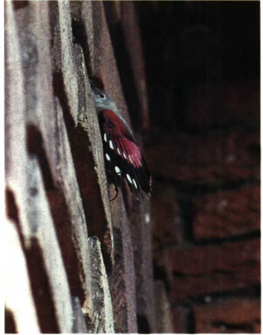
133-134 Rotskruiper Tichodroma muraria , Augustinusparochiekerk, Amsterdam-Buitenveldert, Noordholland, 31 maart 1990 (Lammert van der Veen)

april nog steeds een gedeelte van het winterkleed vertoont (Kees Roselaar pers med). Het is echter onwaarschijnlijk dat de Rotskruiper van Amsterdam in april 1990 nog in volledig winterkleed was. Het leek daarom waarschijnlijk dat de Amsterdamse vogel een vrouwtje betrof. Overigens vertoont c 60% van de vrouwtjes in zomerkleed eveneens een individueel variërende hoeveelheid zwart op de borst zodat bij aanwezigheid van zwarte borstveren een vrouwtje in zomerkleed niet uit te sluiten is; de hoeveelheid zwart is bij mannelijke exemplaren echter groter dan bij vrouwelijke (Löhr 1967).