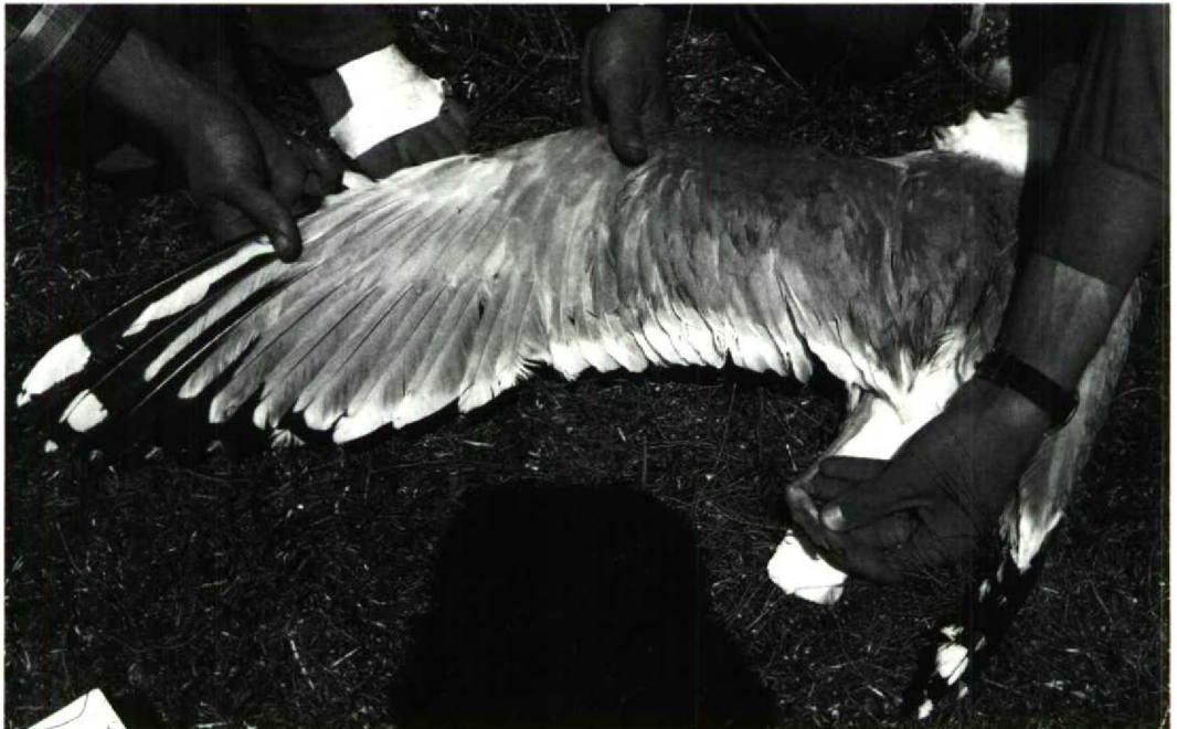
143 Wing of adult Yellow-legged Gull L c cachinnans (sensu Glutz von Blotzheim & Bauer 1982), breeding colony at Sivash, Azov/Black Sea, Ukraine, USSR, May 1989. Note six black-marked primaries (p5-10) with trace of black on p4, white wedge on inner web of p10 and wide black band on inner web of p8. Compare with wing of claimed L c cachinnans from Vistula mouth, Poland (Dutch Birding 12: 16, plate 9, 1990) (Czeslaw Nitecki)

tips on five primaries only – as the bird depicted in Dubois et al's plate 9 – seem to be virtually absent among typical cachinnans . Again, five (or less) black-marked primaries are common in northern populations (54% of a sample of 200, cf Barth 1968; 65% of a sample of 169, cf Coulson et al 1982) but less frequent further south, eg in Germany (13% of a sample of 160, cf Goethe 1961) and Great Britain (20% of a sample of 1424, cf Coulson et al 1982), where a more extensive black pattern predominates. 3 Within the European range, a thayeri pattern on p9 seems to be restricted to Fennoscandia where it forms a SW-NE cline of increasing frequency, reaching 27% (of a sample of 15) in eastern Finnmark (Barth 1968) and again 27% of 95 museum skins from north-western Russia (Coulson et al 1984). It is virtually absent in central and western Europe (0-1% in north-western Germany, the Netherlands and Great Britain) (Barth 1968, Coulson et al 1984) and we are not aware of any records of this character from southern populations of the complex. In fact, the thayeri pattern has been used as a reliable criterion for the identification of northern Scandinavian birds among