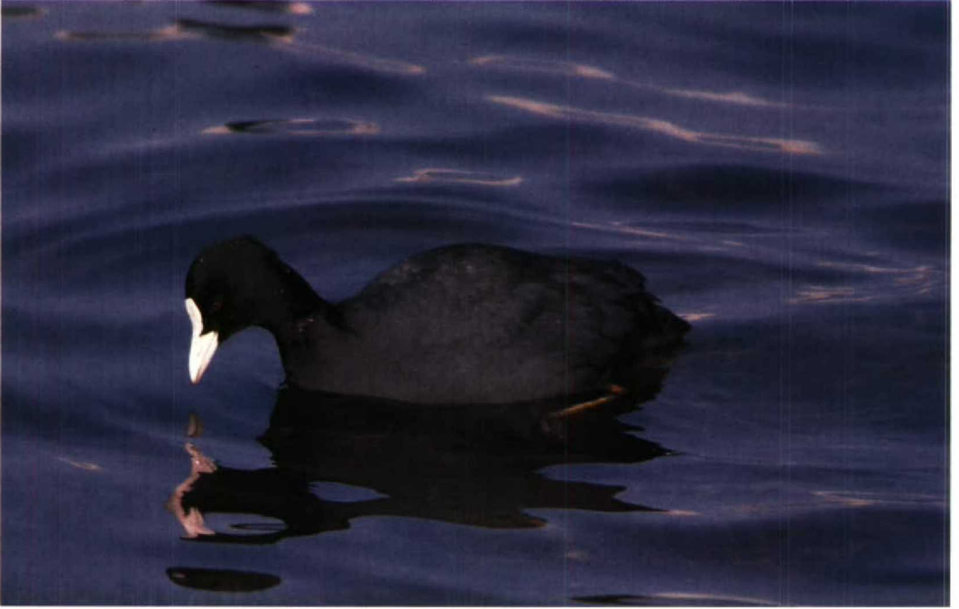
124 Coot Fulica atra , IJmuiden, Noordholland, Netherlands, 3 March 1986