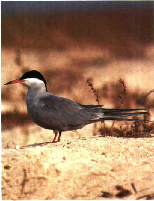
146 White-cheeked Tern Sterna repressa , Karan, Arabian Gulf, Saudi Arabia, June 1991