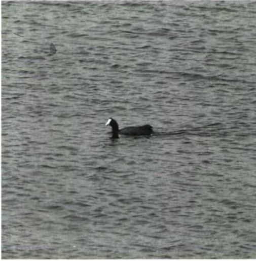
122 Crested Coot Fulica cristata , Spain, 11 May 1990. Note flat and rectangular body shape and high stern as well as typical triangular-shaped head (Tomi Muukkonen)