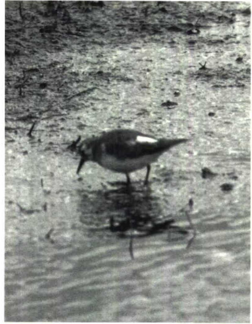
138 Gedeeltelijk albinistische Temmincks Strandloper Calidris temminckii , Oudega, Smallingerland, Friesland, 12 mei 1991 (Thijmen de Groot)

PARTIALLY ALBINISTIC TEMMINCK'S STINT NEAR OUDEGA IN MAY 1991 On 12 May 1991, a partially albinistic Temminck's Stint Calidris temminckii was observed and photographed near Oudega, Smallingerland, Friesland.