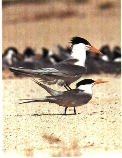
147 Lesser Crested Terns Sterna bengalensis , Karan, Arabian Gulf, Saudi Arabia, June 1991 (Arnoud B van den Berg)