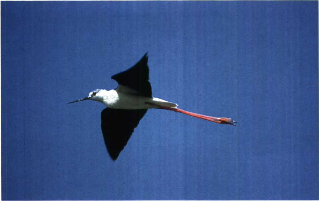
151 Steltkluut Himantopus himantopus , Bergen op Zoom, Noordbrabant, juni 1991 (Jaco Walhout)

op Rottumeroog werden nog late exemplaren gemeld op 3, 10 en 29 mei. Overigens heeft er dit jaar in Nederland een geslaagd broedgeval van deze soort plaatsgehad.