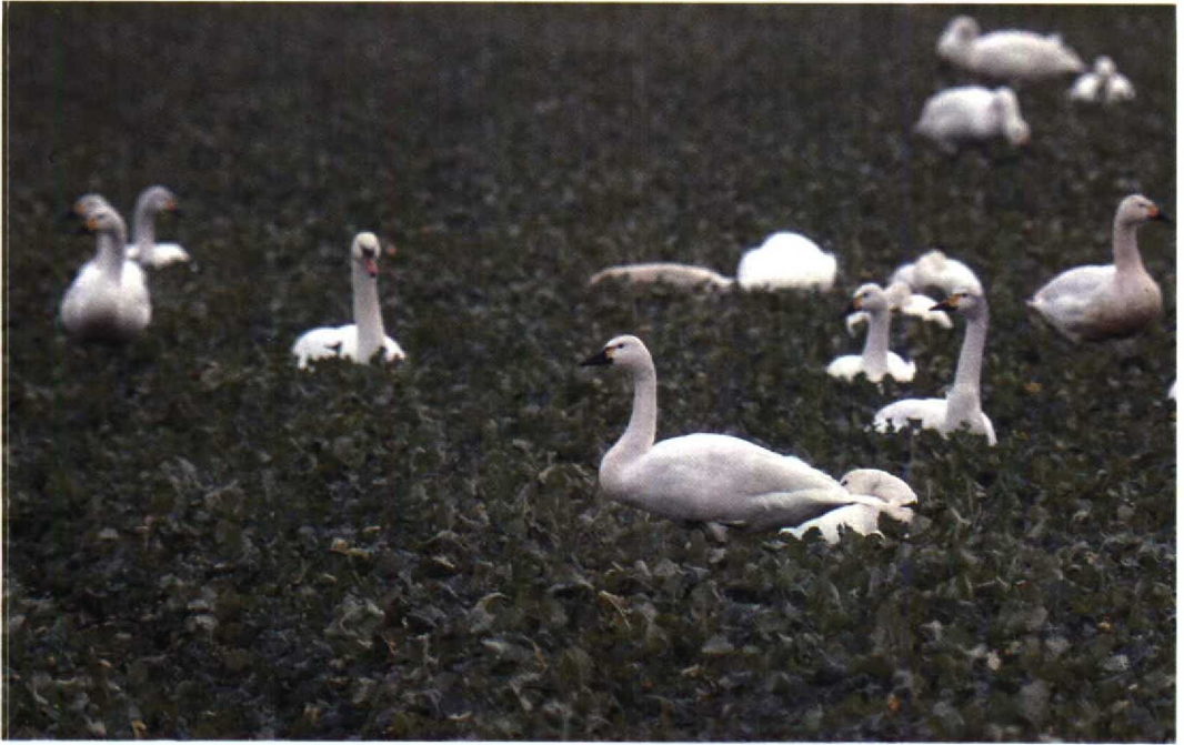
39 Kleine Zwaan Cygnus columbianus , met kenmerken van Fluitzwaan C. c. columbianus , Oostvaardersdijk, Flevoland, december 1990 40 Ross' Gans Anser rossii , Plaat van Scheelhoek, Zuidholland, december 1990