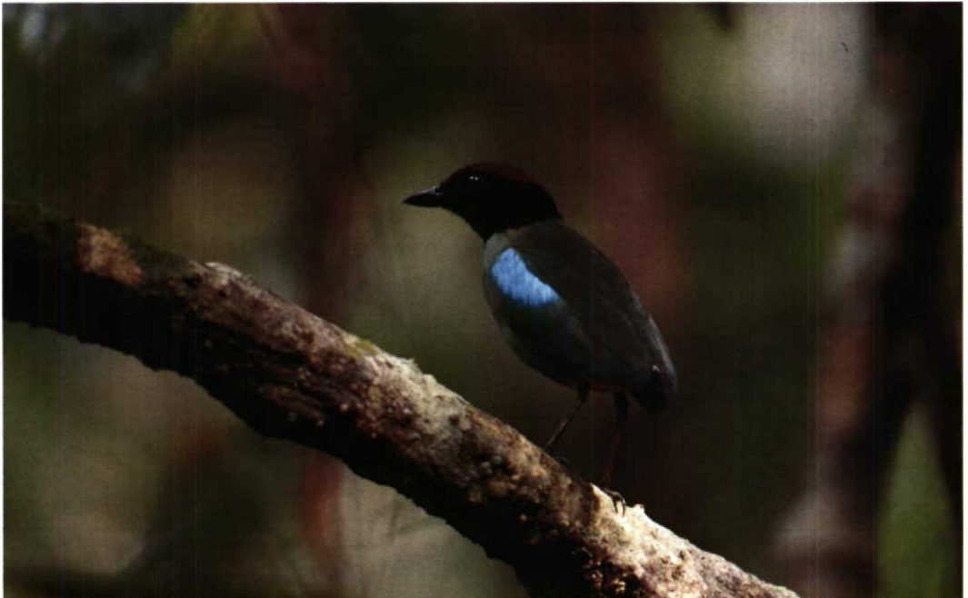
14 Hooded Pitta Pitta sordida cucullata, Ban Tieu, Khao Phra Bang Kham, Krabi province, Thailand, 5 May 1989