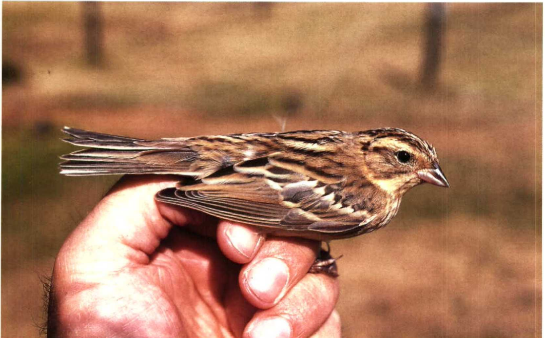
181 Wilgegors Emberiza aureola , Westenschouwen, Zeeland, 29 augustus 1991 (Arnoud B van den Berg, VRS Nebularia )

RALLEN TOT STERNS Een roepende Kwartelkoning Crex crex op 14 juli in de Wieringermeer Nh is het vermelden waard. Zomerse Kraanvogels Grus grus werden gezien bij Goedereede Zh op 22 juli en bij 't Harde Gld op 11 augustus. Broedende Steltkluten Himantopus himantopus waren er dit jaar in ieder geval bij Bergen op Zoom Nb. Op 5 augustus zat er één exemplaar bij Vlissingen en op 12 en 13 augustus twee ontsnapte exemplaren van de Amerikaanse ondersoort H h mexicanus bij Tiel Gld.