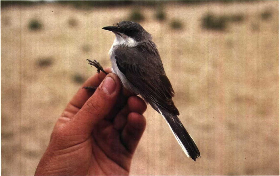
173 Orphean Warbler Sylvia hortensis crassirostris , female, Yumurtalik, Turkey, 11 April 1987

Mystery photograph 43. Solution in next issue