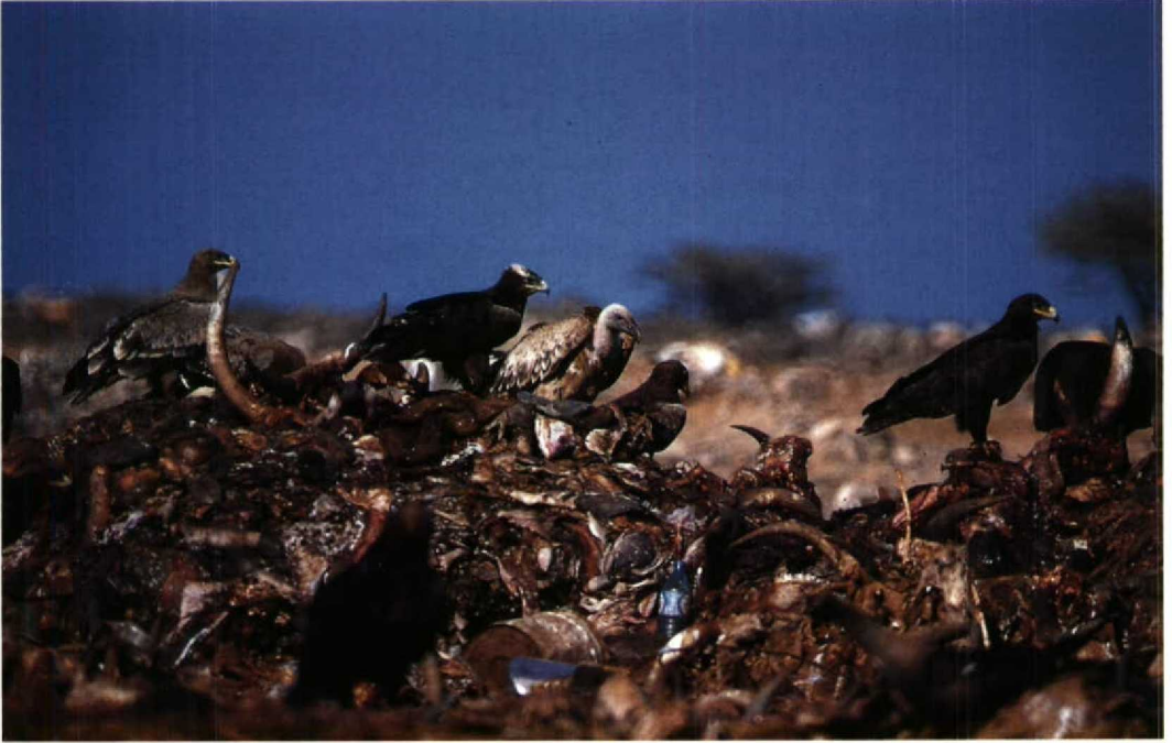
158 Steppe Eagles Aquila nipalensis and Rüppell's Vultures Gyps rueppellii , Djibouti rubbish dump, Djibouti, December 1985 (Geoff Welch & Hilary Welch)