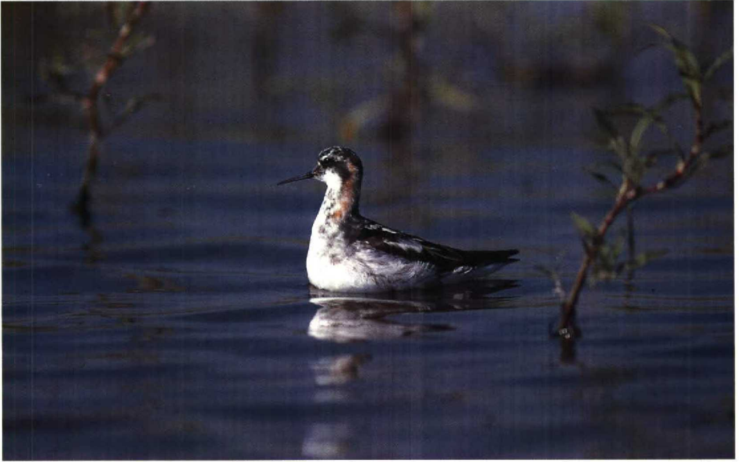
178 Grauwe Franjepoot Phalaropus lobatus , Almere, Flevoland, 28 juli 1991