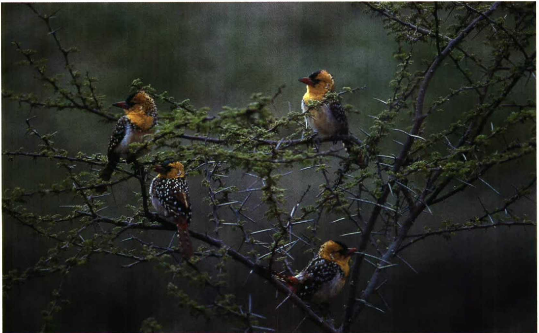
160 Yellow-breasted Barbet Trachyphonus margaritatus , Goda massif, Djibouti, February 1990 (Geoff Welch & Hilary Welch)

VOGELN IN DJIBOUTI Djibouti is gelegen in Oostafrika aan het zuidelijke, smalste gedeelte van de Rode Zee en vormt een verbinding tussen Afrika en het Arabische schiereiland. Een aantal goede vogelplaatsen langs de kust (roofvogels, steltlopers) en in het binnenland worden besproken. Naast allerlei Palearctische doortrekkers biedt Djibouti uiteraard een verscheidenheid aan Afrikaanse soorten. Ondanks de hoge verblijfskosten en het