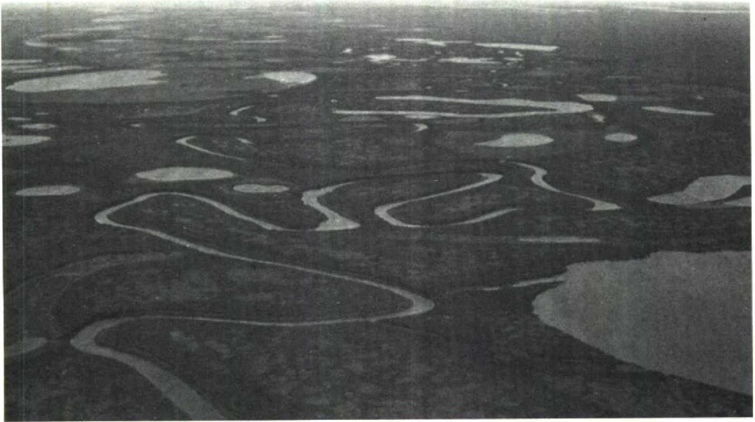
164 Aerial view of typical tundra landscape, Kolyma delta, Siberia, USSR, July 1990

lakes, both within and beyond the tree-line. Buturlin also learned of large numbers of breeding Ross's Gulls at Malaya on the upper Alazeya river and on the tundra to the west as far as the Indigirka river. From this he concluded that the main breeding grounds of Ross's Gull comprised the whole of the northern Kolyma plain.