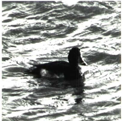
168 Ring-necked Duck x Tufted Duck hybrid A collaris x fuligula , first-year male, Goedereede, Zuidholland, 6 January 1991 (Staf Elsermans)

Whilst studying the bird, a number of possibilities were considered. It was probably not a first-summer male Ring-necked Duck because of the rounded head and the short forward extension of the flanks, caused by the broad black breast (Gillham 1986). First-summer male Tufted Duck can be excluded by the sharp white subterminal band on the bill. The bill pattern of Paget's Pochard- or Ferruginous Duck-type hybrid A ferina x nyroca (Gillham et al 1966) could possibly fit but neither the black upperparts nor the white brown-dashed flanks match this hybrid type. According to Gillham et al (1966), Baer's Pochard-type hybrid A fuligula x nyroca very much resembles a male Ring-necked Duck. The bill tip, however, shows less black and the flanks are clouded brown all-over. The bird also differed notably from the presumed hybrid between Ring-necked and Tufted Ducks A collaris x fuligula that was observed by Vinicombe (1982)