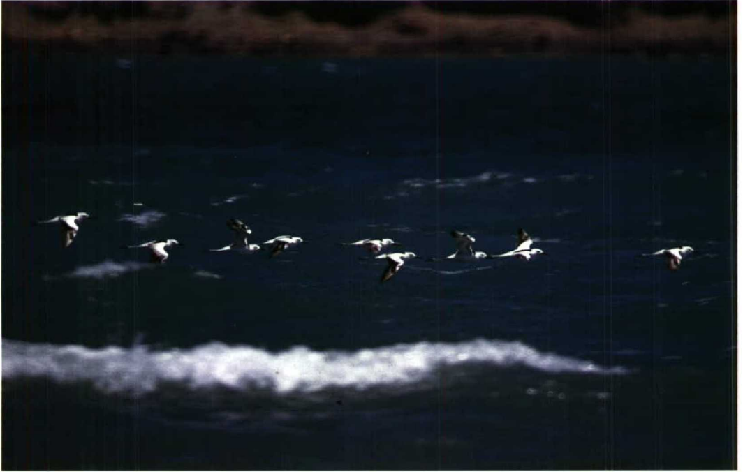
161 Crab Plovers Dromas ardeola , Doumeira, Djibouti, November 1987 (Geoff Welch & Hilary Welch)