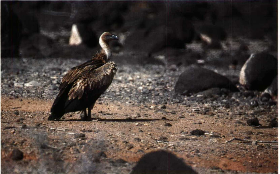
159 Rüppell's Vulture Gyps rueppellii , between Djibouti city and Arta, Djibouti, February 1989 (Geoff Welch & Hilary Welch)