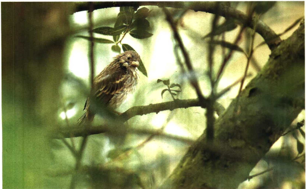
179 Roodmus Carpodacus erythrinus , juveniel, Knardijk, Flevoland, 20 juli 1991 (René van Rossum)