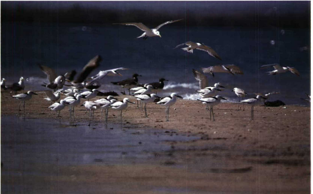
162 Crab Plover Dromas ardeola , Sooty Gull Larus hemprichii , Crested Tern Sterna bergii and Lesser Crested Tern S. bengalensis , Ras Siyan, Djibouti, October 1985