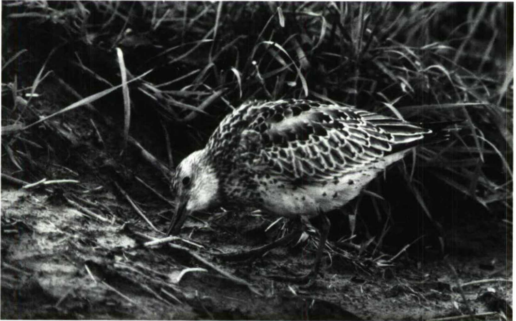
182 Grote Kanoet Calidris tenuirostris , Camperduin, Noordholland, 1 oktober 1991 (Arnoud B van den Berg)

Het lijkt zeker dat het hier dezelfde vogel betreft die van 17 tot 27 september 1991 op de Shetlands, Britannië, verbleef. Deze was op vrijdag 27 september om c 12:00 in zuidoostelijke richting weggevlogen en heeft waarschijnlijk ruim 24 uur doorgevlogen, tot grote blijdschap van vogelend Nederland. MAX BERLIJN