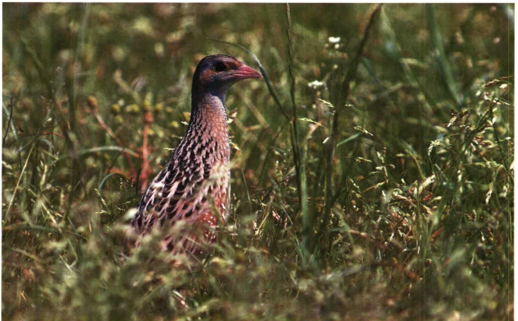
177 Kwartelkoning Crex crex , Wulpweg, Flevoland, 7 juli 1991 (Karel Mauer)