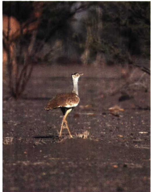
157 Arabian Bustard Ardeotis arabs , Dorra region, Djibouti, March 1990

The market gardens at Ambouli are accessible by bus or taxi but can be frustratingly difficult to work. The vegetation of the gardens provides ample cover for a wide range of residents and migrants and boasts several 'firsts' for Djibouti such as White-throated Robin Irania gutturalis , Paradise Whydah Vidua paradisaea , Collared Pratincole Glareola pratincola and Starling Sturnus vulgaris ! Ambouli's true importance for migrants will not be known until an extensive ringing study is carried out but its proximity to the centre of the city offers great scope