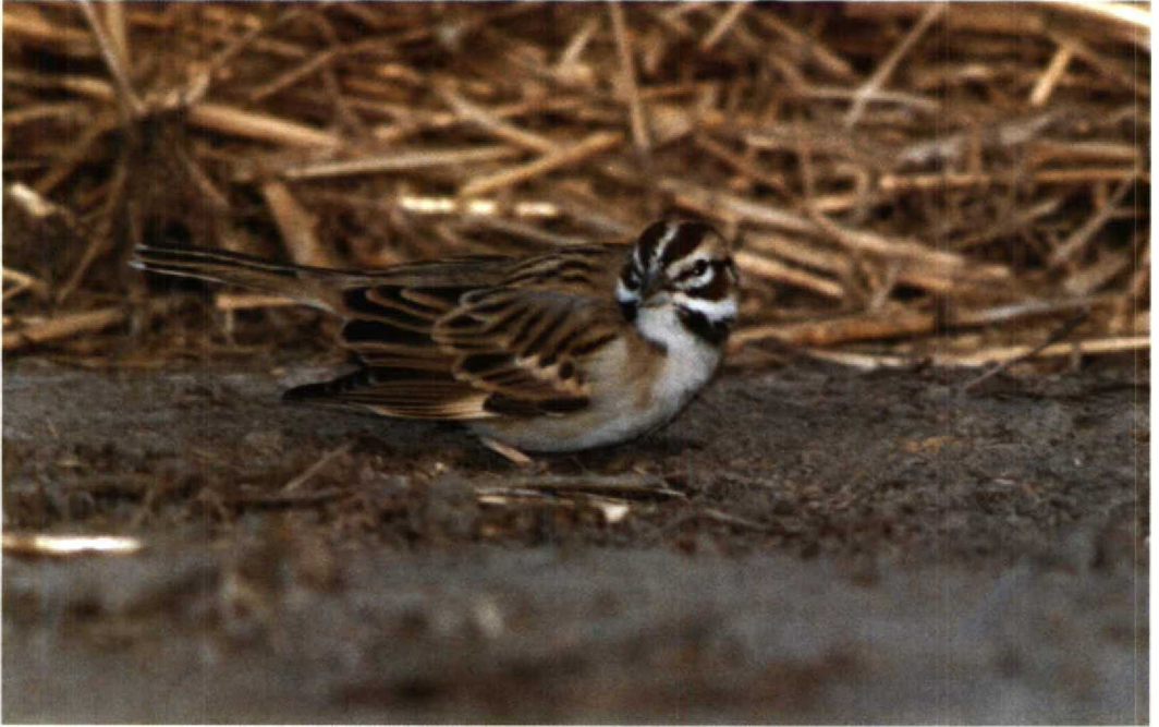
175 Lark Sparrow Chondestes grammacus , Waxham, Norfolk, Britain, May 1991