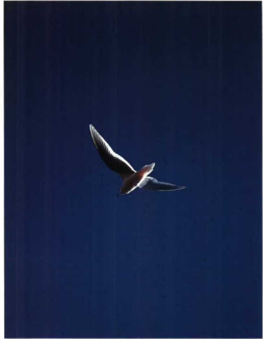
165 Ross's Gull Rhodostethia rosea , Kolyma plain, Siberia, USSR, July 1990 (Michael Densley)

Shortly after hatching, as soon as they are mobile, young Ross's Gulls leave the nest but remain in the vicinity and hide in the vegetation or feed on the nearest area of open water. At this stage, they are still attended by their parents. Newly hatched chicks