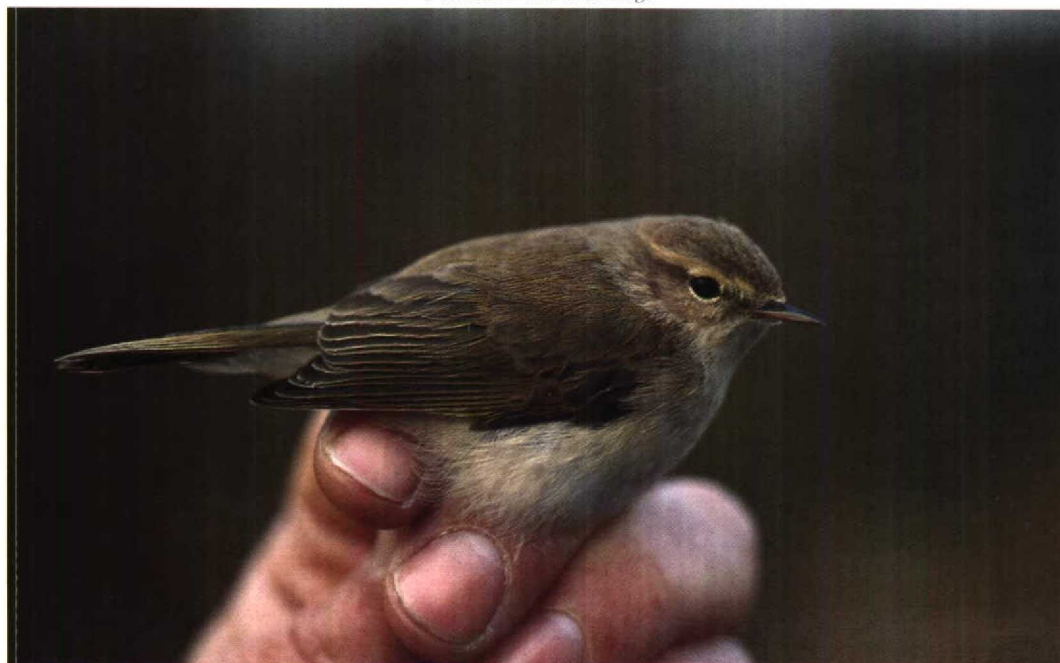
43 Scandinavische Tjiftjaf Phylloscopus collybita abietinus , De Bloq van Kuffeler, Flevoland, december 1990