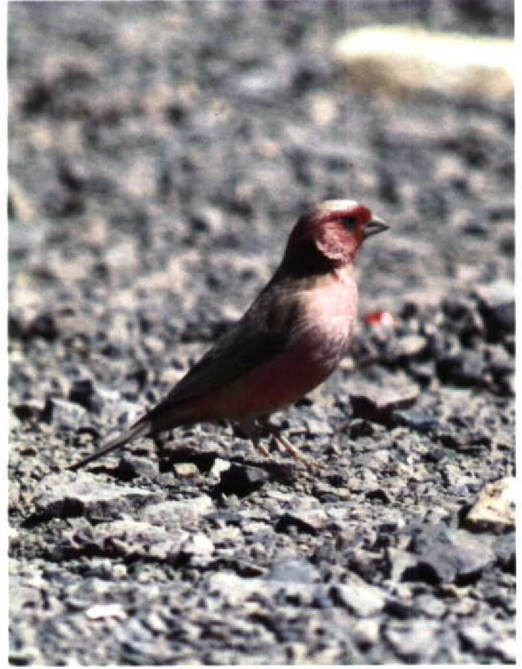
34 Sinai Rosefinch Carpodacus synoicus , Eilat, Israel, March 1990 (René Pop) 35 Sinai Rosefinch Carpodacus synoicus , Amrams Pillars, Israel, March 1990 (René van Rossum) 36 Cinereous Bunting Emberiza cineracea , Eilat, Israel, March 1990 (René van Rossum)