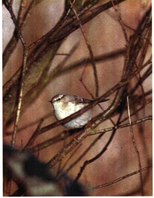
44 Humes Bladkoning Phylloscopus humei , De Cocksdorp, Texel, Noordholland, november 1990 (Arnaud B van den Berg) 45 Humes Bladkoning Phylloscopus humei , De Blocq van Kuffeler, Flevoland, december 1990 (Arnaud B van den Berg) 46 Siberische Boompieper Anthus hodgsoni , Noordwijk, Zuidholland, februari 1991 (René van Rossum)