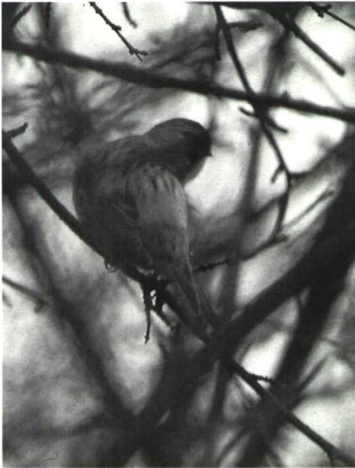
47 Witsluitbarmsijze Carduelis hornemanni (of Barmsijze C. flammea ?), Amsterdam-Buitenveldert, Noordholland, december 1990 (Lammert van der Veen)

ber tot in januari 1991), in Rijnsburg Zh (12 en 13 december) en bij De Blocq van Kuffeler Fl (van 24 december tot tenminste 22 januari 1991). De vogel van Wassenaar bleek in roep en verenkleed sterk overeen te komen met die van Texel maar de vogel bij De Blocq heeft de gemoederen sterk bezig gehouden door het verenkleed en de afwijkende roep. Dit laatste zorgde met name voor verwarring bij de ontdekking.