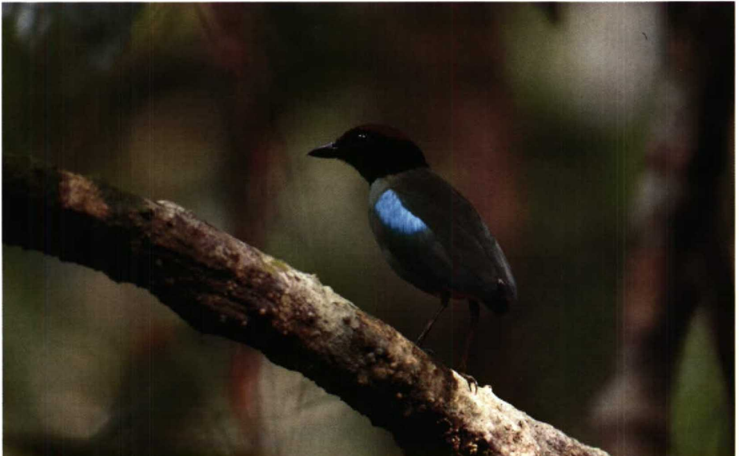
14 Hooded Pitta Pitta sordida cucullata, Ban Tieu, Khao Phra Bang Kham, Krabi province, Thailand, 5 May 1989