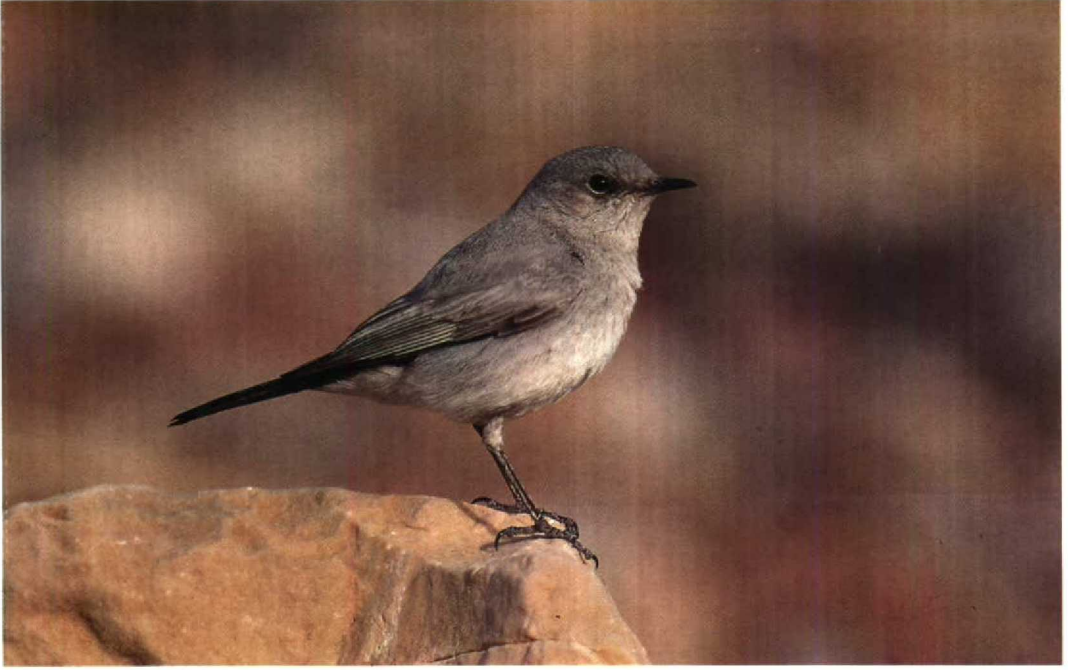
28 Blackstart Cercomela melanura , Eilat, Israel, March 1990 (René Pop) 29 Rüppell's Warbler Sylvia rueppelli , Eilat, Israel, March 1990 (René Pop)