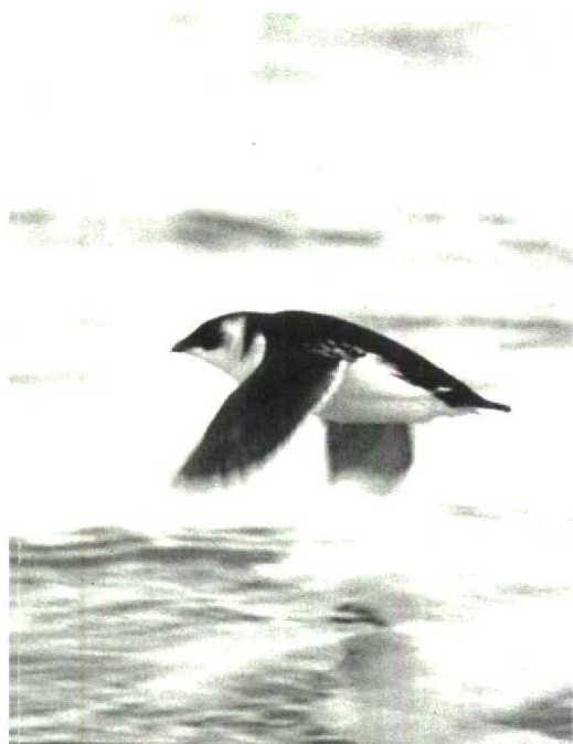
42 Kleine Alk Alle alle , Maasvlakte, Zuidholland, december 1990 (Arie Ouwerkerk)