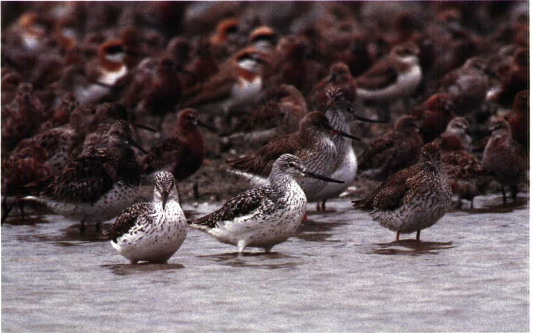
1 Nordmann's Greenshank Tringa guttifer , two (in foreground) very strongly marked adults in summer plumage with blackish centres to scapulars and tertials, Mai Po, Hong Kong, April 1990 (Ray Tipper) 2 Nordmann's Greenshank Tringa guttifer , strongly marked adult in summer plumage, Mai Po, Hong Kong, April 1990 (Ray Tipper)