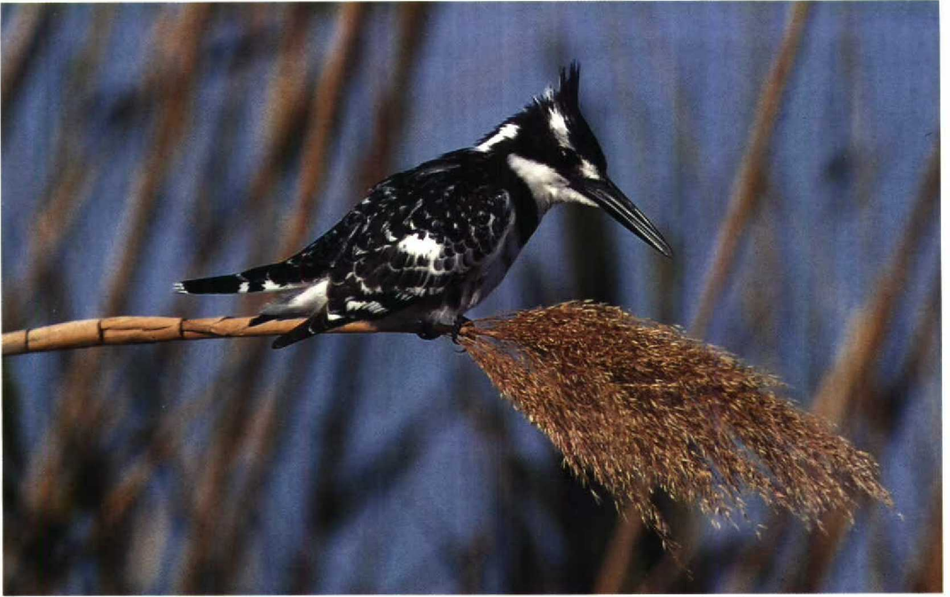
18 Pied Kingfisher Ceryle rudis , Ma'gan Mikhael, Israel, March 1990 19 Namaqua Dove Oena capensis , Eilat, Israel, March 1990