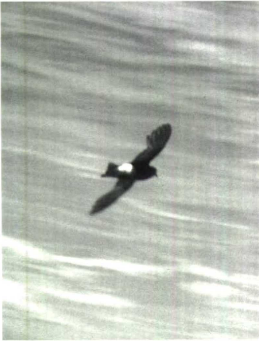
15 Wilson's Petrel Oceanites oceanicus , adult, Berlengas, Portugal, June 1984

post-breeding moult in May-August (when in the Northern Hemisphere) and often show old outer primaries projecting beyond growing new inner primaries (the complete post-juvenile moult of Wilson's Petrel takes place in tropical areas in October-May). In summer, juvenile Storm Petrels are in fresh plumage whereas adults moult in October-April. Thus, a Storm Petrel in active primary moult in June would be exceptional. Post-juvenile wing moult of Storm Petrel often already starts eight months after fledging, in June; however, the age of first breeding is 4 years, and it is to be expected that second calendar-year birds generally remain in African winter quarters.