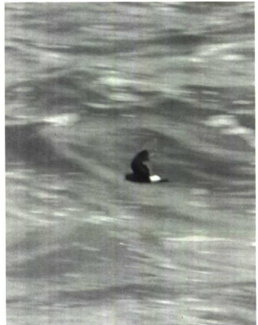
7 Wilson's Petrel Oceanites oceanicus , Spain, 30 July 1985 (Arnoud B van den Berg)

records of this species for France this century (Dubois & Comité d'Homologation National 1987). Our observations of no less than 18 Wilson's Petrels off the Egyptian Red Sea coast and in Suez Bay, Egypt, during 9-16 July 1985, including a flock of seven in the morning of 11 July 1985 (Ben Haase et al in Goodman & Meininger 1989, van den Berg et al 1991), suggest that July 1985 was an exceptional month for the northward movement of Wilson's Petrels. Normally, the species rarely reaches the northern shores of the Red Sea, and there were no previous records for Suez Bay and just one for Eilat, Israel (Shirihai 1987). Presumably, however, these birds originated from another population than the European birds, and it is more likely that the lack of French (and Western Palearctic) records is explained by the small number of observers participating in pelagic trips. This is also indicated by the increase of records since 1983 resulting from pelagic trips in August-September off Ireland and Cornwall, Great Britain (eg, Br Birds 81: 539-540, 1988; Harrison 1988).