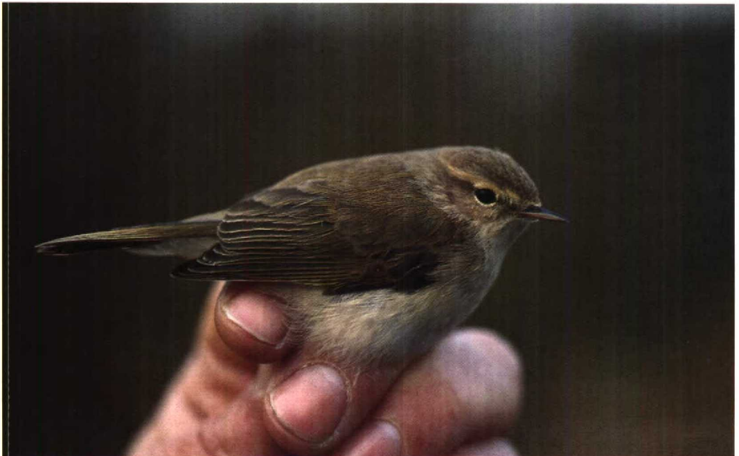
43 Scandinavische Tjiftjaf Phylloscopus collybita abietinus , De Blocq van Kuffeler, Flevoland, december 1990 (Arnoud B van den Berg)