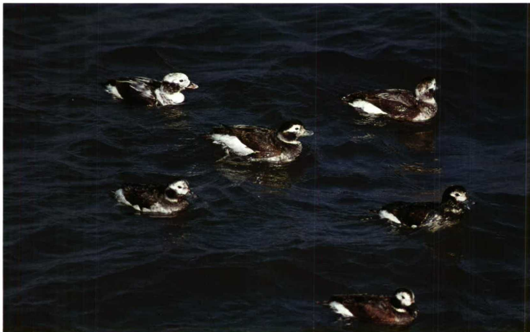
116 IJseenden Clangula hyemalis , IJmuiden, Noordholland, april 1991 (Piet Munsterman)

KRAANVOGELS TOT ZEEKOETEN Massale doortrek van Kraanvogels Grus grus vond plaats tussen 2 en 17 maart