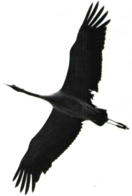
91 Demoiselle Crane Anthropoides virgo , Tselinograd, USSR, May 1989. Note proportions of wing, short tail and how far down black breast reaches ( Magnus Ullman ) 92 Crane Grus grus , sine loco, sine dato. Wing usually has more even width than in Demoiselle Crane (but variations occur). Regularly, wing narrows near body ( Jens B Bruun ) 93 Cranes Grus grus , Västervik, Sweden, May 1973. Note difficulty in assessing how far black of neck extends ( Axel von Arbin )