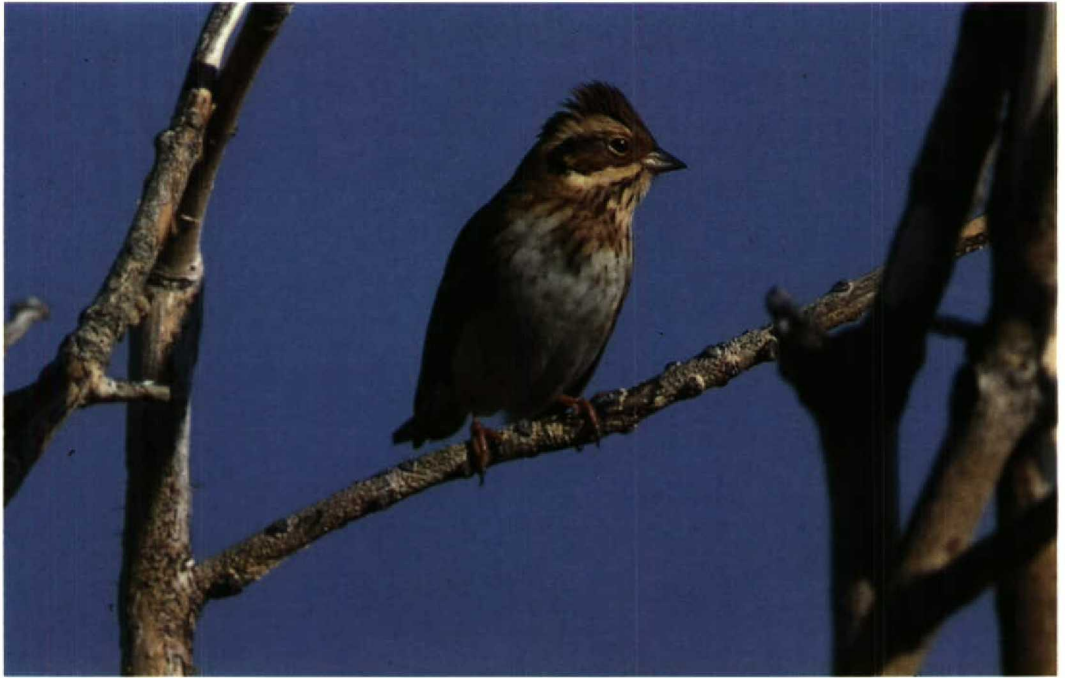
82 Rustic Bunting Emberiza rustica , Westkapelle, Zeeland, September 1990