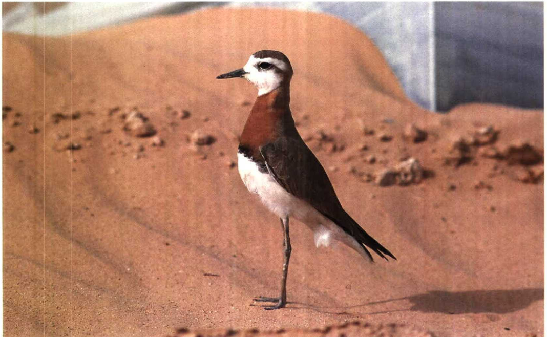
98 Caspian Plover Charadrius asiaticus , Yotvata, Israel, 19 March 1992 (Stefan Pfützke)