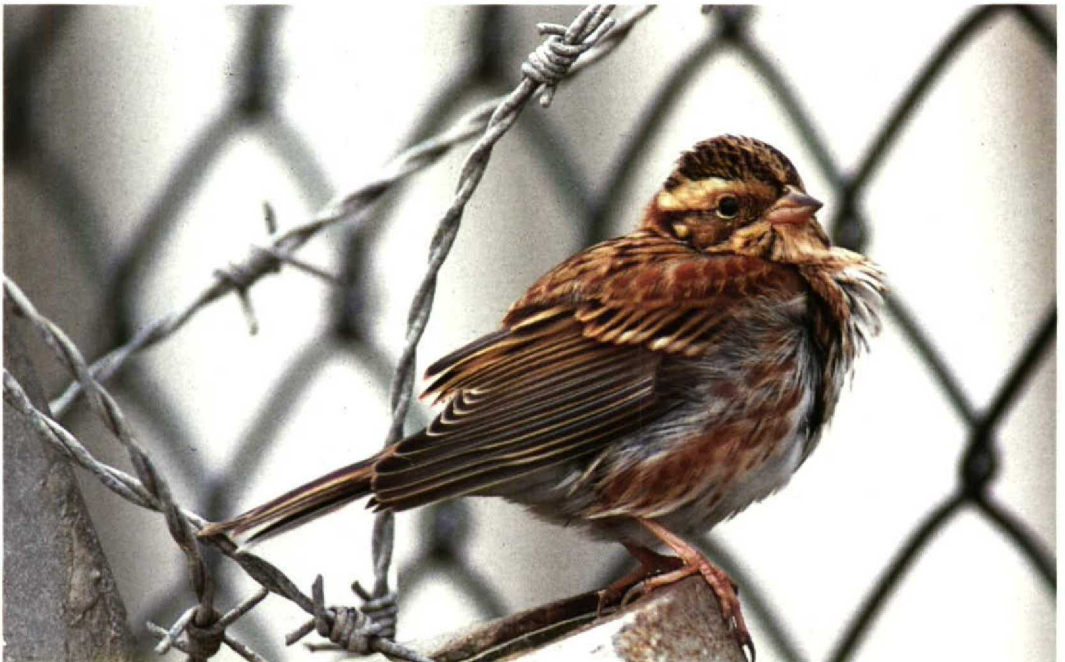
83 Rustic Bunting Emberiza rustica , Scheveningen, Zuidholland, 29 September 1990