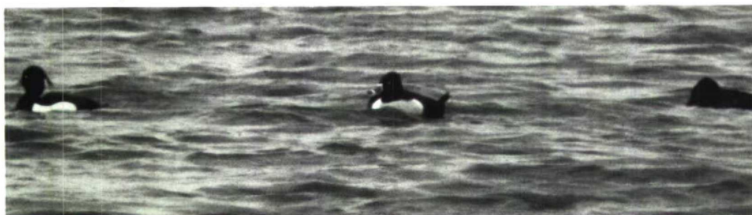
105 Ringsnaveleend Aythya collaris , Blokkersdijk, Antwerpen, België, april 1992 (Patrick Buys)

14 maart. Trekkende Ooievaarders vlogen op 6 maart over Essen-Heikant A, op 17 maart over Glabeek B en op 29 maart over Ronse Ovl (drie). Op 9 april waren er drie te Oostende en één te Zwijnaarde Ovl en op 10 april werd één exemplaar zowel te Oostende en te Bredene opgemerkt. Op 17 april vloog er één over Massenhoven A en op 19 april vlogen er drie over Zeebrugge. Op 22 en 23 april pleisterden er twee geringde Ooievaarders bij Gent Ovl. Op 26 april trokken er nog eens zeven over Korbeek-Lo B en één over Tessenderlo L en op 29 april trokken er nog eens vijf over Viersel A. Ook het wilde broedkoppel van Muizen A was weer aanwezig terwijl van het koppel bij Ravels A, net zoals vorig jaar, maar één vogel terugkeerde. Het mannetje Ringsnaveleend Aythya collaris liet zich nog de gehele periode – ook baltsend – bekijken op Blokkersdijk. Het overwinterende mannetje Witoogend A nyroca bleef nog bij Lier A aanwezig tot 8 april. De vogel van Beernem Wvl werd nog waargenomen tot 10 maart. In april dook zowel te Lier als te Blokkersdijk een hybride Kuifeend x Tafeleend A fuligula x ferina op. Een ver-binnenlands mannetje Ijseend Clangula hyemalis was van 7 maart tot ten minste 20 april aanwezig te Neerijse-Oud Heverlee B. Op de Gavers te Harelbeke Wvl zat tussen 1 en 26 maart weer