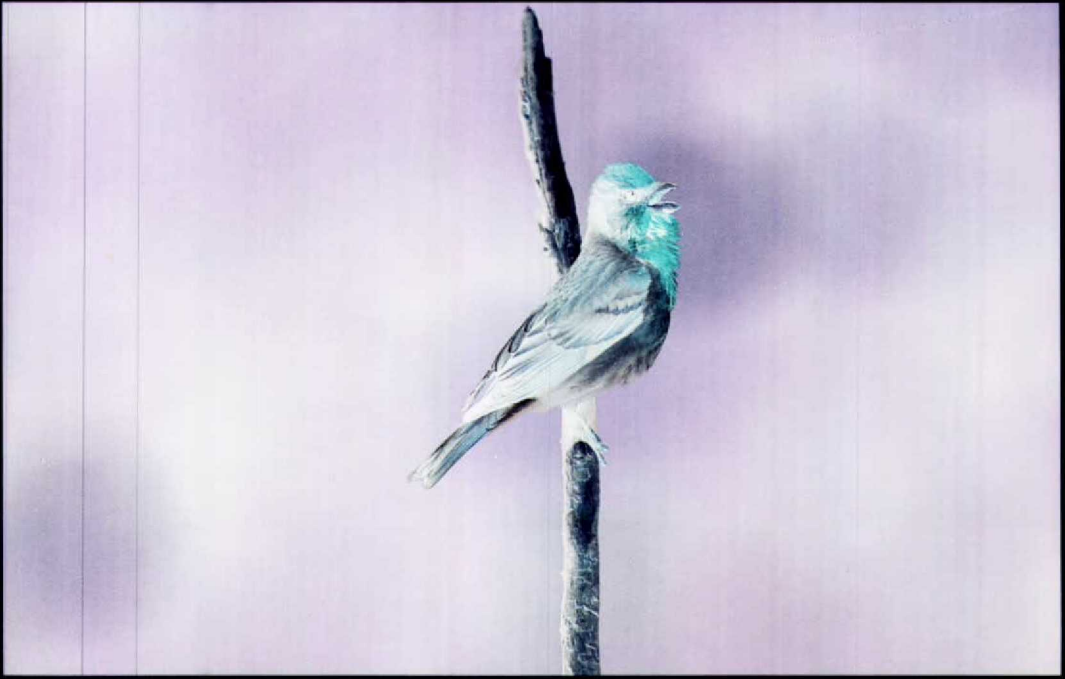
80 Scarlet Rosefinch Carpodacus erythrinus , adult male, Galjootweg, Almere, Flevoland, 22 May 1990 (Hans Gebuis)