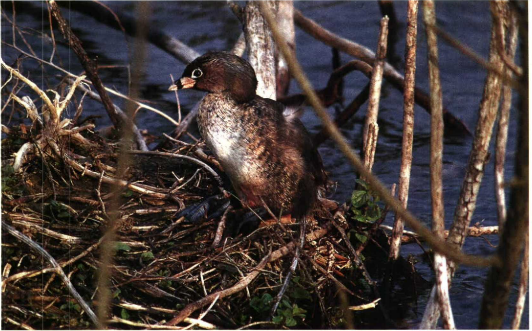
97 Pied-billed Grebe Podilymbus podiceps , Radley, Oxfordshire, England, April 1992