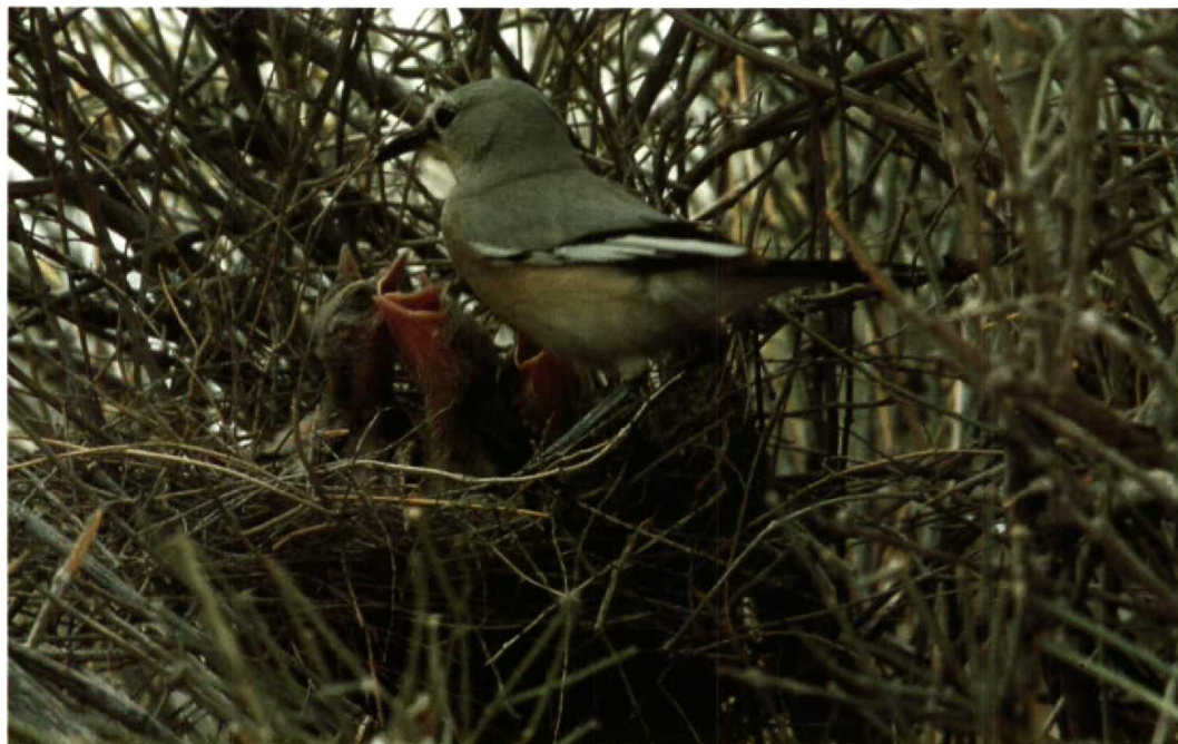
90 Pander's Ground Jay Podoces panderi , Repetek NR, Turkmenistan, June 1984 (Henrikas Sakalauskas)