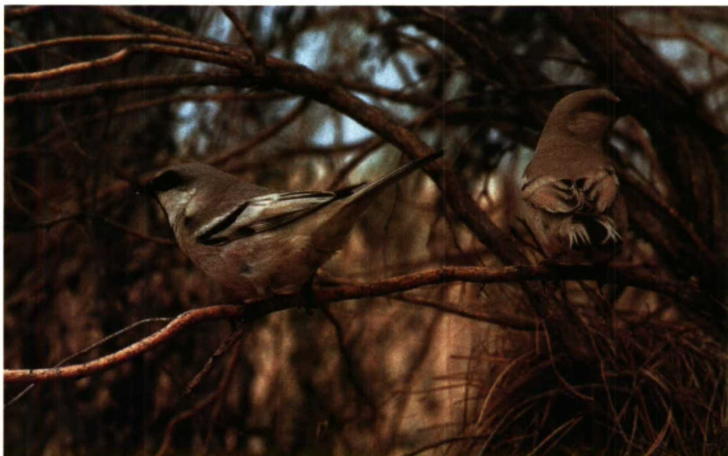
91 Desert Sparrow Passer simplex , Repetek NR, Turkmenistan, June 1984 (Henrikas Sakalauskas)