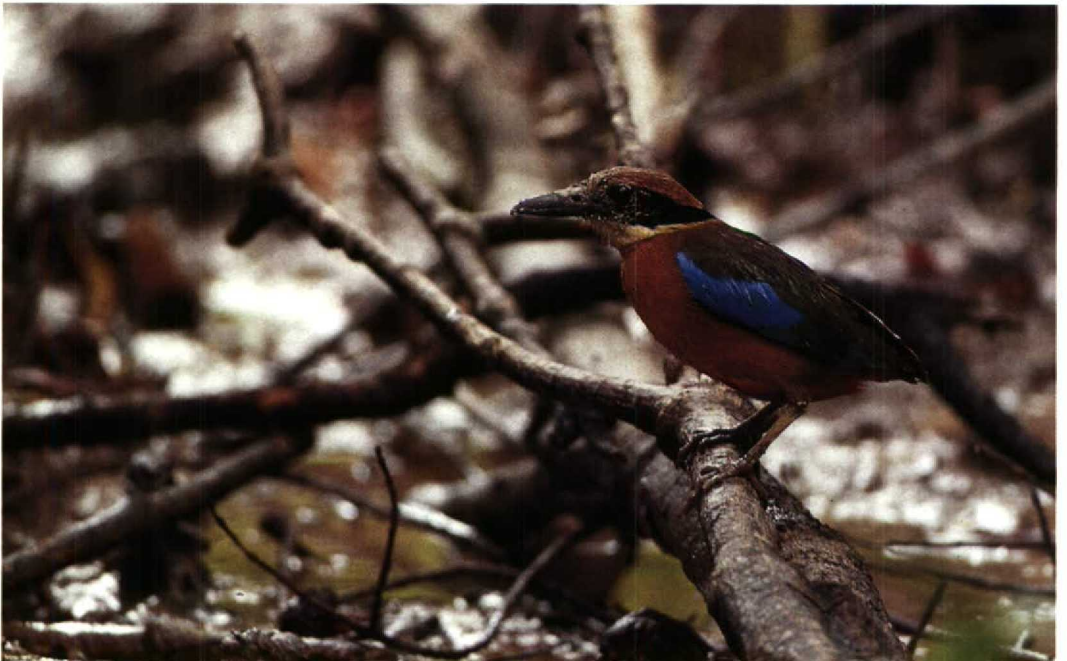
96 Mangrovepitta Pitta megarhyncha , Kuala Selangor, Maleisië, 13 april 1989