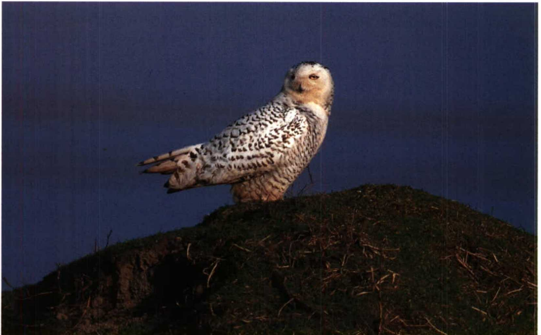
104 Sneeuuil Nyctea scandiaca , Maasvlakte, Zuidholland, maart 1992

UILEN TOT GORZEN De Sneeuuil Nyctea scandiaca die op 8 maart werd ontdekt op de Maasvlakte bleef daar aanwezig tot 3 april. Op 5 april werd er één gezien bij