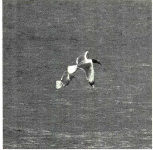
100 Great Black-headed Gull Larus ichthyaeetus , Sprees- tausee Spremberg, Brandenburg, Germany, March 1992 (Jochen Dierschke)

many, remained until 4 April (cf Dutch Birding 14: 64, 1992). In Finland, up to three single Azure Tits Parus cyanus were staying from 19 April onwards. In Germany, a Wallcreeper Tichodroma muraria was present for the fourth winter in succession, from 29 December 1991 onwards, alternately on the seminary and the basilica in Trier, Rheinland Pfalz (10 km from the Luxembourg border). A first-winter male Pine Grosbeak Pinicola enucleator present in gardens at Lerwick, Shetland, from 25 March to at least 25 April was the first British record since May 1975. On 2 February, eight Snow Buntings Plectrophenax nivalis were seen at the delta of the Kizilirmak, on the Black Sea coast east of Balik Gölü, constituting the first record for Turkey since at least 1966. A Cirl Bunting Emberiza cirlus shortly seen and photographed at the Breskens observation post on 16 May was the first record since 1901 for the Netherlands. Unseasonal Rustic Buntings E rustica were found at Logbiermé, Liège, Belgium, on 21 March, and at New Saltfleetby, Lincolnshire, England, on 22 March.