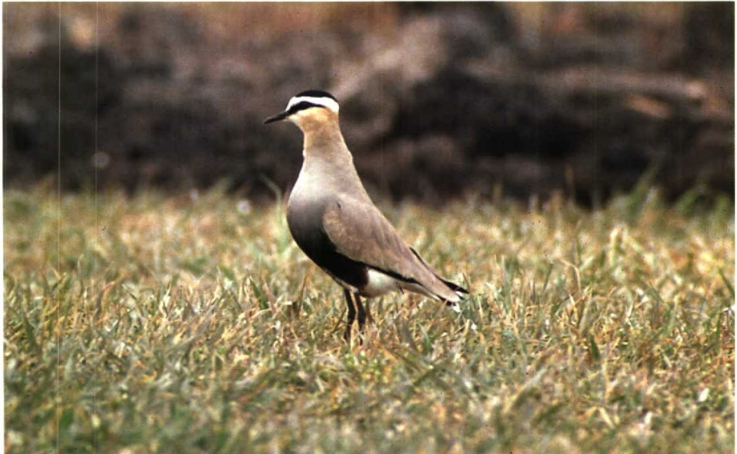
77 Sociable Plover Chettusia gregaria , adult summer, IJsselstein, Utrecht, April 1990 (Hans Gebuis)