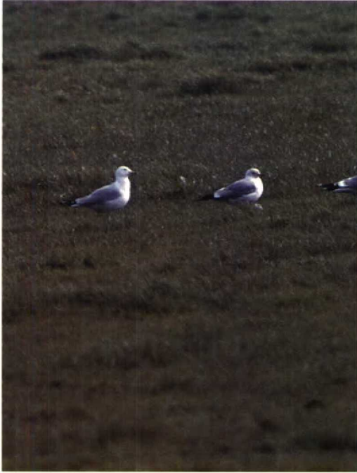
103 Ringsnavelmeeuw Larus delawarensis (links) en Kokmeeuw L. ridibundus , Begijnenmoeren, Antwerpen, België, april 1992

ters van 24 tot 27 april bij Rhenen, op 26 en 27 april bij Deventer O en twee op het Beuven. Op 18 april verbleef een Grauwe Franjepoot Phalaropus lobatus op de Molenplaat. Meer dan 100 Zwartkopmeeuwen Larus melanocephalus werden doorgegeven. Op exact dezelfde plaats waar in juni 1987 een Franklins Meeuw L. pipixcan verbleef ontdekten twee vogelaars, tijdens het zoeken naar Zwartkopmeeuwen, een adulte Ringsnavelmeeuw L. delawarensis . Ook deze Amerikaanse meeuw werd gezien ten zuiden van Achtmaal Nb, echter voornamelijk aan de Belgische kant van de grens. Het aantal gemelde Geelpootmeeuwen L. cachinnans bleef beperkt tot vijf, die, behalve een exemplaar bij Waspik Nb, alle aan de kust werden gezien. Er was een melding van een Kleine Burgemeester L. glaucoides op 1 en 2 maart bij Broekhuizenvorst L. Langs de kust werden Kleine Burgemeesters gezien op 5 en 7 maart bij Katwijk Zh, op 11 maart en 3 en 16 april bij Scheveningen Zh, op 27 maart bij IJmuiden en op 14 april bij Egmond Nh. Tot 16 maart zat de adulte Grote Burgemeester L. hyperboreus van de Brouwersdam op zijn stek. Op 6 en 8 maart verbleef een onvolwassen exemplaar bij Middelbert Gr. Witwangsterns Chlidonias hybridus werden gezien op 26 april op Wieringen Nh en op 30 april bij Breskens. Op 24 april vloog minimaal één Witvleugelstern C. leucopterus tussen Zwarte Sterns C. niger langs de Oostvaardersdijk.