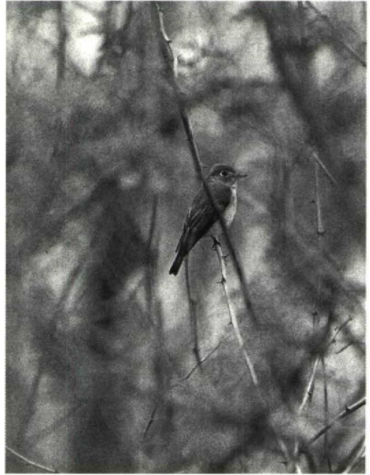
Mystery photograph 47. Solution in next issue

The bird is then either Green Sandpiper T ochropus or the Nearctic Solitary Sandpiper T solitaria . The photograph shows well the clinching field-mark of the colour of the rump which is black in our bird, as in Solitary Sandpiper, and white on Green Sandpiper. In addition, the central rectrices of Solitary Sandpiper are uniformly black whereas they are banded in Green Sandpiper. There are other, less obvious characteristics. The bill of Green Sandpiper is quite heavy and does not seem to droop, the legs tend to look relatively shorter and, in general, Green Sandpiper is a stockier bird than Solitary Sandpiper. Green Sandpiper also usually has an eye-ring less prominent than shown by this bird and I have yet to see one with the 'spectacled' look usually present on Solitary Sandpiper. This may be because the supercilium of Green Sandpiper tends