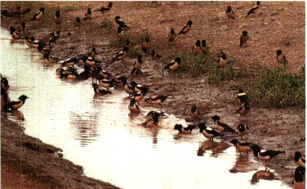
89 Rose-coloured Starlings Sturnus roseus , Chimkent region, Kazakhstan, June 1988 ( Algirdas J Knystautas )