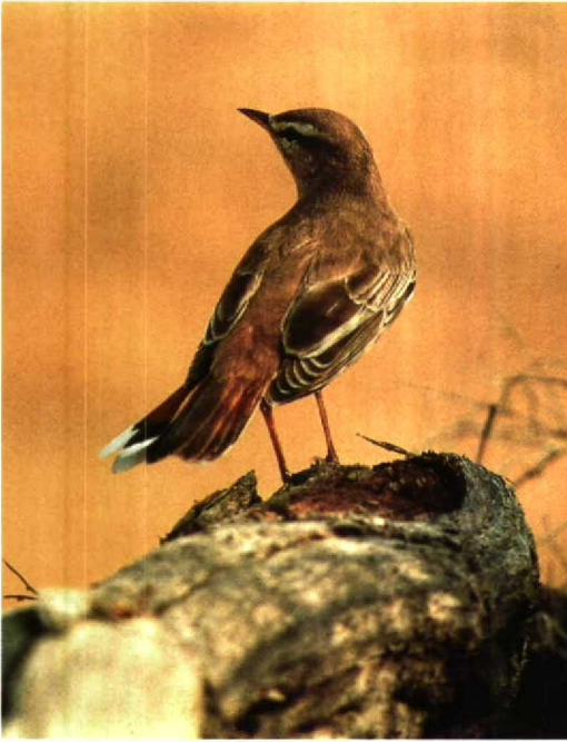
87 Rufous Bush Robin Cercotrichas galactotes , Repetek NR, Turkmenistan, June 1984 ( Henrikas Sakalauskas )