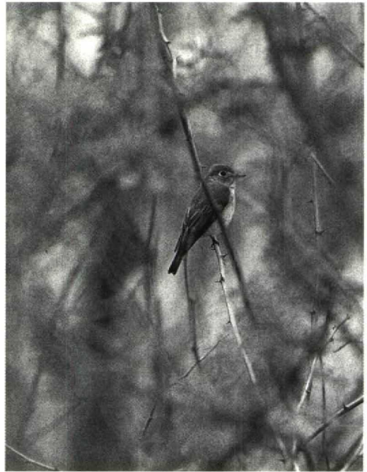
Mystery photograph 47. Solution in next issue

The bird is then either Green Sandpiper T ochropus or the Nearctic Solitary Sandpiper T solitaria . The photograph shows well the clinching field-mark of the colour of the rump which is black in our bird, as in Solitary Sandpiper, and white on Green Sandpiper. In addition, the central rectrices of Solitary Sandpiper are uniformly black whereas they are banded in Green Sandpiper. There are other, less obvious characteristics. The bill of Green Sandpiper is quite heavy and does not seem to droop, the legs tend to look relatively shorter and, in general, Green Sandpiper is a stockier bird than Solitary Sandpiper. Green Sandpiper also usually has an eye-ring less prominent than shown by this bird and I have yet to see one with the 'spectacled' look usually present on Solitary Sandpiper. This may be because the supercilium of Green Sandpiper tends