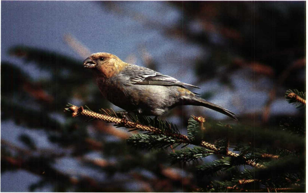
99 Pine Grosbeak Pinicola enucleator , Lerwick, Shetland, Scotland, March 1992