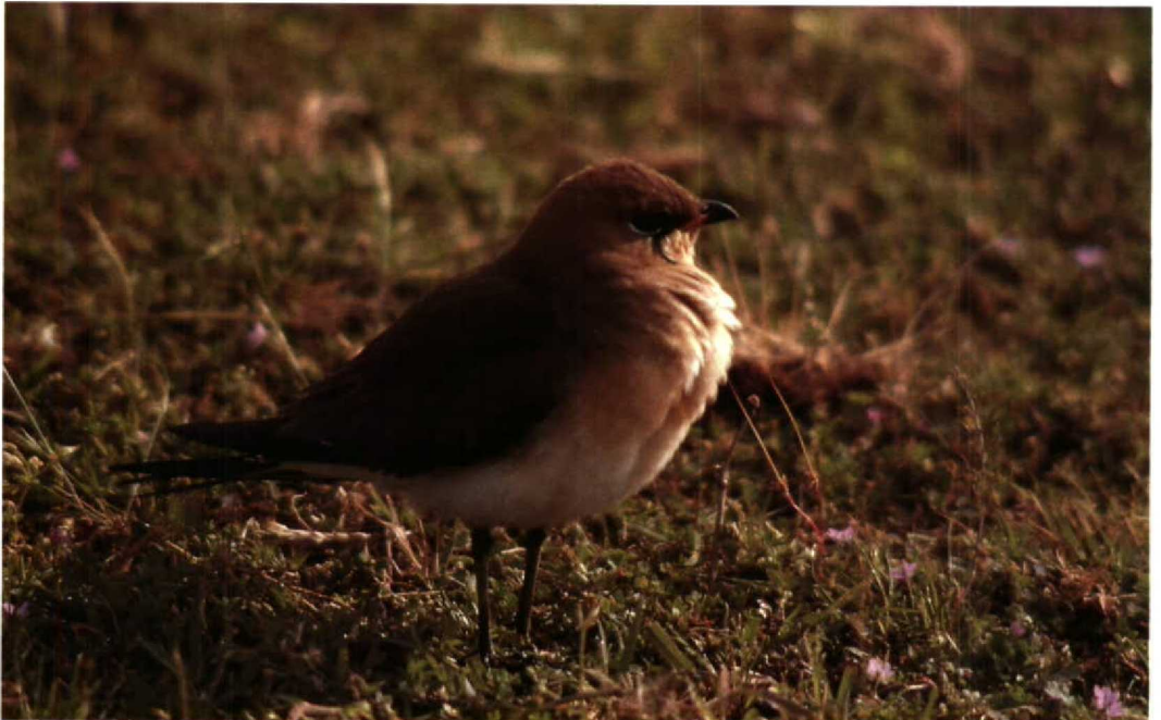
86 Black-winged Pratincole Glareola nordmanni , Lenkoran region, Azerbaydzhan, May 1988 (Henrikas Sakalauskas)