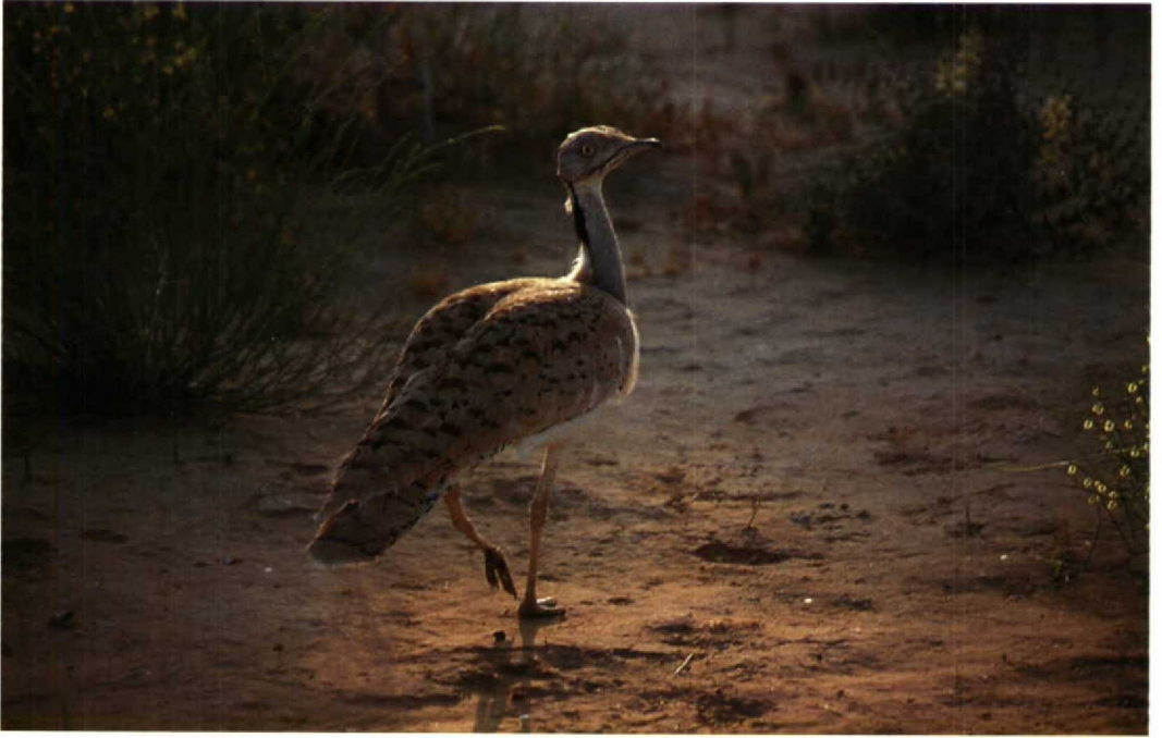
85 Houbara Bustard Chlamydotis undulata , southern Uzbekistan, May 1988