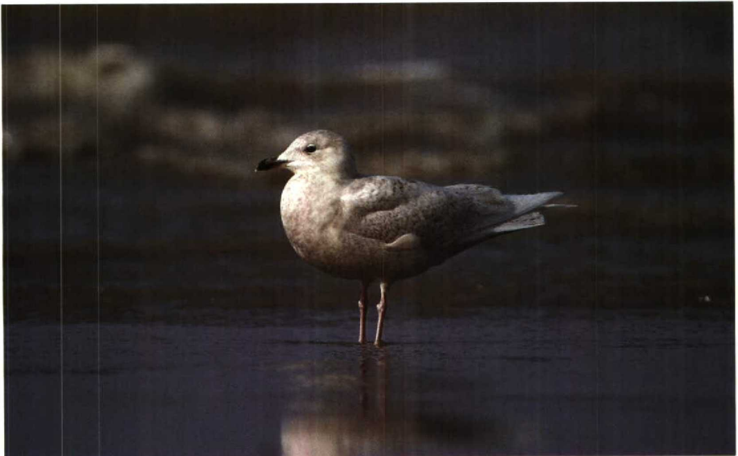
102 Kleine Burgemeester Larus glaucooides , Katwijk aan Zee, Zuidholland, maart 1992 (René van Rossum)