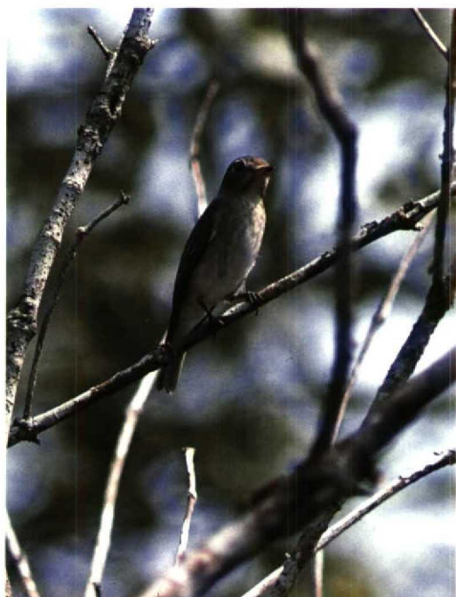
128 Brown Flycatcher Muscicapa dauurica , Kuala Selangor, Malaysia, 3 November 1991 (Arnoud B van den Berg)