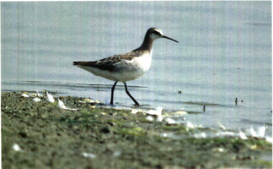
141 Grote Franjepoot Phalaropus tricolor , Zeebrugge, Westvlaanderen, mei 1992 (Patrick Beirens)