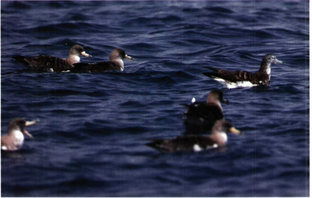
131 Streaked Shearwater Calonectris leucomelas with Cory's Shearwaters C. diomedea , off Eilat, Israel, June 1992 (Hadoram Shirihai)