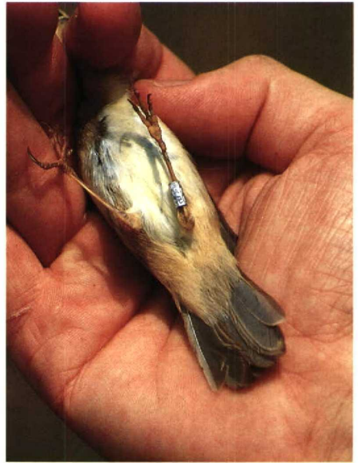
121 Dusky Warbler Phylloscopus fuscatus , showing grey upperparts, Mai Po, Hong Kong, February 1990 (Paul J Leader) 122 Dusky Warbler Phylloscopus fuscatus , showing pale buff undertail-coverts, Mai Po, Hong Kong, September 1991 (Paul J Leader) 123 Radde's Warbler Phylloscopus schwarzi , showing rich-buff undertail-coverts, Kadoorie Agricultural Research Centre, Hong Kong, November 1991 (Paul J Leader) 124 Dusky Warbler Phylloscopus fuscatus , showing rich-buff undertail-coverts contrasting with remainder of underparts, Mai Po, Hong Kong, January 1991 (Paul J Leader)