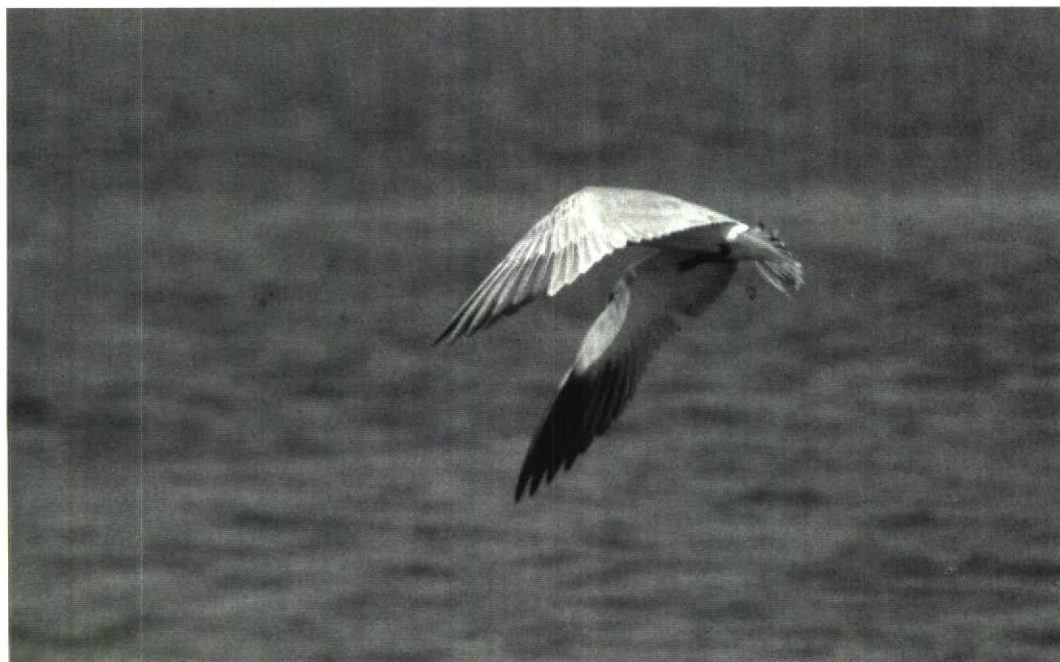
Mystery photograph 48. Solution in next issue

Colin Bradshaw, 9 Tynemouth Place, North Shields, Tyne and Wear NE30 4BJ, UK