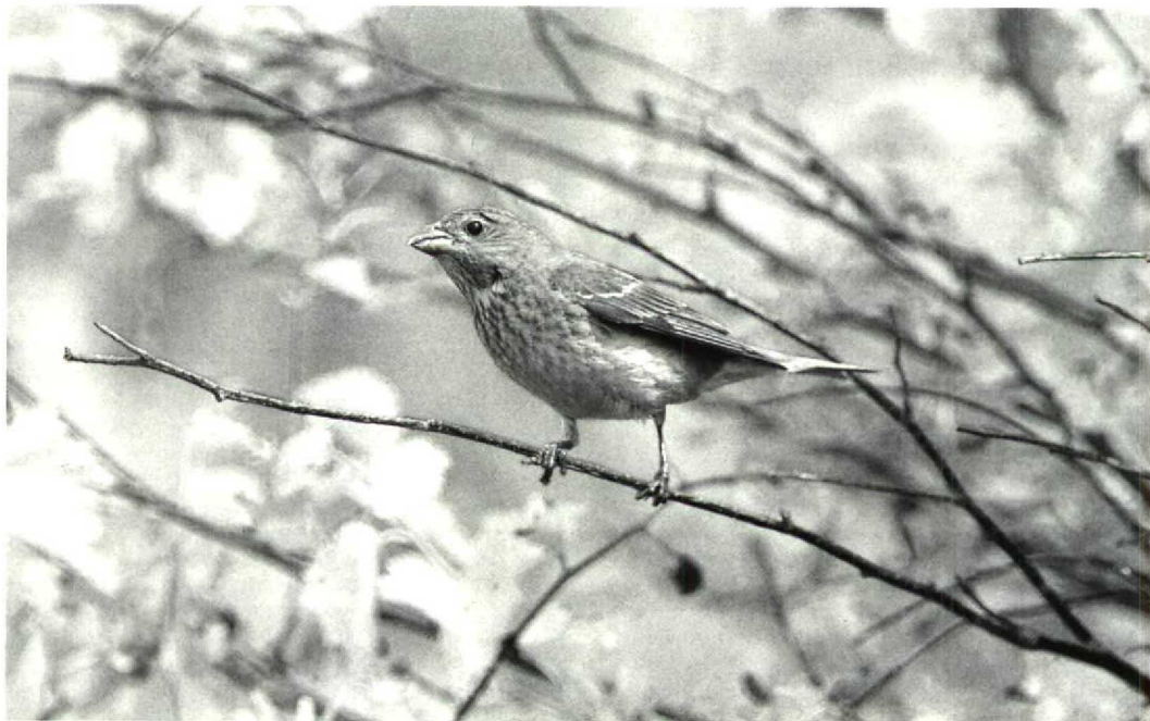
135 Roodmus Carpodacus erythrinus , vrouwtje, Schiermonnikoog, Friesland, juni 1992 (Leo J R Boon)