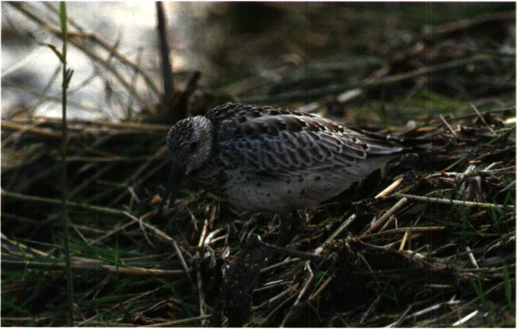
112 Grote Kanoet Calidris tenuirostris , De Putten bij Camperduin, Noordholland, oktober 1991