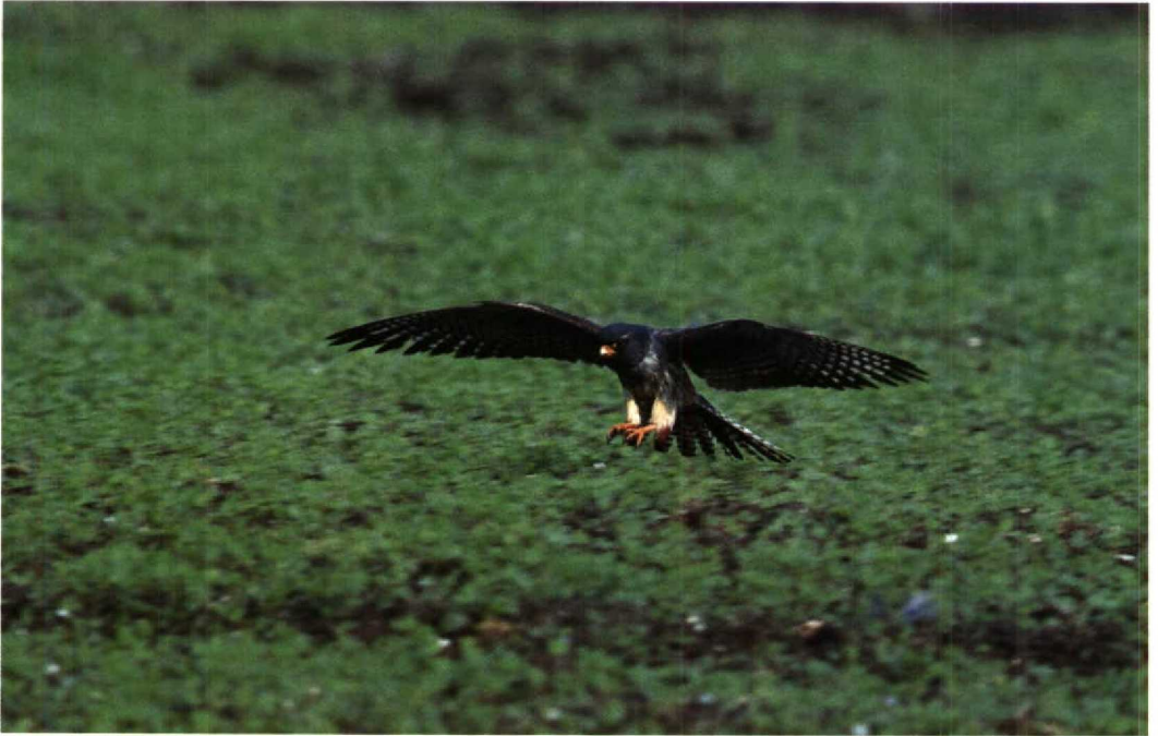
136 Roodpootvalk Falco vespertinus , Tureluurweg, Flevoland, juni 1992 (Karel Mauer)