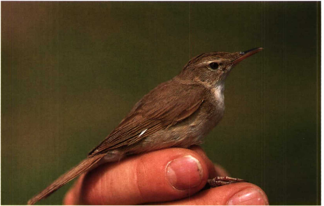
107-108 Struikrietzanger Acrocephalus dumetorum , Lelystad, Flevoland, 26 juni 1990 (C J Breek)