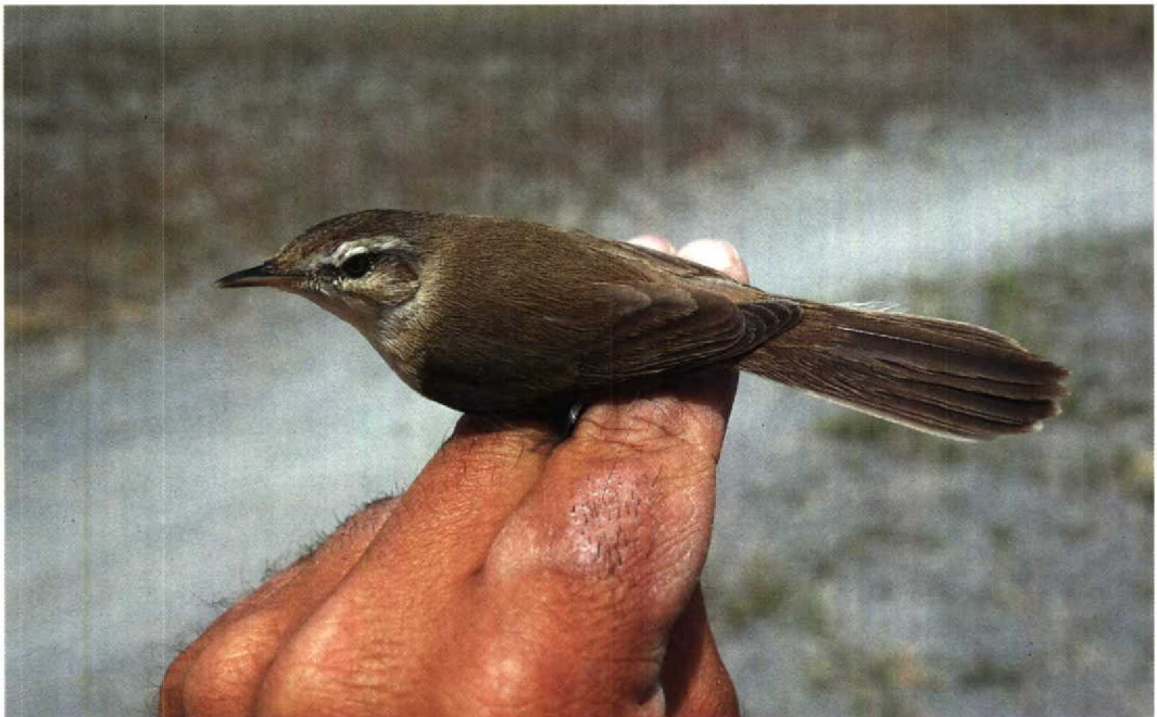
110 Veldrietzanger Acrocephalus agricola , Van, Turkije, 8 mei 1987