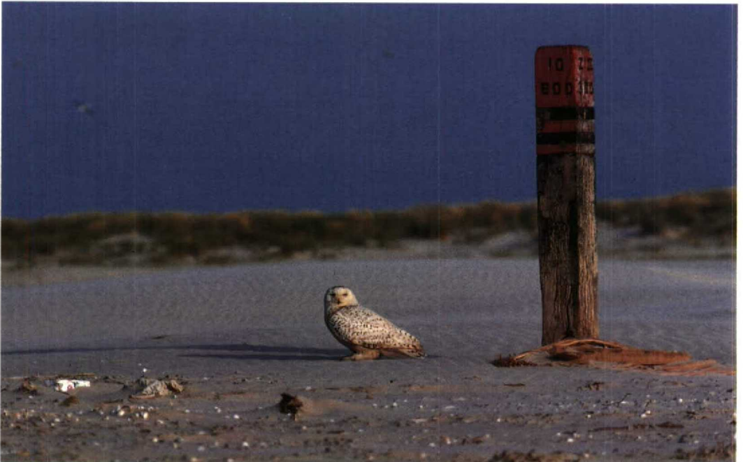
137 Sneeuwuil Nyctea scandiaca , Schiermonnikoog, Friesland, 28 juni 1992 (Theo Bakker)