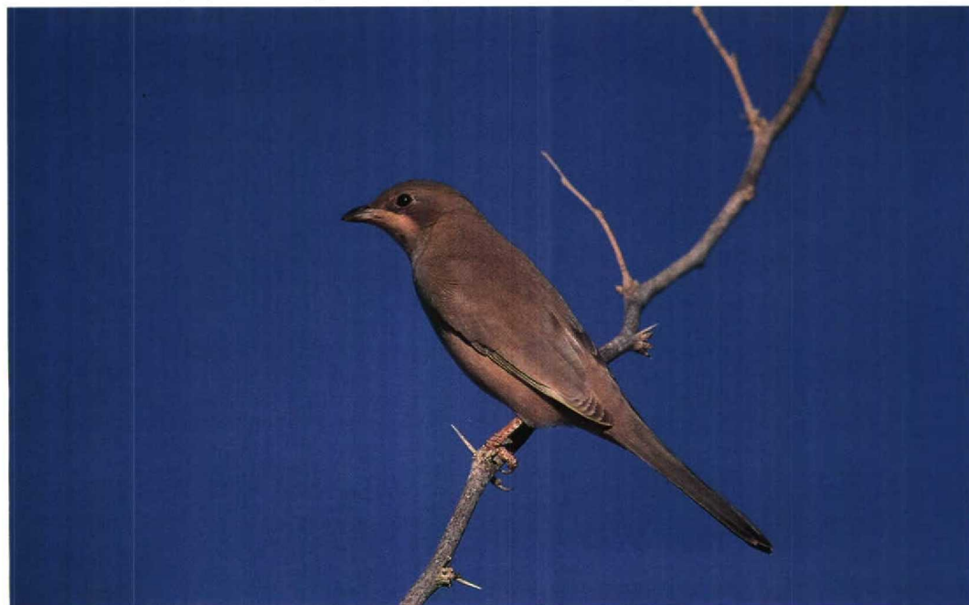
130 Grey Hypocolius Hypocolius ampelinus , female, Bahrain, November 1989