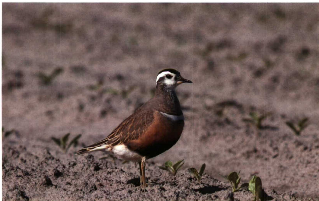
139 Morinelplevier Charadrius morinellus , Zoutkamp, Groningen, 16 mei 1992