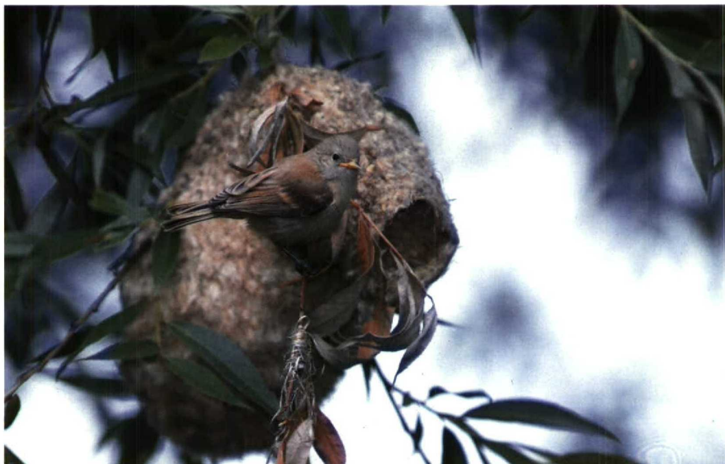
138 Buidelmees Remiz pendulinus , juveniel, Amsterdam, Noordholland, 23 juni 1992