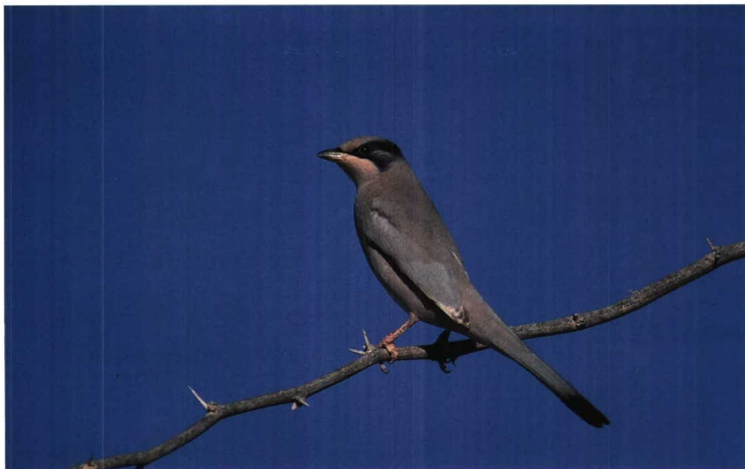
129 Grey Hypocolius Hypocolius ampelinus , male, Bahrain, November 1989 (Mike Hill)