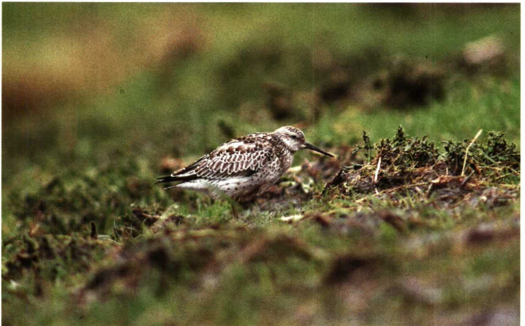
113 Grote Kanoet Calidris tenuirostris , De Putten bij Camperduin, Noordholland, oktober 1991 (René van Rossum)