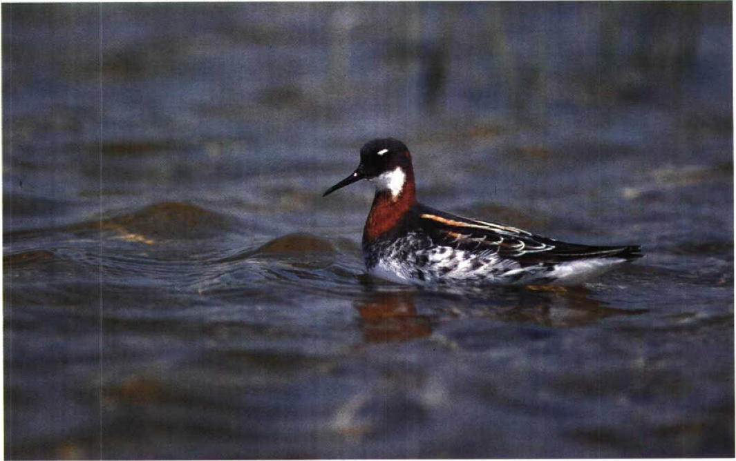
140 Grauwe Franjepoot Phalaropus lobatus , Weversinlaag, Zeeland, mei 1992