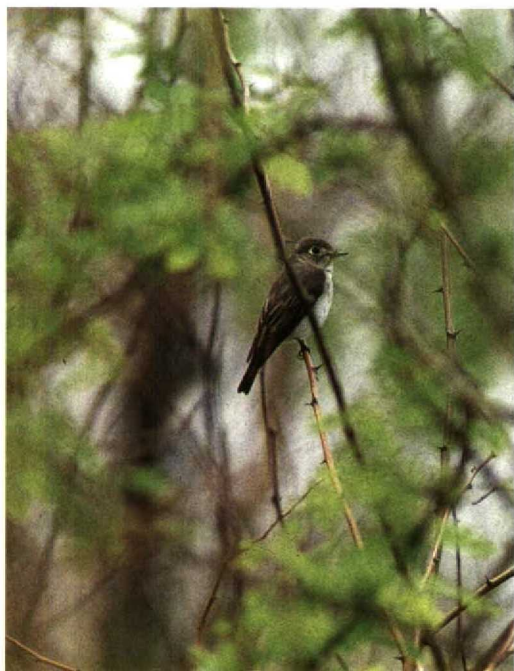
127 Brown Flycatcher Muscicapa dauurica , Beidaihe, China, May 1990