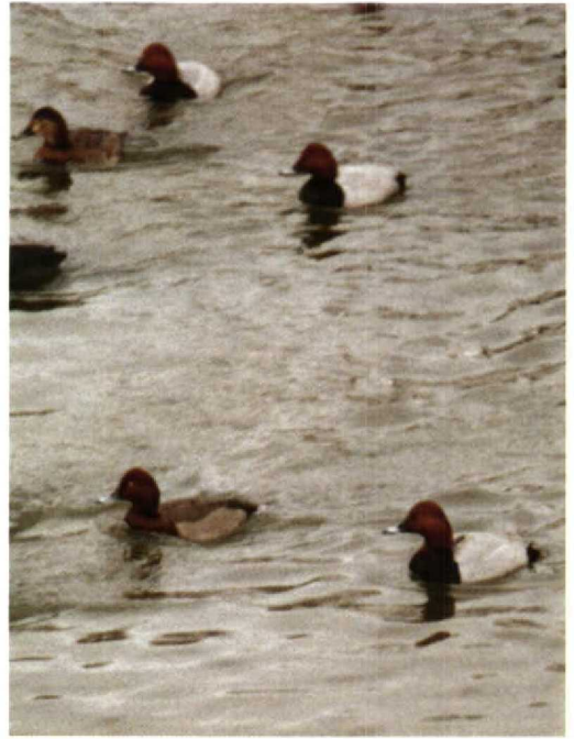
118-119 Hybride Tafeleend x Witoogeend Aythya ferina x nyroca , mannetje, Utrecht, Utrecht, 15 februari 1991 (Enno B Ebels)