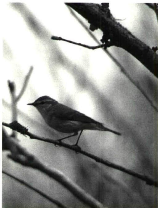
134 Grauwe Fitis Phylloscopus trochiloides , Rottumeroog, Groningen, 2 juni 1992