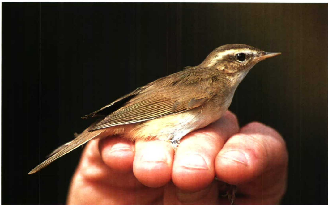
126 Dusky Warbler Phylloscopus fuscatus , showing very long, broad, well-marked supercilium, Mai Po, Hong Kong, February 1990