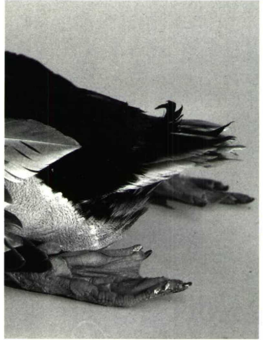
114 Wilde Eend Anas platyrhynchos , vrouwtje, op 4-jarige leeftijd ( Dini Marks-Maarschalkerwaard ) 115 Krul in staart als typerend mannelijk kenmerk van zelfde vrouwtje Wilde Eend Anas platyrhynchos als in plaat 114, op 14-jarige leeftijd ( Frans van Bommel ) 116 Typerende mannelijke kop- en halstekening van zelfde vrouwtje Wilde Eend Anas platyrhynchos als in plaat 114, op 14-jarige leeftijd ( Frans van Bommel )