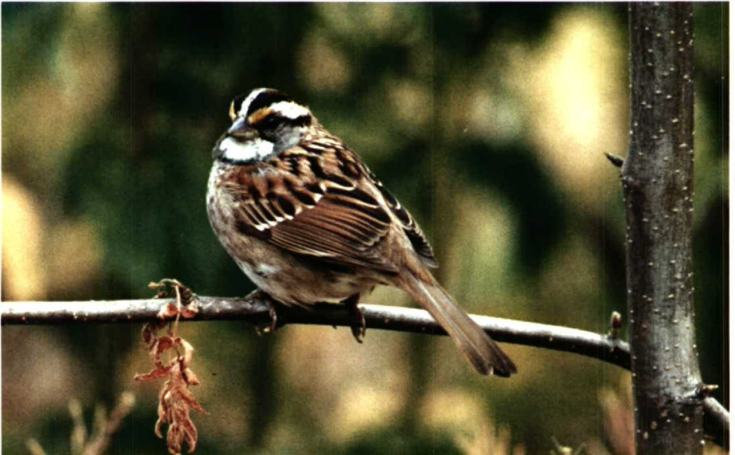
132 White-throated Sparrow Zonotrichia albicollis , Felixstowe, Suffolk, England, June 1992 (George Reszeter)