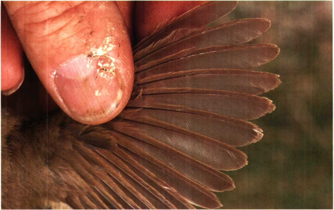
109 Struikrietzanger Acrocephalus dumetorum , Lelystad, Flevoland, 26 juni 1990