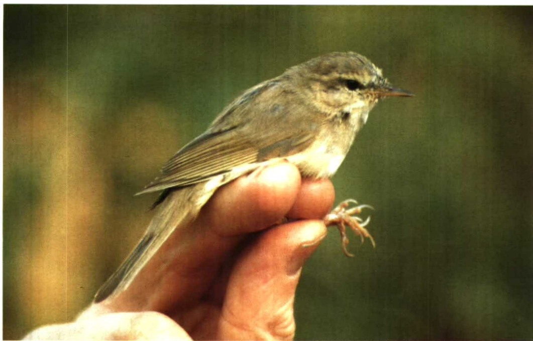
125 Dusky Warbler Phylloscopus fuscatus , showing grey upperparts, Mai Po, Hong Kong, February 1990 (Paul J Leader)