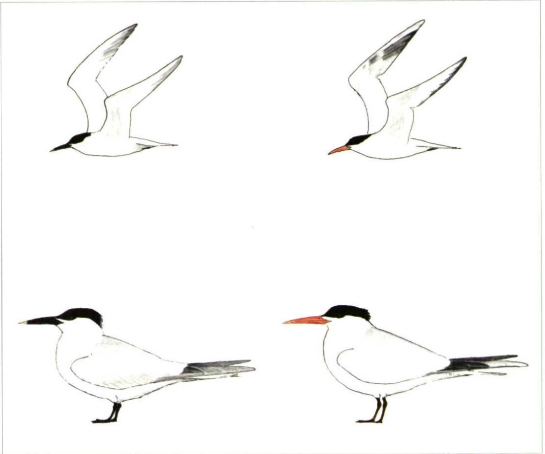
FIGUUR 1 Sierlijke Stern S elegans (rechts) en Grote Stern Sterna sandvicensis , Zeebrugge, Westvlaanderen, België, 12 juni 1988 (Peter Boesman)

147 Sierlijke Stern Sterna elegans en Grote Sterns Sterna sandvicensis , Zeebrugge, Westvlaanderen, België, 12 juni 1988 (Peter Boesman)