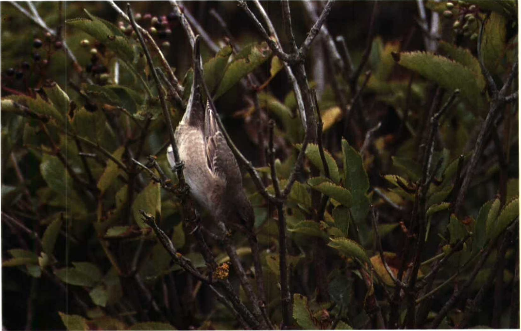
168 Sperwergrasmus Sylvia nisoria , Texel, Noordholland, augustus 1992

Ovl. Eén exemplaar met kleurring pleisterde van 9 tot 16 augustus bij Saint-Sauveur H. Niet minder dan 31 Ooievaars trokken op 23 augustus over Sint-Agatha-Rode B. Bij Tertre H zaten er drie op 24 augustus. Het (ontsnapte) mannetje Blauwvleugeltaling Anas discors , dat reeds vanaf december in het Molsbroek te Lokeren verblijft, was nu in eclipskleed en werd in augustus weer geregeld waargenomen. Op 17 en 18 augustus zwom een juveniele Witoegeend Aythya nyroca bij Doornzele. Een vrouwtje Ijseend Clangula hyemalis