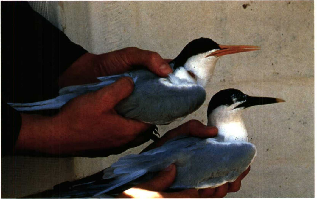
148 Sierlijke Stern Sterna elegans en Grote Stern S. sandvicensis , Banc d'Arguin/Arcachon, Gironde, Frankrijk, 10 juni 1987 (Philippe J Dubois) 149 Bengaalse Sterns Sterna bengalensis torresii , Karan, Arabische Golf, Saudiarabië, 4 juni 1991 (Arnoud B van den Berg)