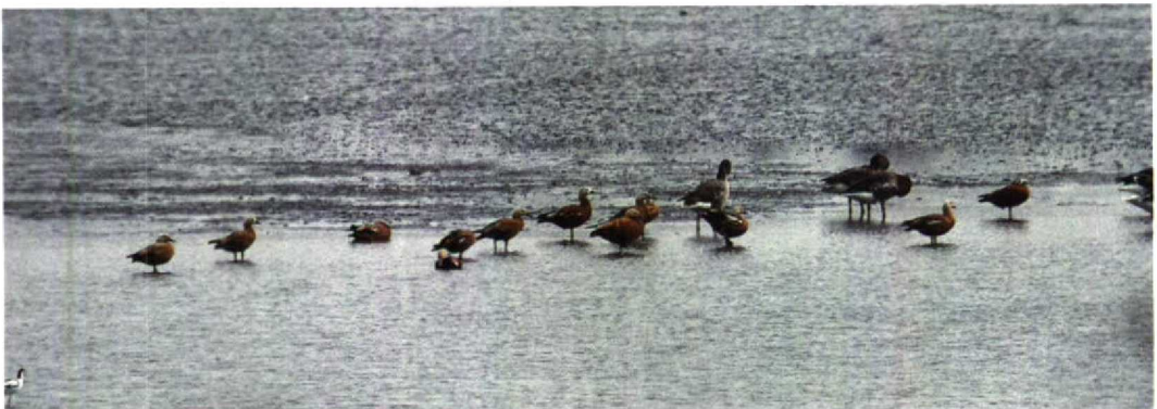
169 Casarca's Tadorna ferruginea , Lepelaarsplassen, Flevoland, augustus 1992

verbleef op 4 juli te Kallo Ovl. Een overzomerend mannetje Nonnetje Mergus albellus (aanwezig sinds 18 mei) bleef tot ten minste 29 augustus present bij Diepenbeek L. Op 15 juli zat het mannetje Rosse Stelstaart Oxyura jamaicensis nog steeds op De Gavers te Harelbeke Wvl. Op 2 augustus kreeg het mannetje van De Kuifeend (dat heel die periode aanwezig was) gezelschap van een tweede exemplaar. Waarschijnlijk één van deze twee mannetjes was op 9 augustus op Blokkesdijk. Op 29 augustus was er een waarneming