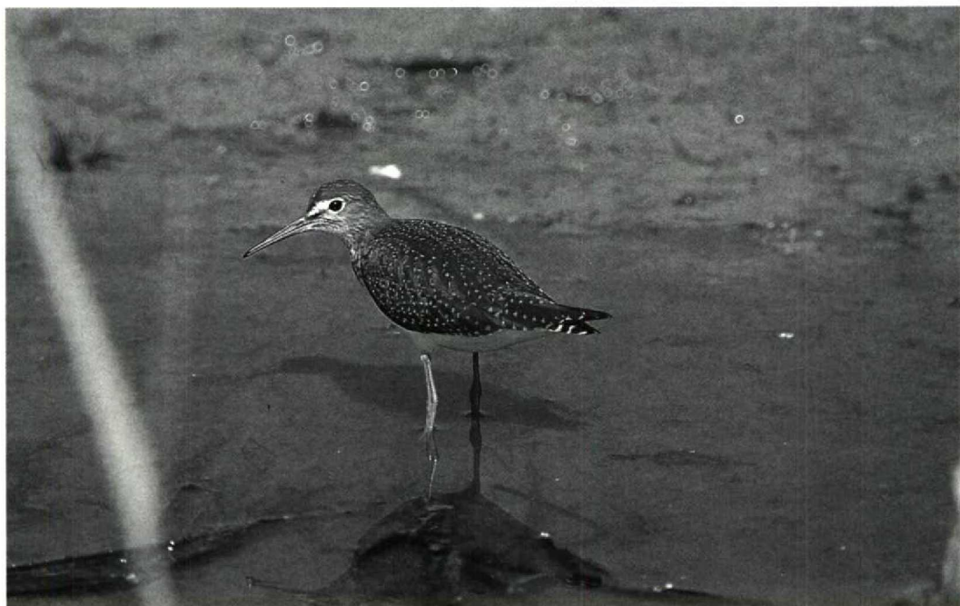
Mystery photograph 49. Solution in next issue