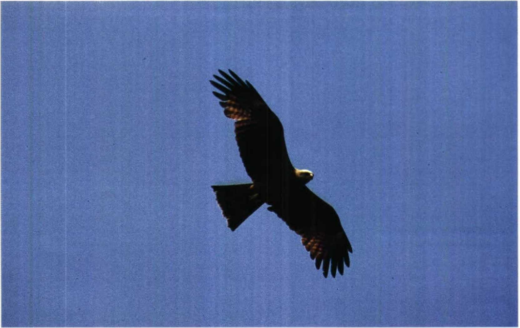
163 Zwarte Wouw Milvus migrans , Carel Coenraadpolder, Groningen, 24 mei 1992 164 Vale Pijlstormvogel Puffinus yelkouan , Hondsbossche Zeewering, Noordholland, 25 juli 1992 165 Vale Pijlstormvogel Puffinus yelkouan , Hondsbossche Zeewering, Noordholland, 25 juli 1992