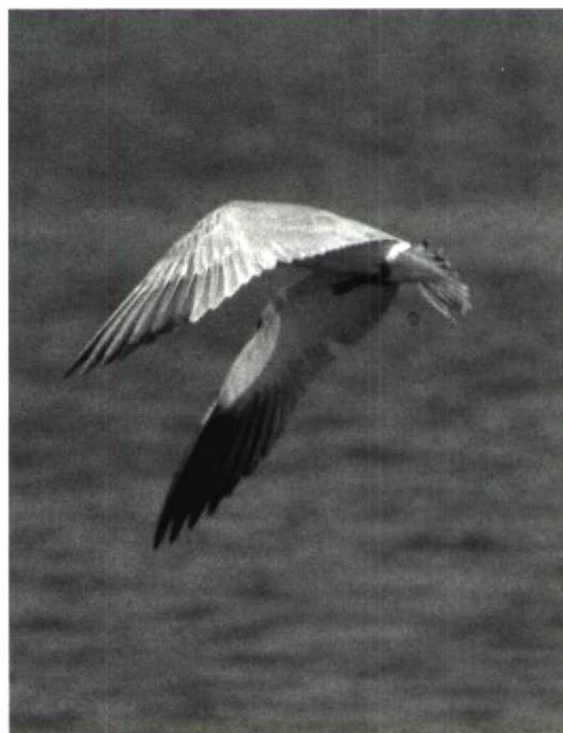
156 Caspian Tern Sterna caspia , Texas, USA, 26 February 1982

48 Last issue's mystery bird can be recognized as a gull or tern due to pale grey upperparts, whitish underparts and dusky wingtip. Colour and shape of bill, important identification features in gulls and terns, can not be seen. Large appearance and rather long legs may suggest a gull: the tail is spread which makes it difficult to see whether it is forked or not. Therefore, it is perhaps not surprising that 39% of the participants of the Dutch Birding mystery-bird competition in October 1989 on Texel, Noordholland, identified this bird as a Larus gull (with no less than 11 species being mentioned). However, the bird has narrower pointed wings and slightly shorter tail than a gull. The underwing shows extensive dusky tips to five outer primaries which appears a clue to identification since, apart from Caspian Tern Sterna caspia , all large pale tern species should show less contrast in underwing with more whitish at base of outer primaries. The photograph shows dark tips on rectrices and coverts which identify it as a first-year bird. This Caspian Tern was photographed on 26 February 1982 in Texas, USA.