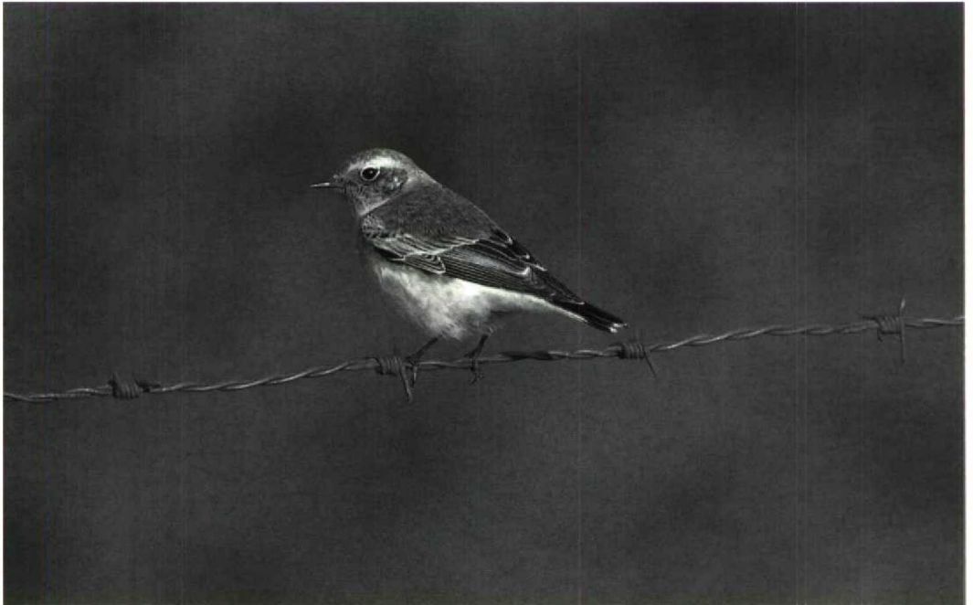
172 Bonte Tapuit Oenanthe pleschanka , Petten, Noordholland, 26 oktober 1992

tografeerde 'Blonde Tapuit' staat nog ter discussie.) Vanaf 27 september werden meer dan 10 Bosgorzen Emberiza rustica gemeld; indien alle waarnemingen worden ingediend en aanvaard, zou dit najaar beter zijn dan dat van het recordjaar 1980 toen er negen gevallen waren. Bovendien werden soorten gemeld als, bijvoorbeeld, Steppekievit Chettusia gregaria , Orpheus-spotvogel Hippolais polyglotta , Pallas' Boszanger P. proregulus (drie), Bruine Boszanger P. fuscatus en Roze Spreeuw Sturnus roseus zodat het najaar van 1992 veel hoogtepunten opleverde. ARNOUD B VAN DEN BERG