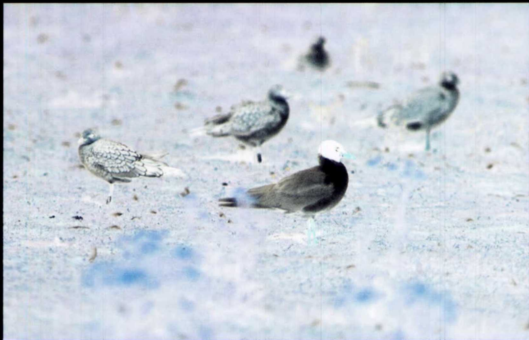
170 Adulte Zwartkopmeeuw Larus melanocephalus met twee juvenielen, Maasvlakte, Zuidholland, augustus 1992 171 Duinpieper Anthus campestris , Maasvlakte, Zuidholland, september 1992