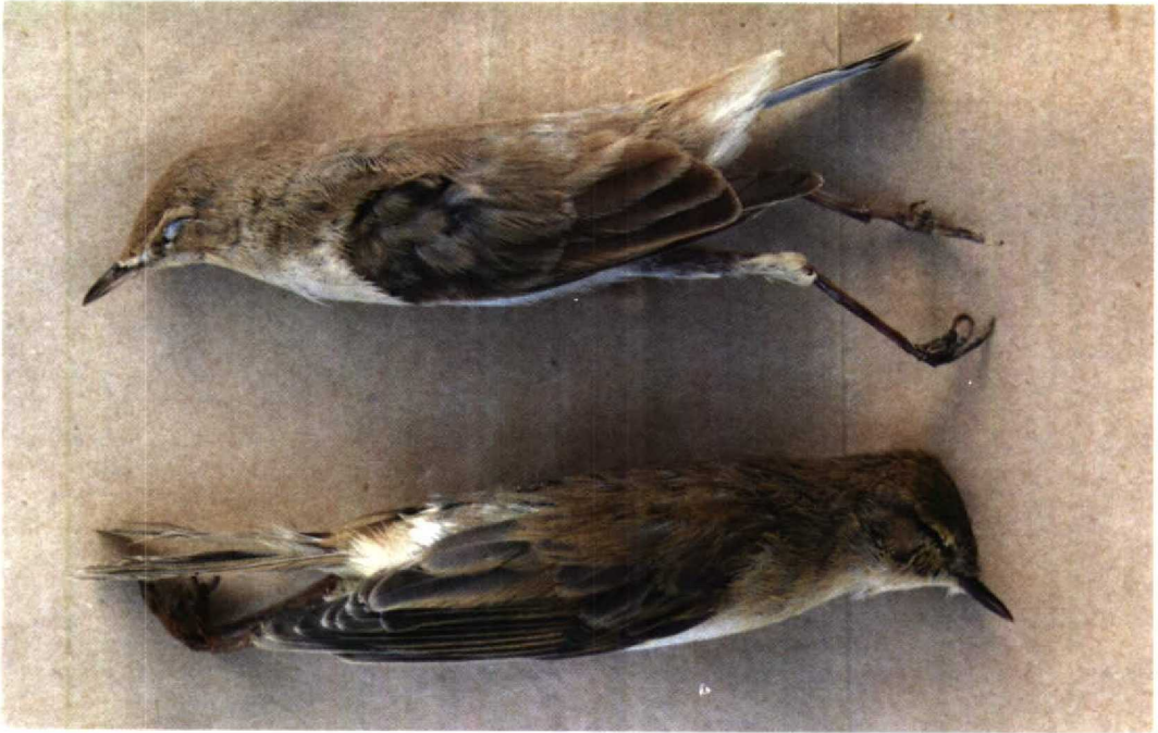
153 Booted Warbler Hippolais caligata (upper) and Willow Warbler Phylloscopus trochilus , Rosetta, Egypt, September 1991

Meinertzhagen, R 1930. Nicoll's birds of Egypt 1. London. Paz, U 1987. The birds of Israel. London.