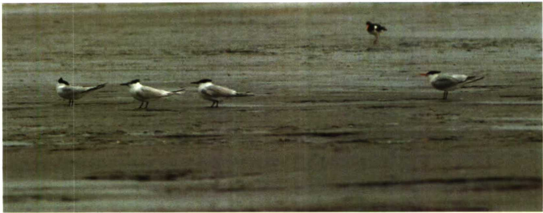
142-143 Sierlijke Stern Sterna elegans , Zeebrugge, Westvlaanderen, België, 12 juni 1988 ( Peter Boesman ) 144 Sierlijke Stern Sterna elegans , Zeebrugge, Westvlaanderen, België, 12 juni 1988 ( Patrick Beirens ) 145 Sierlijke Stern Sterna elegans , Zeebrugge, Westvlaanderen, België, 12 juli 1988 ( Arnoud B van den Berg ) 146 Sierlijke Stern Sterna elegans en Grote Sterns S sandvicensis , Zeebrugge, Westvlaanderen, België, 12 juni 1988 ( Peter Boesman )