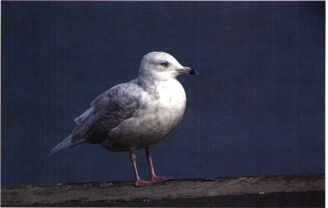
159 Kumlien's Gull Larus kumlieni kumlieni , second-winter, Le Portel, Pas-de-Calais, France, 12 September 1992 (Arnoud B van den Berg) 160 Ring-billed Gull Larus delawarensis , moulting to second-winter, Le Portel, Pas-de-Calais, France, 25 July 1992 (Arnoud B van den Berg)