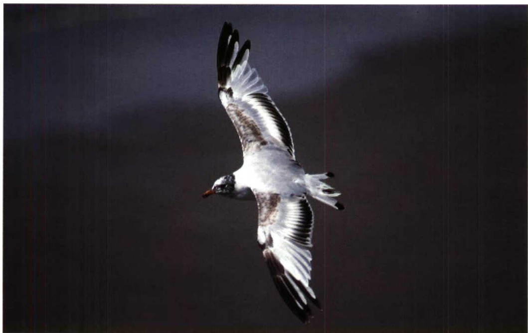
157 Zwartkopmeeuw Larus melanocephalus , ruiend van eerste zomer- naar tweede winterkleed, Le Portel, Pas-de-Calais, Frankrijk, 25 juli 1992 (Nikon F-801S, in de hand gehouden; Sigma 500 mm APO f7,2 AF; Kodachrome 64; 1/250, f8)

ervaring. Uiteindelijk zal men tot dezelfde positieve conclusie komen als Paul Doherty die bij het fotograferen van foeragerende sterns met een Nikon 300 mm f4 AF met handinstelling 20% scherpe foto's maakte en met autofocus 40% (Birding World 3: 324-325, 1990). Er zijn maar weinig lenzen langer dan 300 mm die een autofocus-functie hebben. Wel kan men lenzen (ook niet-AF) van kwaliteitsmerken combineren met een AF-converter om zo een autofocus-telelens te verkrijgen. Nadelig is dat daarbij in de regel meer dan een stop licht verloren gaat en dat de autofocus over een beperkt traject werkzaam is hetgeen met handinstelling moet worden gecompenseerd. Een voorbeeld van een goede Nikon-combinatie is de 300 mm AF lens met een 1,6 AF-converter resulterend in een 480 mm AF.