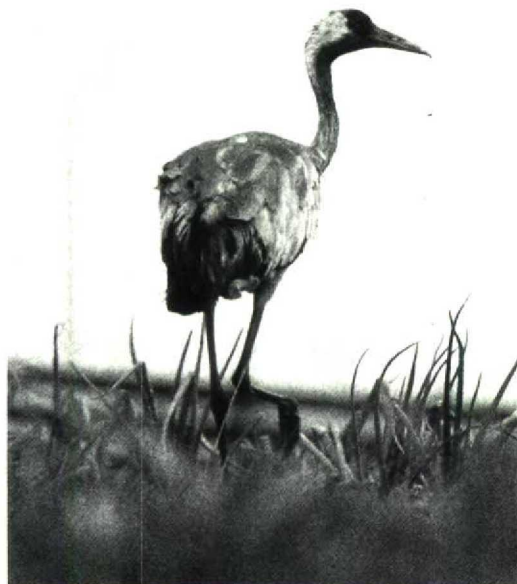
162 Kraanvogel Grus grus , Spierdijk, Noordholland, augustus 1992 (Marten van Dijk)

KRAANVOGELS TOT STERNS Pleisterende Kraanvogels Grus grus waren er in het Fochteloërveen van 6 juni tot 7 juli, bij Spierdijk Nh van 10 tot 15 augustus en twee in de Engbertsdijksvenen O van half juli tot 19 augustus. Op 25 augustus vlogen drie exemplaren over Zevenbergschen Hoek Nb. Tot 5 augustus verbleven nog maximaal vier Steltkluten Himantopus himantopus langs de Oostvaardersdijk. Van 13 tot 30 juli verbleven drie exemplaren in het Jaap Deensgat en van 18 tot 25 juli twee bij Vlaardingen. Verder waren er waarnemingen op 27 juli bij Bergen op Zoom en op 7 augustus op het Rammegors. De Griël Burhinus oedicanus van het Zwanenwater Nh bleef regelmatig gezien worden in juli. Een Morinelplevier Charadrius morinellus vloog op 20 augustus langs Rottumeroog en van 27 tot 29 augustus zaten er 10 bij de vuurtoren op de Maasvlakte Zh. De Steppiekievit Chettusia gregaria van Kampen bleef daar tot 1 juli. Naast het exemplaar dat op 2 juli bij Velddriël Gld zat was er een melding van een onvolwassen exemplaar op 23 en 24 augustus in de Erlecomse Waard Gld. Een Gestreepte Strandloper Calidris melanotos verbleef van 23 tot 27 juli in de Foppenspolder bij Maassluis Zh en een mannetje en een vrouwtje van deze soort zaten op 16 augustus op