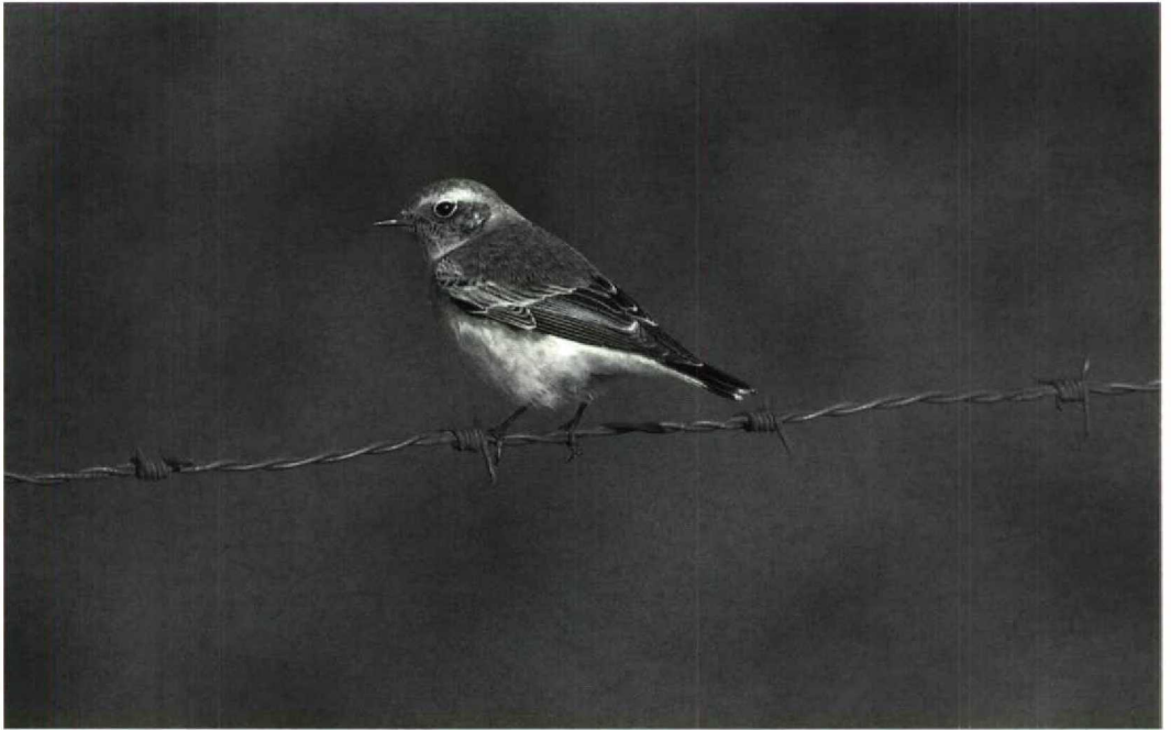
172 Bonte Tapuit Oenanthe pleschanka , Petten, Noordholland, 26 oktober 1992

tografeerde 'Blonde Tapuit' staat nog ter discussie.) Vanaf 27 september werden meer dan 10 Bosgorzen Emberiza rustica gemeld; indien alle waarnemingen worden ingediend en aanvaard, zou dit najaar beter zijn dan dat van het recordjaar 1980 toen er negen gevallen waren. Bovendien werden soorten gemeld als, bijvoorbeeld, Steppekievit Chettusia gregaria , Orpheus-spotvogel Hippolais polyglotta , Pallas' Boszanger P. proregulus (drie), Bruine Boszanger P. fuscatus en Roze Spreeuw Sturnus roseus zodat het najaar van 1992 veel hoogtepunten opleverde. ARNOUD B VAN DEN BERG