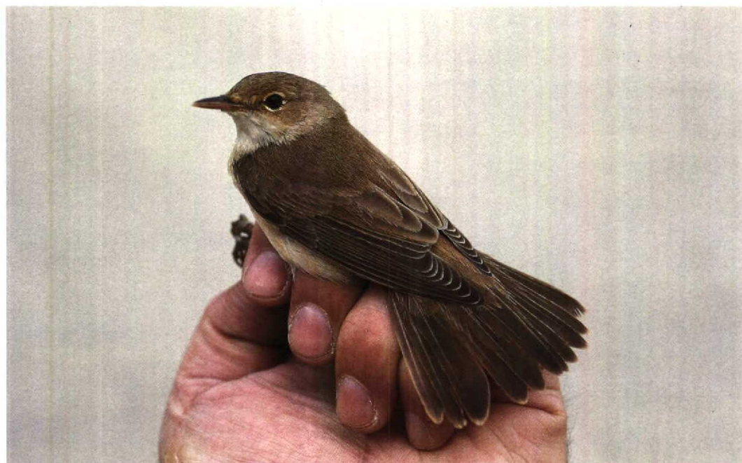
51 Eastern Reed Warbler Acrocephalus scirpaceus fuscus , Jubayl, Saudi Arabia, 16 April 1991 (Arnoud B van den Berg)