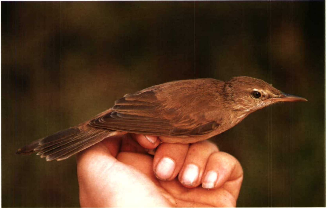
52 Clamorous Reed Warbler Acrocephalus stentoreus , showing damaged tail, southern Red Sea, Saudi Arabia, October 1991