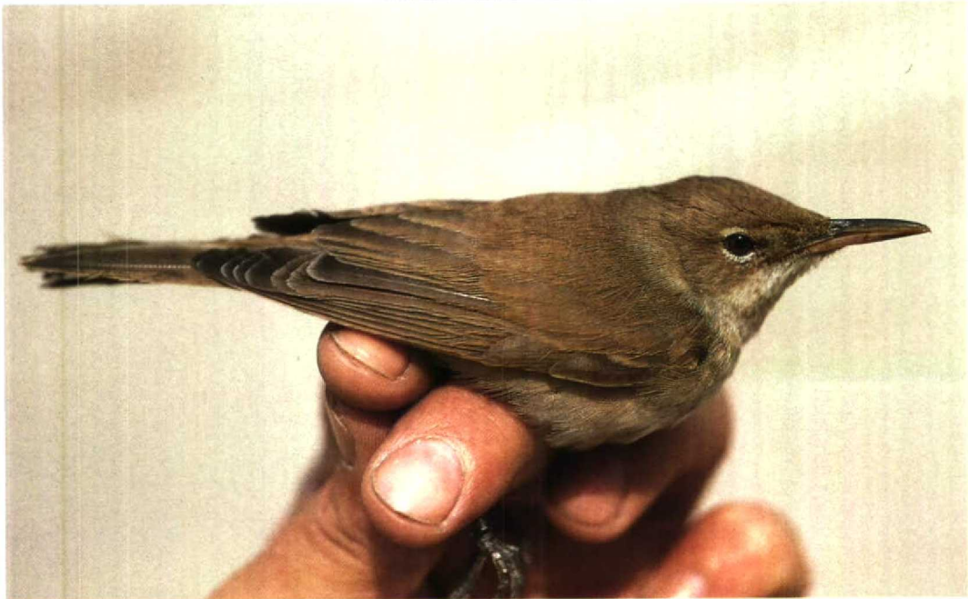
47 Basra Reed Warbler Acrocephalus griseldis , bill showing old fracture at base, Jubayl, Saudi Arabia, 1 May 1991