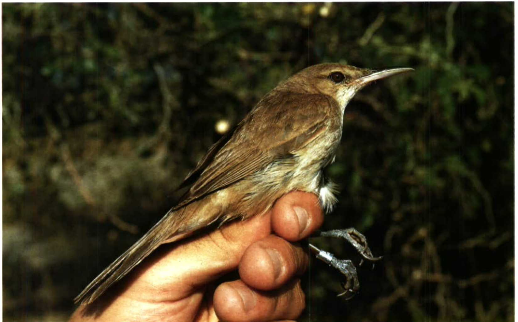
53 Western Clamorous Reed Warbler Acrocephalus stentoreus stentoreus , Israel, May 1986