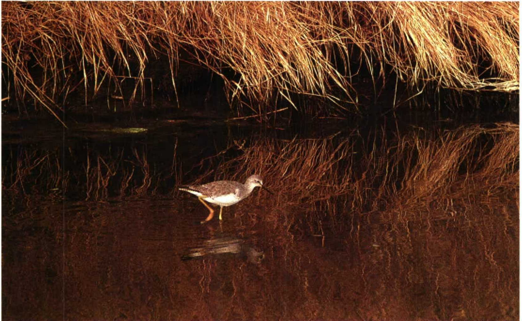
55 Kleine Geelpootruiter Tringa flavipes , adult winter, nabij Flauwersinlaag, Zeeland, oktober 1991 (Hans Gebuis)

De waarneming van deze Kleine Geelpootruiter