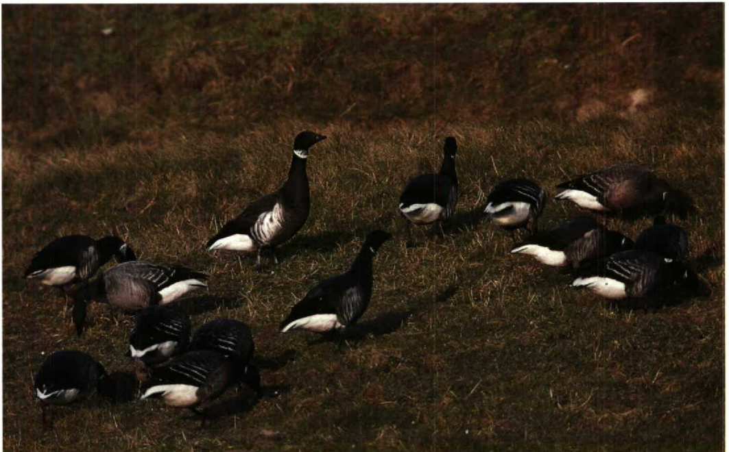
61 Black-throated Thrush Turdus ruficollis atrogularis , first-winter male, Giessen, Hessen, Germany, February 1992 62 Black Brant Branta bernicla nigricans , Dark-bellied Brent Geese B. b. bernicla and two 'hybrid' juveniles Black Brant x Dark-bellied Brent Goose, Grevelingendam, Zeeland, Netherlands, 22 January 1992

Ireland. The Rufous Turtle Dove Streptopelia orientalis remained at Mörbylånga, southern Öland, Sweden. In western Europe, away from the usual sites, Snowy Owls Nyctea scandiaca were reported in January from Sweden (only two), on 19 February from Achill Island, Mayo, Ireland, and from 8 March to 1 April on the Maasvlakte, Zuidholland, Netherlands. In North America, it has been a good winter for owls with record numbers of Hawk Owl Surnia ulula and Great Grey Owl Strix nebulosa in northern Minnesota and parts of Michigan, USA, and good numbers, also of Tengmalm's Owl Aegolius funereus , near Ottawa and Toronto, Ontario, Canada. An unseasonal Short-toed Lark Calandrella brachydactyla was trapped at Spurn, Humberside, England, on 12 January. From late January into March, a first-winter male Black-throated Thrush Turdus ruficollis atrogularis was staying with a flock of Fieldfares T. pilaris near Giessen, Hessen, Germany. About the fifth Hume's Yellow-browed Warbler Phylloscopus humei for Sweden was at Ystad, Skåne, from 4 to 23 January, and the second for Germany was one wintering near Bonn, Nordrhein-Westfalen, from mid-February into March. In England, not only a Hume's Yellow-browed Warbler was wintering, in Plymouth, Devon, from 13 January into March, but also a Yellow-browed Warbler P. inornatus , at Hayle Mill Pond, Cornwall, from 1 to at least 20 January. Wintering male Pine Buntings Emberiza leucocephalos in England at-