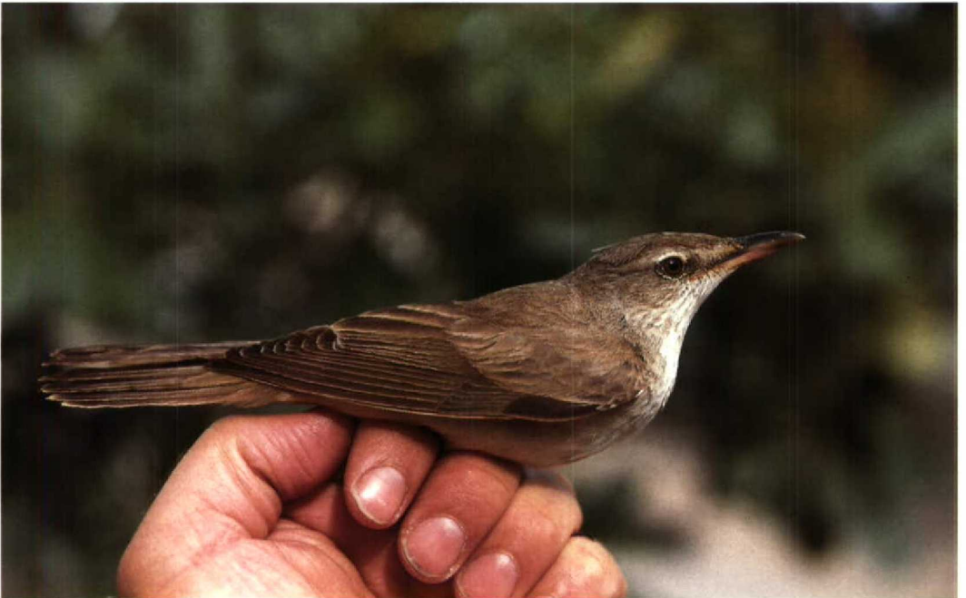
49 Eastern Great Reed Warbler Acrocephalus arundinaceus zarudnyi , Jubayl, Saudi Arabia, 9 April 1991