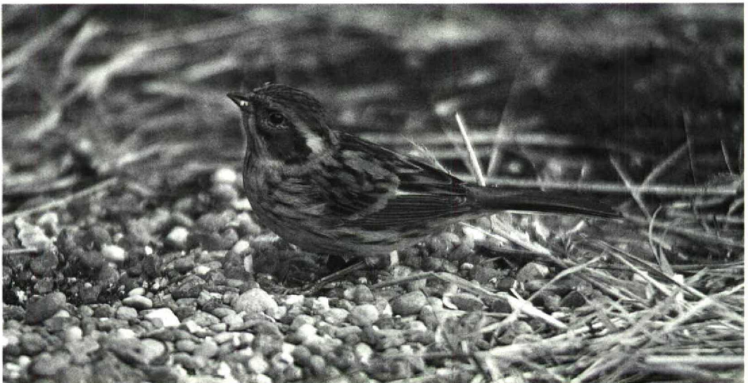
57 Yellow-throated Bunting Emberiza elegans , female in captivity, Britain, November 1991 (Colin Bradshaw)

Colin Bradshaw, 9 Tynemouth Place, North Shields, Tyne and Wear NE30 4BJ, UK