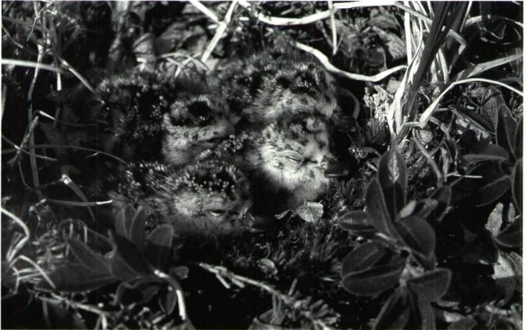
44 Spoon-billed Sandpiper Eurynorhynchus pygmeus , chicks in nest, Belyaka Spit, Kolyuchinskaya Gulf, northern Chukotski peninsula, Russia, 16 July 1987

desh, including two individuals colour-marked on the northern Chukotski peninsula! The only other recovery was received recently through the Asian Wetland Bureau from Hangzhou Bay near the mouth of the Yangtze, China. The bird was ringed as a chick in 1987, shot by a hunter on 10 May 1990 and subsequently eaten. These are the first and only recoveries to date of this species.