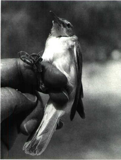
45 Basra Reed Warbler Acrocephalus griseldis , Jubayl, Saudi Arabia, 15 April 1991 (Arnoud B van den Berg)

Sooty Falcon Falco concolor on some offshore islands near Al Lith, southern Red Sea (Phillipe Gaucher pers comm and PS pers obs, cf Gaucher et al 1988). There exist as yet no records of Basra Reed Warbler from Bahrain (Erik Hirschfeld pers comm). Moreover, Richardson (1990) does not include the species for the United Arab Emirates and neither has it been recorded in Yemen (Brooks et al 1987). Hollom et al (1988) do not mention Basra Reed Warbler at all and, apparently, do not recognize the species.