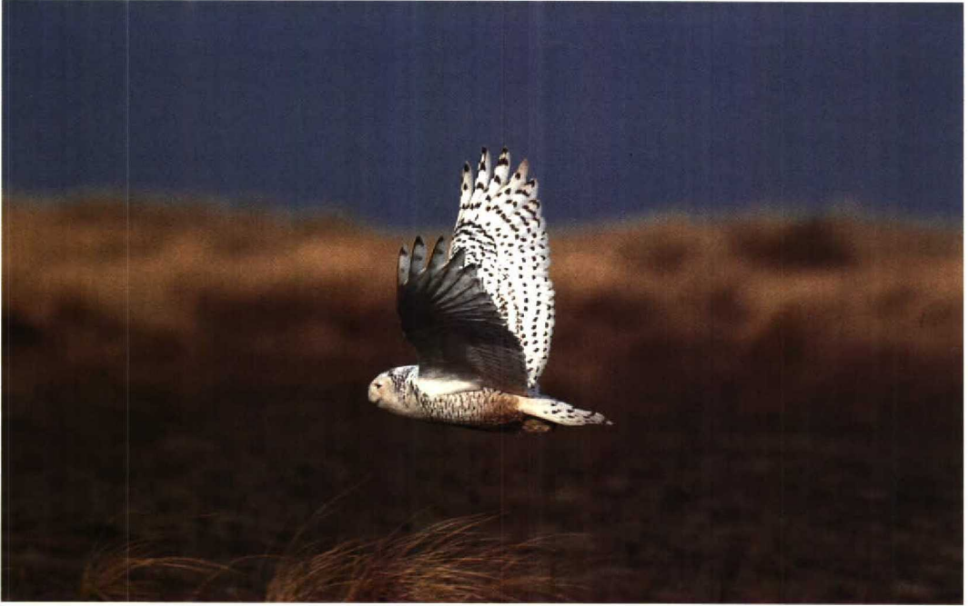
67-68 Sneeuwuil Nyctea scandiaca , Maasvlakte, Zuidholland, maart 1992