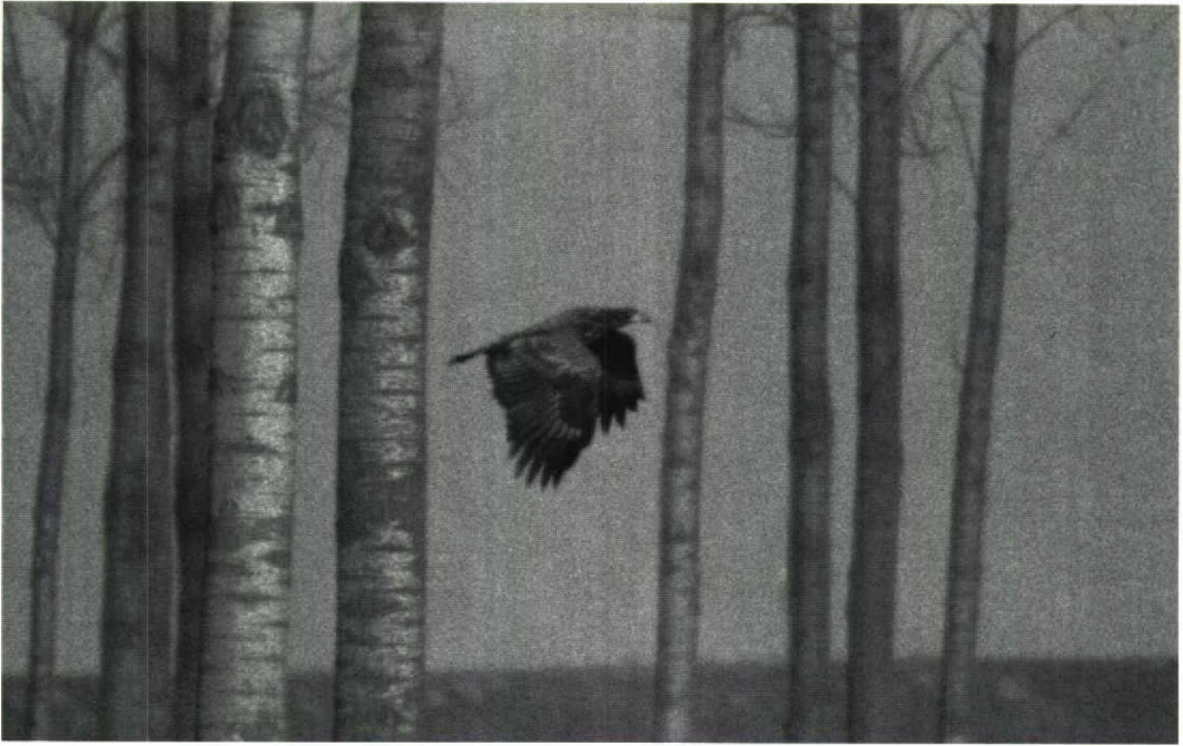
66 Zearend Haliaeetus albicilla , Verdrongen land van Saeftinge, Zeeland, februari 1992

op deze datum werd er ook één gezien bij Goessche Sas Z. Op 25 februari zat er één langs de Brouwersdam Zh. Het vermelden waard is de waarneming van een Noordse Pijlstormvogel Puffinus puffinus die op 2 januari langs Camperduin vloog. Op 4 januari vloog daar ook een Vaal Stormvogeltje Oceanodroma leucorhoa langs. Tot 31 januari werden maximaal drie Kuifaalscholwers Phalacrocorax aristotelis gezien in de wijde omgeving van Vlissingen. Op 4 januari zat er één bij de Eemshaven Gr en op 24 januari één bij Den Helder Nh. Een Kleine Zilverreiger Egretta garzetta bleef de gehele periode aanwezig in de omgeving van Vliegveld Midden-Zeeland bij het Veerse Meer Z. Ook bleek er (nog steeds) één exemplaar aanwezig bij Oudeschild op het eiland Texel Nh op 28 en 29 februari. Tot 26 januari was de Grote Zilverreiger E alba van Nuland Nb nog present, van 1 tot 21 februari verbleef er één bij Dordrecht Zh en vanaf 27 februari werd er weer één in de Oostvaardersplassen Fl gezien. Op 2 januari zaten nog vijf Dwergganzen Anser erythropus bij Anjum Fr en op 10 januari nog drie bij Strijen Zh. Andere exemplaren zaten van 10 januari tot 25 februari bij Den Bommel Zh, op 12 januari en 14 februari in de Ooypolder Gld, op 18 januari in de Kievitslanden Fl, op 21 januari bij Gaast Fr, op 24 januari zes exemplaren bij Groot-Amers Zh, van 8 tot 10 februari bij Zeewolde Fl en op 9 februari bij Marle Gld. Aangenomen dat het steeds dezelfde groep van zeven Sneeuwganzen A caerulescens betreft, volgt hier een