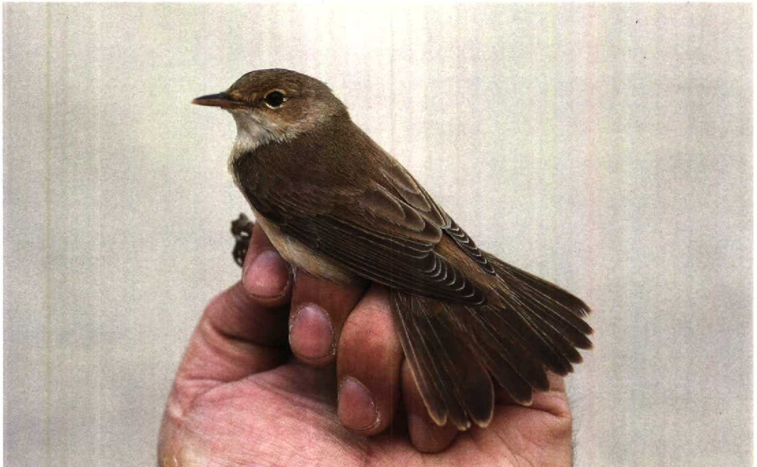
51 Eastern Reed Warbler Acrocephalus scirpaceus fuscus , Jubayl, Saudi Arabia, 16 April 1991