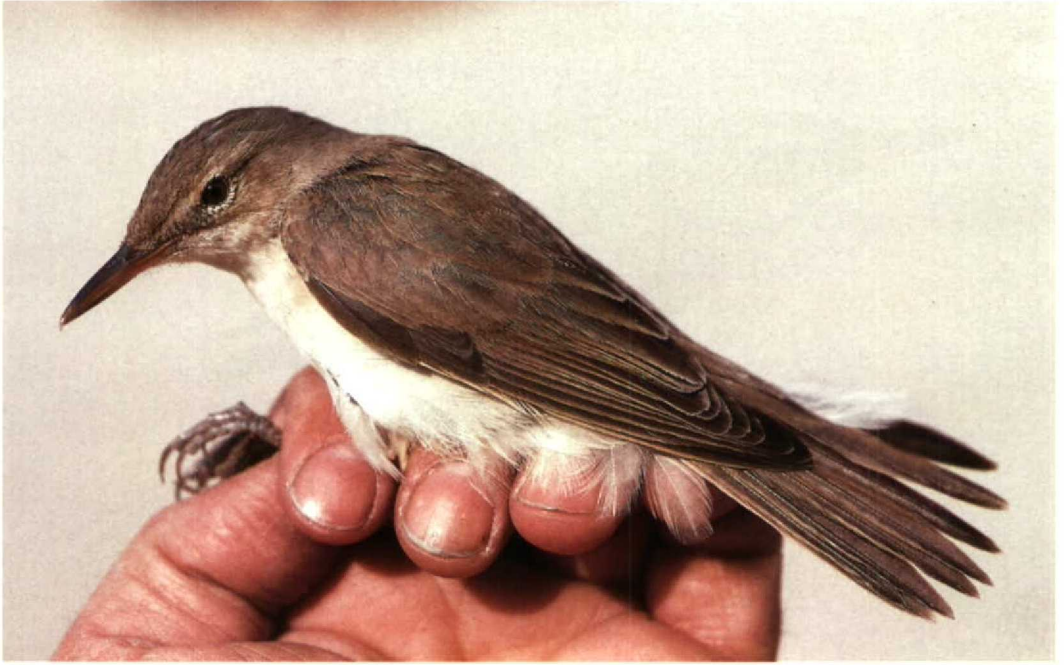
48 Basra Reed Warbler Acrocephalus griseldis , Jubayl, Saudi Arabia, 4 May 1991