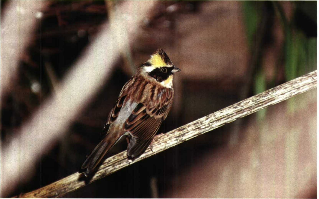
58 Yellow-throated Bunting Emberiza elegans , male in captivity, Britain, November 1991 (Colin Bradshaw)

Mystery photograph 46. Solution in next issue