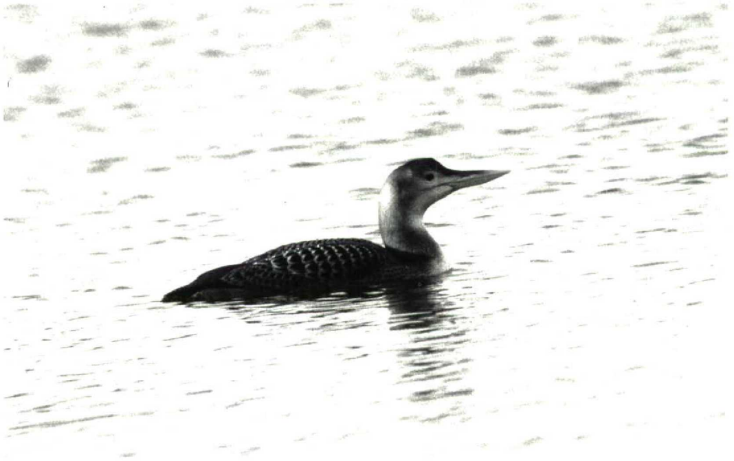
59 White-billed Diver Gavia adamsii , first-winter, Ahausen, Diepholz, Niedersachsen, Germany, January 1992 (Stefan Pfützke)

dam and Oude Tonge, Zuidholland, the Netherlands, from 22 January onwards, appeared to be accompanied by two 'hybrid' juveniles; out of c 60 previous records of Black Brant in the Netherlands, this might be the first of one having offspring. In Ireland, a Black Brant at Newcastle, Down, was wintering along with a hybrid Brent Goose until mid-February. In late January, 10 Dark-bellied Brent Geese at Merja Zerga constituted the first record of this species for Morocco. From 20 to at least 26 January, an (unringed) adult male Falcated Duck Anas falcata was present in a flock of Gadwalls A strepera at Bloemendaal, Noordholland. Until at least mid-April, presumably the same bird remained with a flock of Gadwalls south of Bennebroek, Noordholland. If accepted, this will be the second record of this species for the Netherlands. Thailand had a good winter for rare ducks with two species new for the country. On 11 January, two male and two female Baikal Teal A formosa were discovered among an assemblage of over 12 000 Garganey A querquedula at Kamphaengsaen, Nakhon Pathom, and at least one male was still present on 9 February. Another long-expected first record for Thailand was a male Mallard A platyrhynchos at Chiang Saen Lake, in the extreme north of the country, on 27 December 1991. The Ring-necked Duck Aythya collaris at Merja Khalloufa, Moroc-