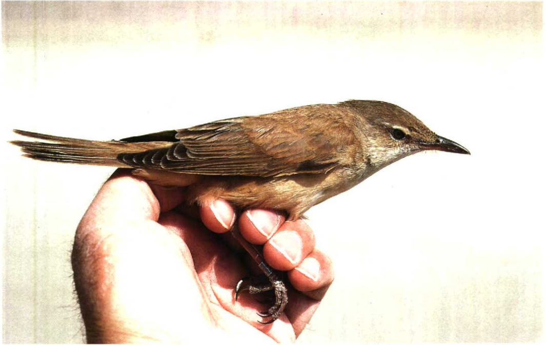
50 Eastern Great Reed Warbler Acrocephalus arundinaceus zarudnyi , Jubayl, Saudi Arabia, 14 April 1991 (Arnoud B van den Berg)