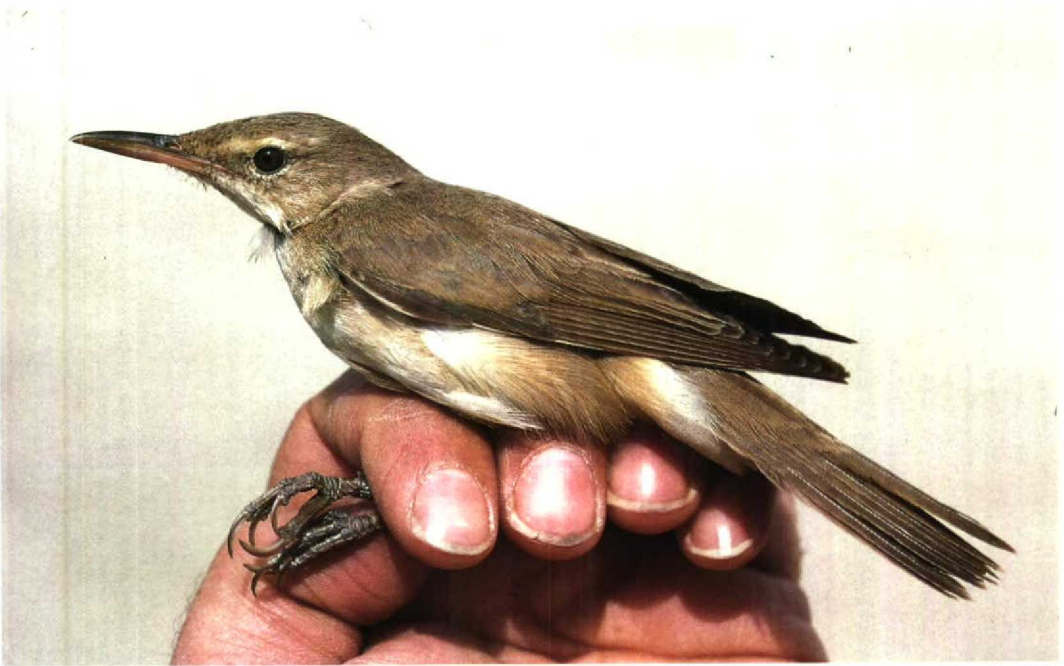
46 Basra Reed Warbler Acrocephalus griseldis (same bird as in plate 45), Jubayl, Saudi Arabia, 15 April 1991