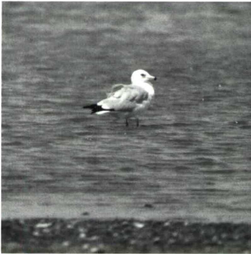
54 Ring-billed Gull Larus delawarensis , adult-winter, Palmarin, Sine-Saloum, Senegal, 12 October 1985 (François Baillon)

Hann, Dakar, Senegal, first-winter (P J Dubois, P Le Maréchal et al).