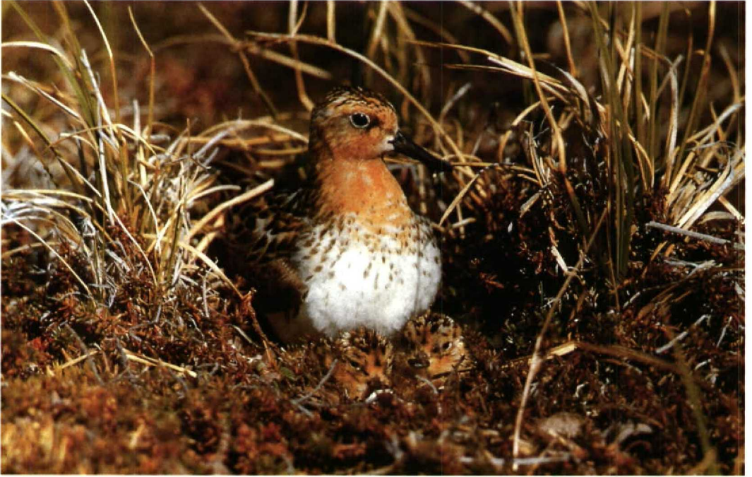
42-43 Spoon-billed Sandpiper Eurynorhynchus pygmeus , adult with two chicks, Belyaka Spit, Kolyuchinskaya Gulf, northern Chukotski peninsula, Russia, 14 July 1987. One of these two chicks was recovered later from China