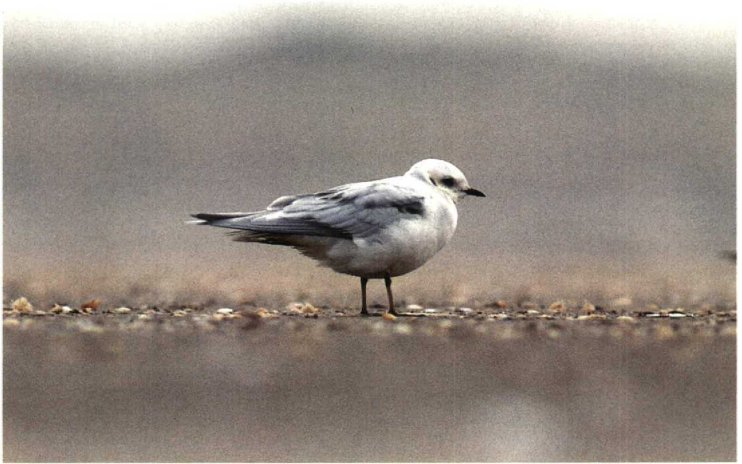
7 Ross' Meeuw / Ross's Gull Rhodostethia rosea , IJmuiden, Noordholland, 23 november 1992