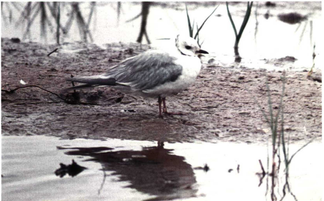
8 Ross' Meeuw / Ross's Gull Rhodostethia rosea , Vlieland, Friesland, juni 1958 (Jan Kist)