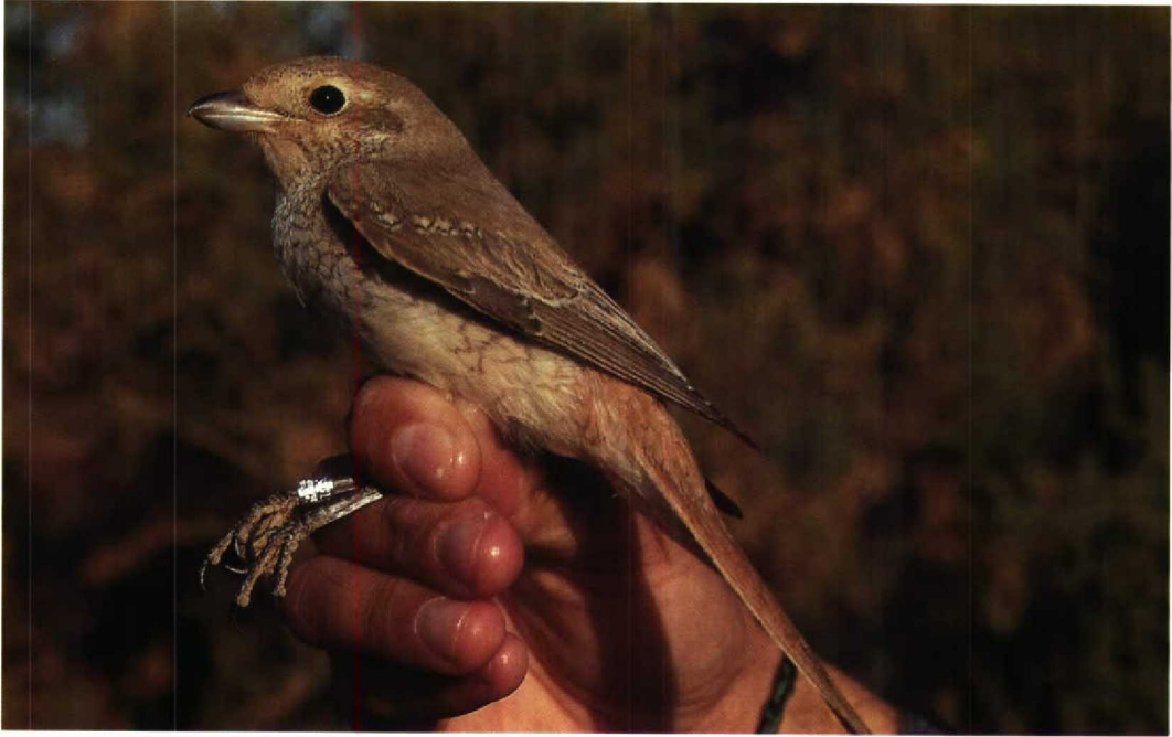
16 Isabelline Shrike / Izabelklauwier Lanius isabellinus , Eilat, Israel, November 1992 (Leo J R Boon)

Po on 21 November); the third Rufous-faced Warbler Abroscopus albogularis (the first since 1964) was at Ho Cheung from 10 January 1993.)