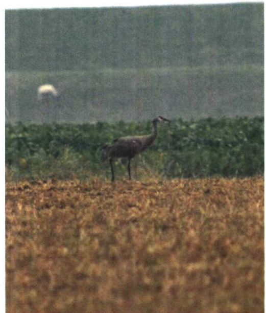
1 Canadese Kraanvogel / Sandhill Crane Grus canadensis , Paesens, Friesland, 29 september 1991 (Arnoud B van den Berg)