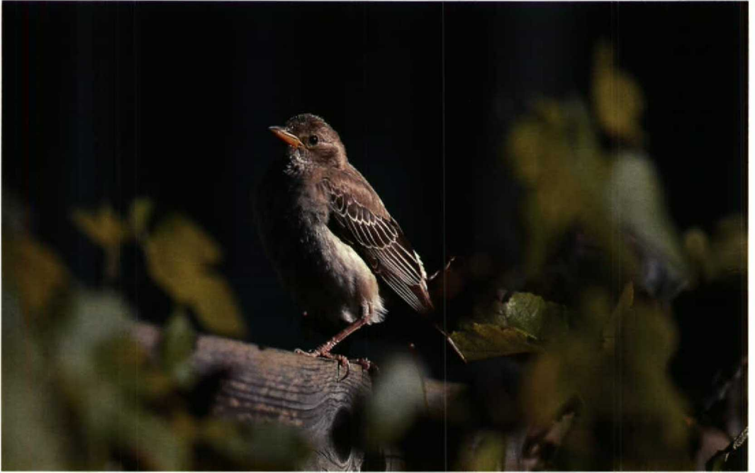
211 Roze Spreeuw / Rosy Starling Sturnus roseus , De Cocksdorp, Texel, Noordholland, oktober 1993 (Hans Gebuis)

Schiermonnikoog op 7 september. Dit najaar werd Nederland overspoeld door Zwarte Mezen Parus ater , met bijvoorbeeld een waarneming van 670 exemplaren trekkend langs Vlissingen, Zeeland, op 7 september. Een aardige influx van Taigaboomkruipers Certhia familiaris zorgde voor een vangst op 1 oktober te Bloemendaal, Noordholland, en waarnemingen op 9 oktober in het Wilgenbos langs de Oostvaardersdijk, van 14 tot 22 oktober op Terschelling (drie), van 16 tot 29 oktober op Schiermonnikoog (waaronder ook een vangst), op 22 oktober te Zeist, Utrecht, van 24 oktober tot in november in Lauwersoog, van 28 tot 31 oktober op Texel en van 29 tot 31 oktober op Vlieland (twee). Een 30-tal Buidelmezen Remiz pendulinus werd, voornamelijk op trektelposten, verspreid over het hele land waargenomen. Op 21 oktober werd aan het eind van de middag bij de Hooge Berg op Texel een eerste-winter Izabelklauwier Lanius isabellinus waargenomen. Tussen 18 september en 15 oktober werden acht Grauwe Klauwieren L. collurio gemeld en een onvolwassen Roodkopklauwier L. senator zat op 4 en 5 september op Schiermonnikoog. Meer of minder serieuze waarnemingen van Notekrakers Nucifraga caryocatactes werden opgetekend op 21 september te Son, Noordbrabant, op 5 oktober te Kampen, op 19 oktober te