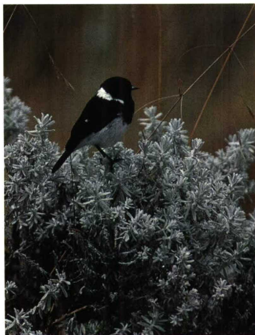
190 Blue-winged Goose / Blauwvleugelgans Cyanochen cyanopterus , Gaferson Reservoir, Addis Abeba, Ethiopia, December 1990 (Karel Beylevelt) 191 Ethiopian Stonechat / Ethiopische Roodborsttapuit Saxicola torquata albobasciata , Bale Mountains NP, Ethiopia, December 1990 (Karel Beylevelt) 192 African Paradise Flycatcher / Afrikaanse Paradijsmonarch Terpsiphone viridis ferreti , Sodore, Ethiopia, December 1990 (Karel Beylevelt)