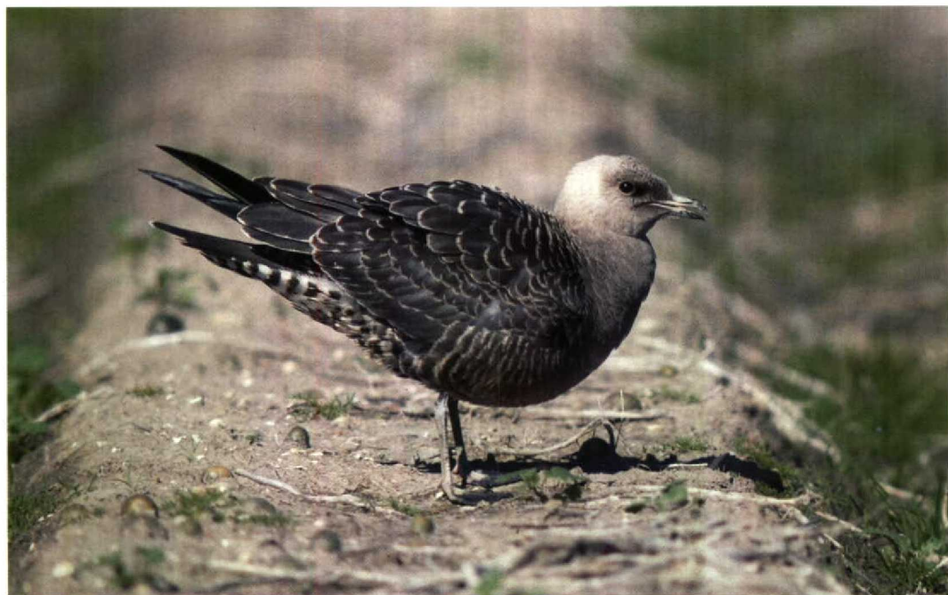
203 Kleinste Jager / Long-tailed Skua Stercorarius longicaudus , Breezand, Noordholland, 5 september 1993 ( Marten van Dijl ) 204 Morinelplevier / Dotterel Charadrius morinellus , Maasvlakte, Zuidholland, 9 september 1993 ( Marjolein Bayens )