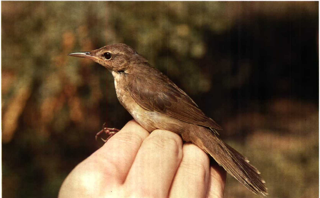
171 Styan's Grasshopper Warbler / Koreaanse Sprinkhaanzanger Locustella pleskei , Mai Po Marshes NR, Hong Kong, 9 September 1991

Middendorff's and Styan's occupy distinct breeding and wintering ranges and do not come into contact except occasionally in coastal China. During the breeding season, Middendorff's is confined to the maritime regions of eastern Russia which surround the Sea of Okhotsk including Sakhalin, Kamchatka, the Commander Islands and the Kuril Islands (Dement'ev & Gladkov 1968, Stepanyan 1990), as well as northern and eastern Hokkaido in northern Japan (Stepanyan 1990, Brazil 1991). In winter, it is found throughout the Philippines (Dickinson et al 1991) and has been recorded south to Sulawesi and Luang, Indonesia (White & Bruce 1986). As a migrant, Middendorff's was recorded by La Touche (1912, 1925-34) as passing in numbers at Shaweishan, an island 30 km off the mouth of the Yangtze