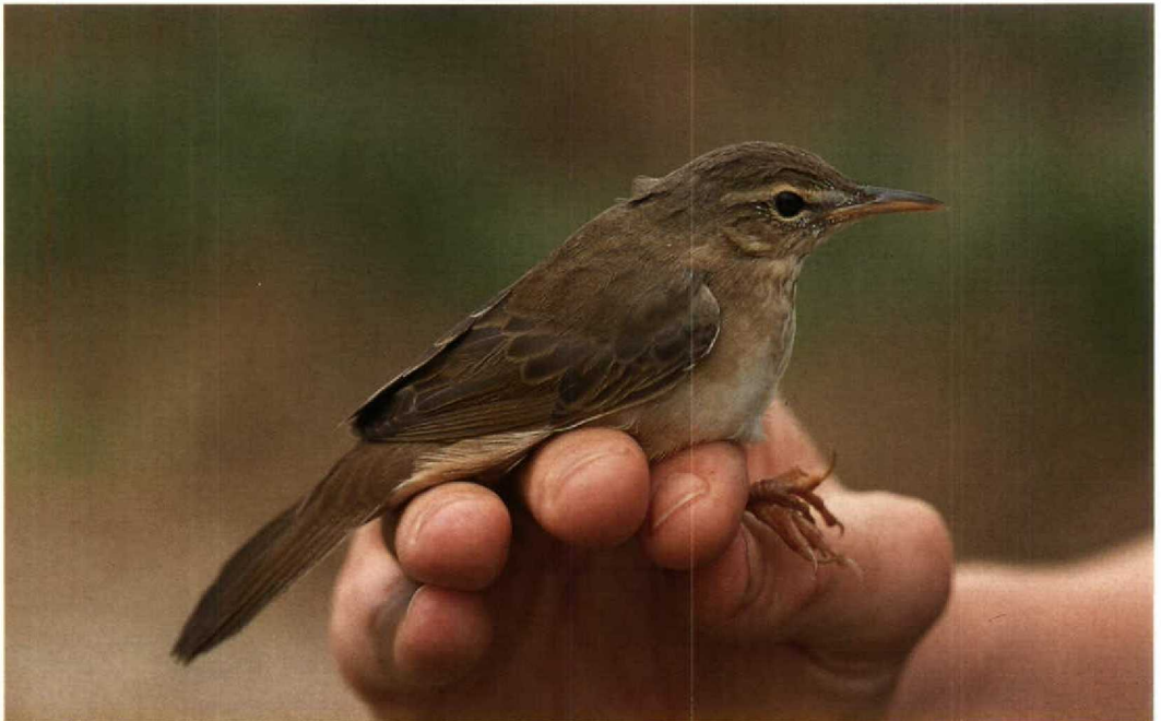
170 Styan's Grasshopper Warbler / Koreanse Sprinkhaanzanger Locustella pleskei , Mai Po Marshes NR, Hong Kong, 17 April 1992 (Peter R Kennerley)

The dark centres and paler fringes to the mantle-feathers and conspicuous rufous rump of Pallas's preclude any possibility of confusion with Styan's in which these features are almost entirely suppressed. Indeed, Styan's is more likely to be mistaken for Oriental Reed Warbler Acroce-