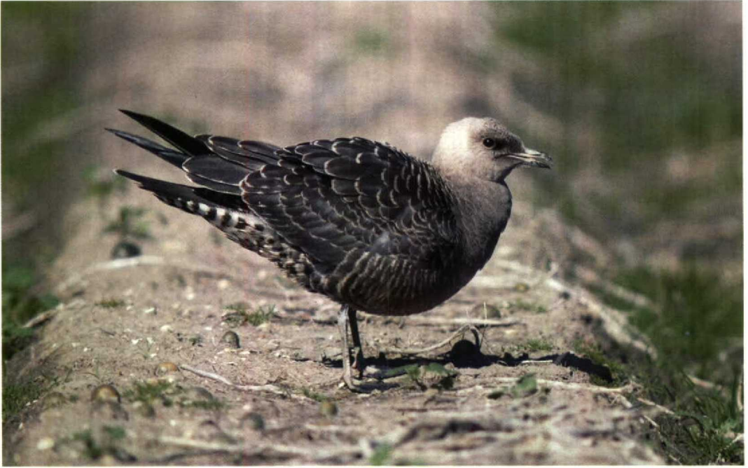
203 Kleinste Jager / Long-tailed Skua Stercorarius longicaudus , Breezand, Noordholland, 5 september 1993 ( Marten van Dijl ) 204 Morinelplevier / Dotterel Charadrius morinellus , Maasvlakte, Zuidholland, 9 september 1993 ( Marjolein Bayens )