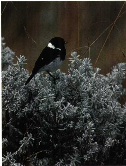
190 Blue-winged Goose / Blauwvleugelgans Cyanochen cyanopterus , Gaferson Reservoir, Addis Abeba, Ethiopia, December 1990 (Karel Beylevelt) 191 Ethiopian Stonechat / Ethiopische Roodborsttapuit Saxicola torquata albofasciata , Bale Mountains NP, Ethiopia, December 1990 (Karel Beylevelt) 192 African Paradise Flycatcher / Afrikaanse Paradijsmonarch Terpsiphone viridis ferreti , Sodore, Ethiopia, December 1990 (Karel Beylevelt)