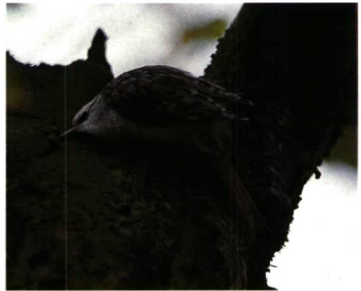
205 Hop / Hoopoe Upupa epops , Texel, Noordholland, oktober 1993 (Carl Derks) 206 Zwarte Ibis / Glossy Ibis Plegadis falcinellus , Wolphaartsdijk, Zeeland, oktober 1993 (Peter L Meininger) 207 Grote Pieper / Richard's Pipit Anthus richardi , IJmeerdijk, Almere, Flevoland, 11 september 1993 (Karel Mauer) 208 Taigaboomkruiper / Eurasian Treecreeper Certhia familiaris , Terschelling, Friesland, oktober 1993 (René van Rossum)

tweetallen op 11 september bij de Eemshaven, Groningen, en op 9 en 10 oktober bij het Zwanenwater, Noordholland. Rosse Franjepoten P. fulicarius werden gemeld op 25 september in de Bandpolder, Friesland, op 28 september bij Ransdorp, Noordholland, op 2 oktober op Schiermonnikoog, Friesland, en bij Scheveningen, Zuidholland, op 11 en 14 oktober op Terschelling, op 17 oktober op Engelsmanplaat, Friesland, en op 26 oktober langs Callantsoog, Noordholland. C 70 Middelste Jagers Stercorarius pomarinus werden tot 3 oktober langs de kust genoteerd. Kleinste Jagers S. longicaudus werden opgemerkt op 2 september en 15 september (twee) bij Camperduin, op 3 september langs de Oostvaardersdijk, Flevoland, op 4 en 5 september bij Breezand, Noordholland, op 6 september op Texel, op 12 september op Terschelling, op 16 september bij Westkapelle, op 18 september op de Maasvlakte en op 26 september bij Egmond aan Zee,