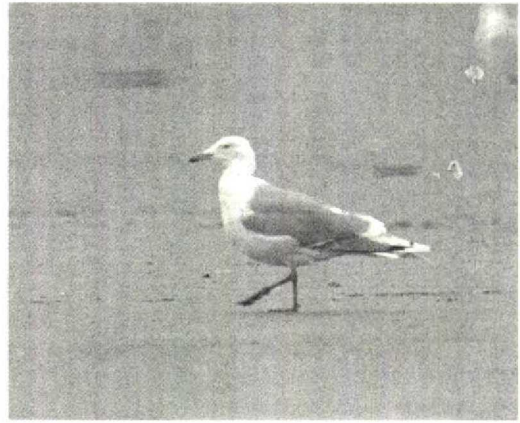
180 Herring Gull / Zilvermeeuw Larus argentatus argentatus , adult, with black marks on wing-tip probably restricted to two or three outermost primaries, IJmuiden, Noordholland, 10 February 1990

W (Ted) Hoogendoorn, Notengaard 32, 3941 LW Doorn, Netherlands Klaas J Eigenhuis, Seringenstraat 6, 1431 BJ Aalsmeer, Netherlands Jaap van 't Hof, Lijnbaan 3, 1431 CH Aalsmeer, Netherlands