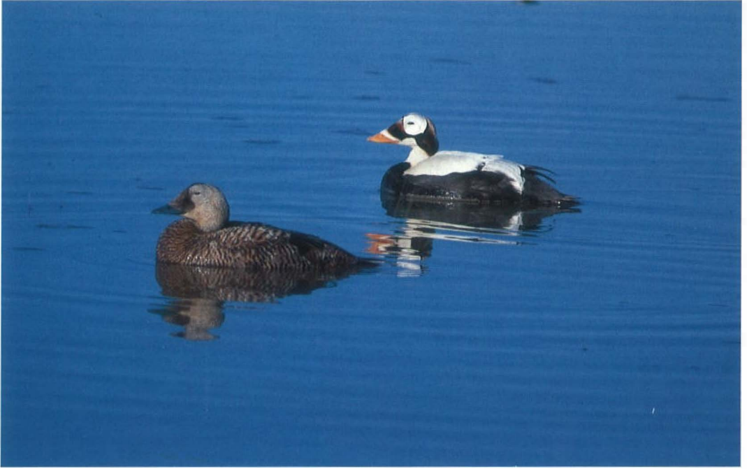
11 Spectacled Eiders / Brileiders Somateria fischeri , Deadhorse/Prudhoe Bay, Alaska, USA, 21 June 1991 12 Spectacled Eider Somateria fischeri , Deadhorse/Prudhoe Bay, Alaska, USA, June 1991