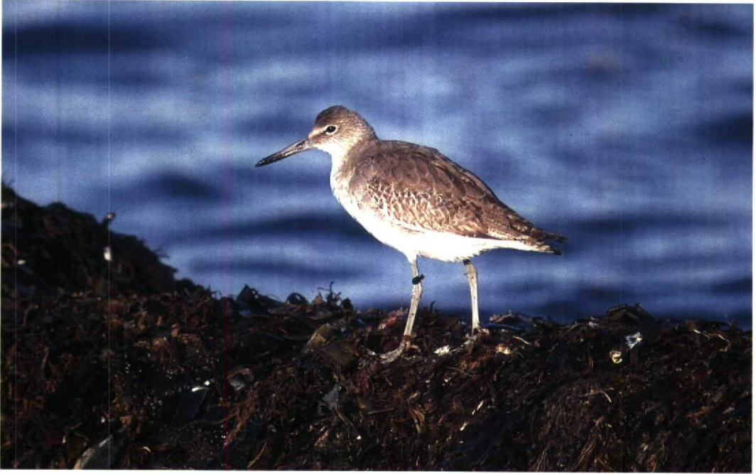
14 Willet / Willet Catoptrophorus semipalmatus , Mølen, Vestfold, Norway, October 1992