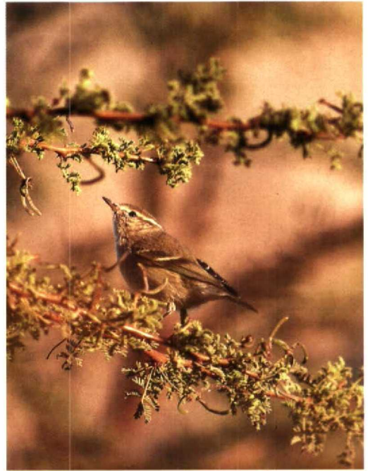
49 Cyprus Pied Wheatear / Cyprese Tapuit Oenanthe cyprica , Abu Simbel, Egypt, 31 January 1993 (Leo J R Boon) 50 Hume's Yellow-browed Warbler / Humes Bladkoning Phylloscopus humei , Eilat, Israel, 7 February 1993 (Leo J R Boon) 51 Sociable Plovers / Steppekieviten Chettusia gregaria , United Arab Emirates, January 1993 (Peter H Barthel)