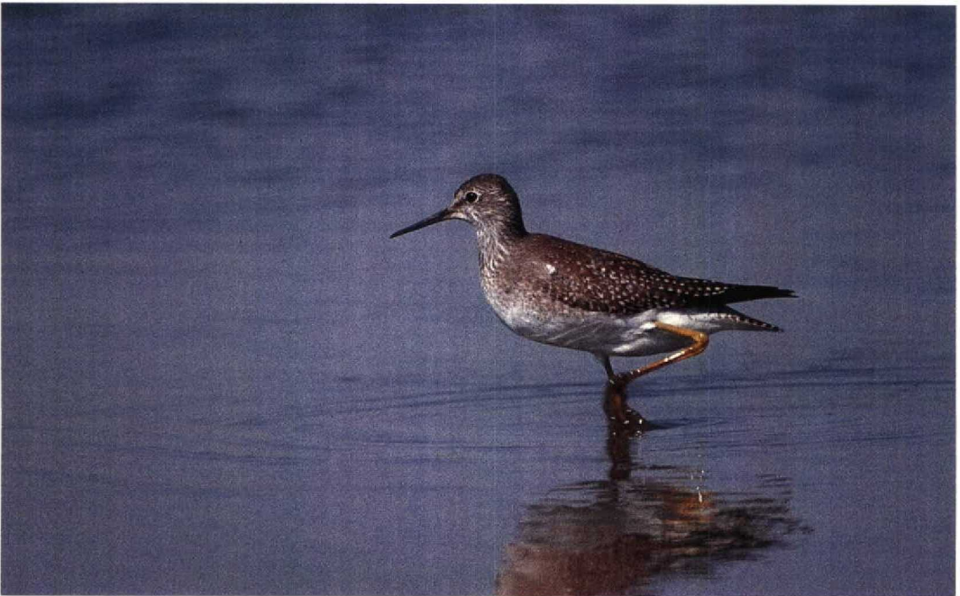
41 Lesser Yellowlegs / Kleine Geelpootruiter Tringa flavipes , Ontario, Canada, August 1988 (Colin Bradshaw)