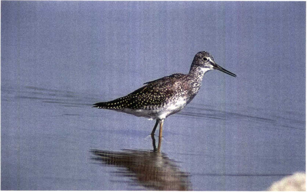
40 Greater Yellowlegs / Grote Geelpootruiter Tringa melanoleuca , Manitoba, Canada, August 1991 (Colin Bradshaw)