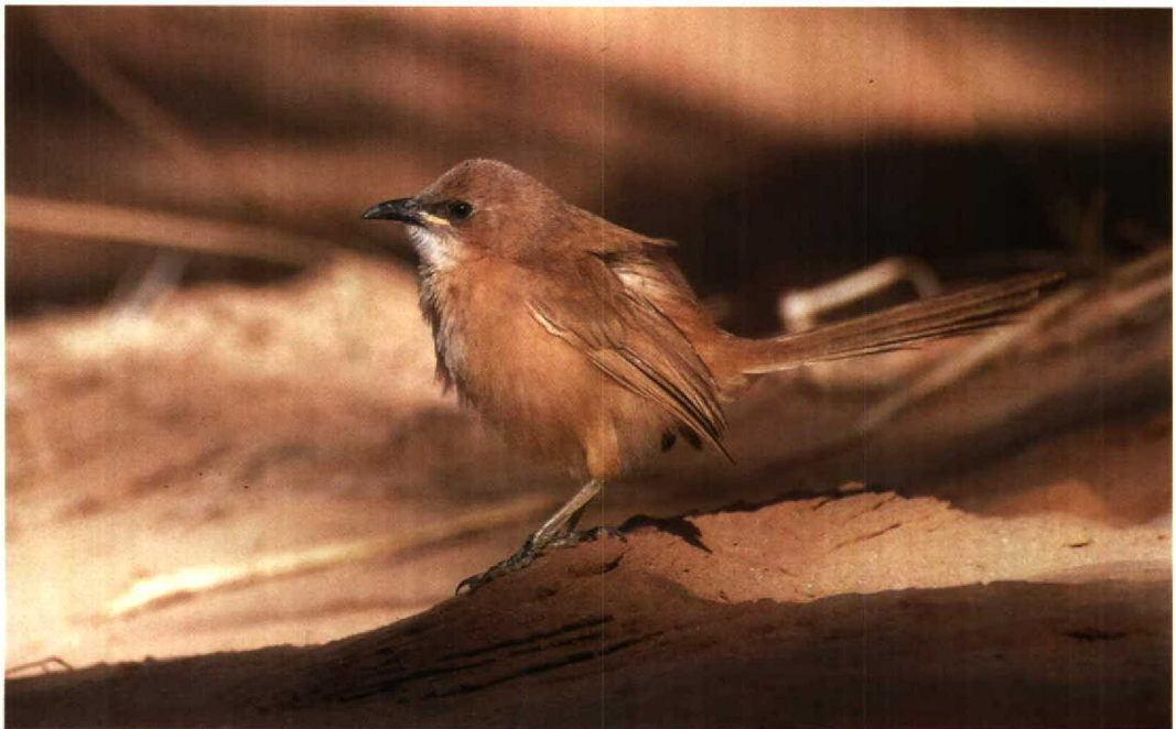
39 Fulvous Babbler / Bruingele Babbelaar Turdoides fulvus, Merzouga, Morocco, January 1991