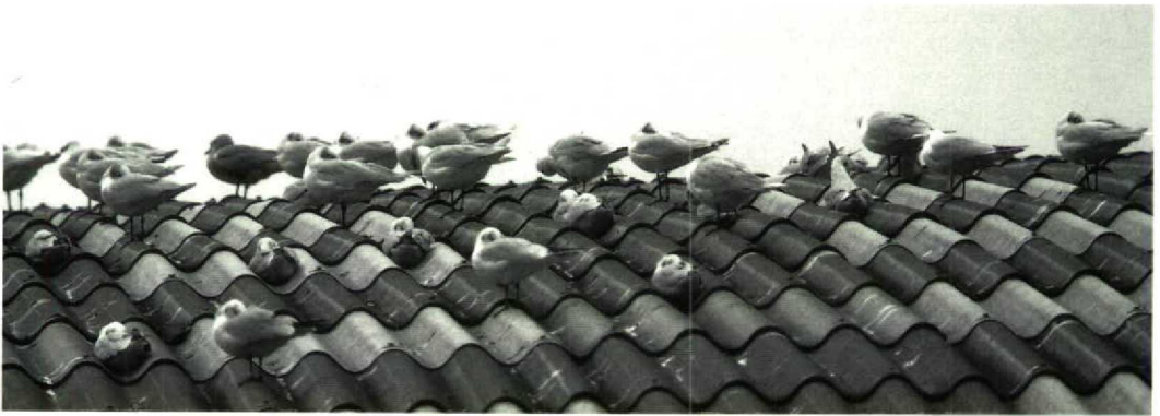
24 Mediterranean Gulls / Zwartkopmeeuwen Larus melanocephalus (part of exceptionally large roof-resting group of 34) including one individual colour-ringed (green C24) as first-winter on 27 December 1991 at Le Portel, Pas-de-Calais, France, with Black-headed Gulls / Kokmeeuwen L. ridibundus and one Kittiwake / Drieteenmeeuw Rissa tridactyla , Le Portel, 7 November 1992 (Arnoud B van den Berg)

Charente-Maritime, with numbers up to 600 (Milbled 1991). North of Bretagne, two other staging and wintering sites showed an increase in numbers in recent years: the western coast of Manche and the harbour of Antifer, Seine-Maritime, both with up to 50-100 birds (Gérard Debout in litt).