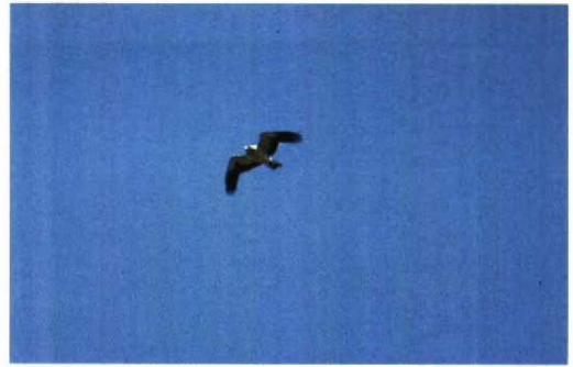
82 Dwergarend / Booted Eagle Hieraaetus pennatus , lichte vorm, Keersluisplas, Flevoland, 24 april 1993

kwam DF tot de volgende reactie: 'Good to see the slides in original. My judgement is mainly based on slides 1, 2 and 4, which show most plumage details and it is: Booted Eagle! The shape of the bird is right for Booted, with longish and square-cut tail and rather short wings with ample tip. The coloration of the upperparts fits perfectly with Booted (upperwing and tail) and from below the pale inner primaries can be seen. Combining all the slides I think you can safely identify the bird as a Booted Eagle, despite the low quality of the slides. The plumage is OK for Booted and all the slides together show the shape of the bird reliably enough to rule out any similarly plumaged Buzzard or Honey Buzzard. In addition the observer has seen the white 'head-lights' at the wing bases, which can not be seen in the slides.'