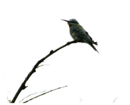
74 Blue-cheeked Bee-eater / Groene Bijeneter Merops persicus , Christiansø, Bornholm, Denmark, June 1989 75 Blue-cheeked Bee-eater / Groene Bijeneter Merops persicus (collected on Scilly, Engeland, 13 July 1921), Isles of Scilly Museum, St Mary's, Scilly, England, October 1992 76 Blue-cheeked Bee-eater / Groene Bijeneter Merops persicus , Cowden, Humberside, England, July 1989 77-79 Blue-cheeked Bee-eater / Groene Bijeneter Merops persicus , Texel, Noordholland, Netherlands, 30 September 1961