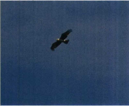
132 Slangearend / Short-toed Eagle Circaetus gallicus , Brecht-Wuustwezel, Antwerpen, juni 1994