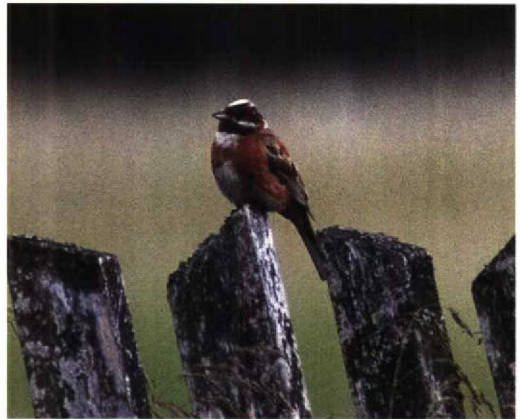
117 Citrine Wagtail / Citroenkwikstaart Motacilla citreola , showing characters of M c werae , Northeim, Niedersachsen, Germany, 26 April 1994 ( Felix Heintzenberg ) 118 Rock Thrush / Rode Rotslijster Monticola saxatilis , Helgoland, Schleswig-Holstein, Germany, 3 May 1994 ( Jochen Dierschke ) 119 Mongolian Finch / Mongoolse Woestijnvink Bucanetes mongolicus , Ishakpasa, Sarayi, Turkey, 29 May 1994 ( Leo J R Boon ) 120 Pine Bunting / Witkopgors Emberiza leucocephalos , Biebrza, Poland, 18 June 1994 ( Carl Derks )

Helgoland on 16 August 1982 has not been accepted and probably concerned another species (cf Dutch Birding 4: 97-98, 1982). The first Mugimaki Flycatcher Ficedula mugimaki for the WP in Humberside on 16-17 November 1991 has also been placed in 'Category D1'.