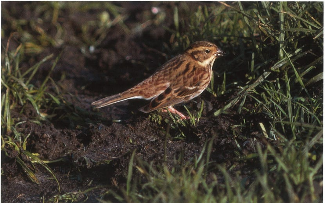
104 Rustic Bunting / Bosgors Emberiza rustica , Petten, Noordholland, 26 October 1992